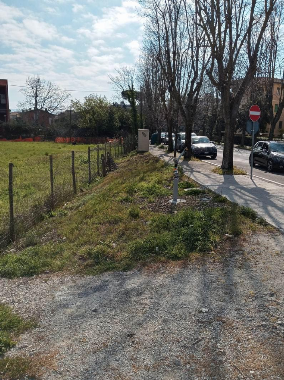
vista dell'ingresso attuale