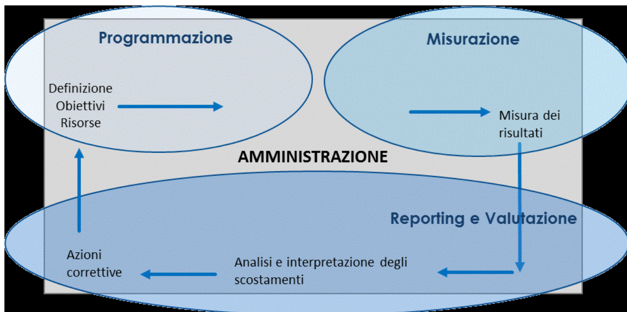
Figura 2 – Il ciclo della Performance (da Linee guida per la relazione annuale sulla performance-Dipartimento Funzione Pubblica-)

Al fine di dare avvio all'intero processo di misurazione e a seguire quello di valutazione, in data 27.12.2021, con nota prot. n 134029/2021 del Segretario Generale/Presidente OdV è stata inviata la richiesta dei report consuntivi per ogni tipologia di obiettivo.