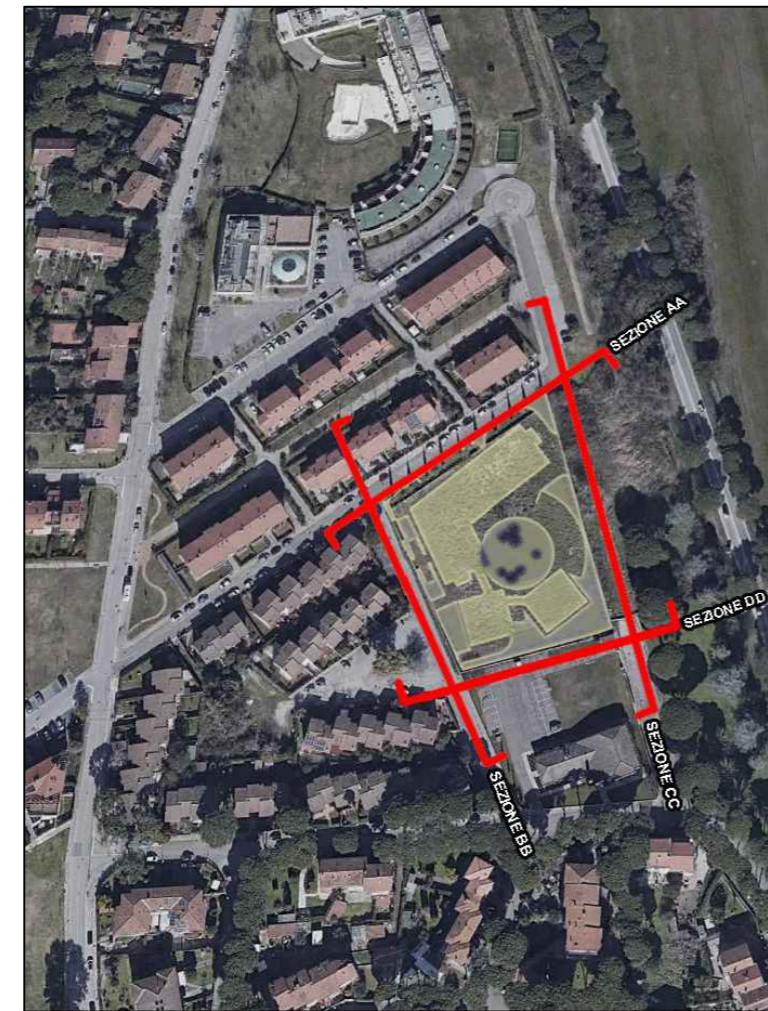
PLANIMETRIA DI RIFERIMENTO CON INDIVIDUAZIONE DELLE SEZIONI