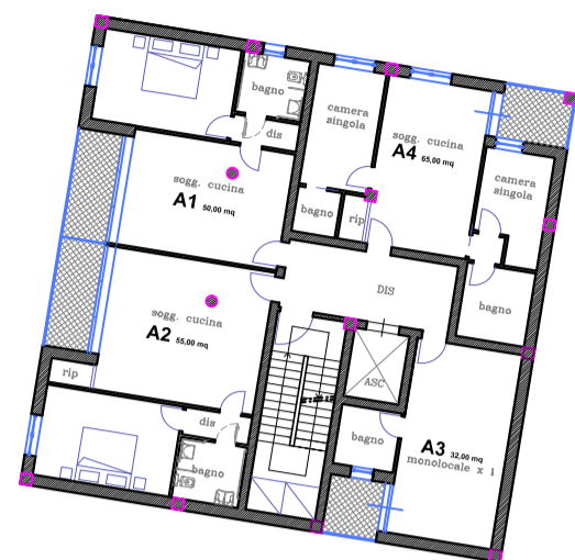
PIANTA PIANO PRIMO-SECONDO SENIOR HOUSING