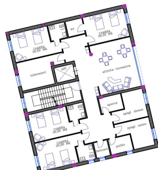
PIANTA PIANO PRIMO E SECONDO RSCC