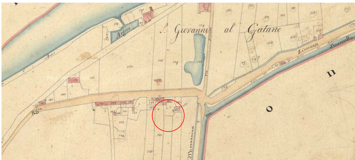
Figura 1 Estratto Catasto storico regionale con individuata l'area di Piano