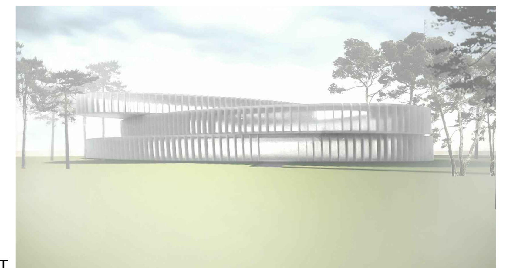
VISTA DA NORD-EST