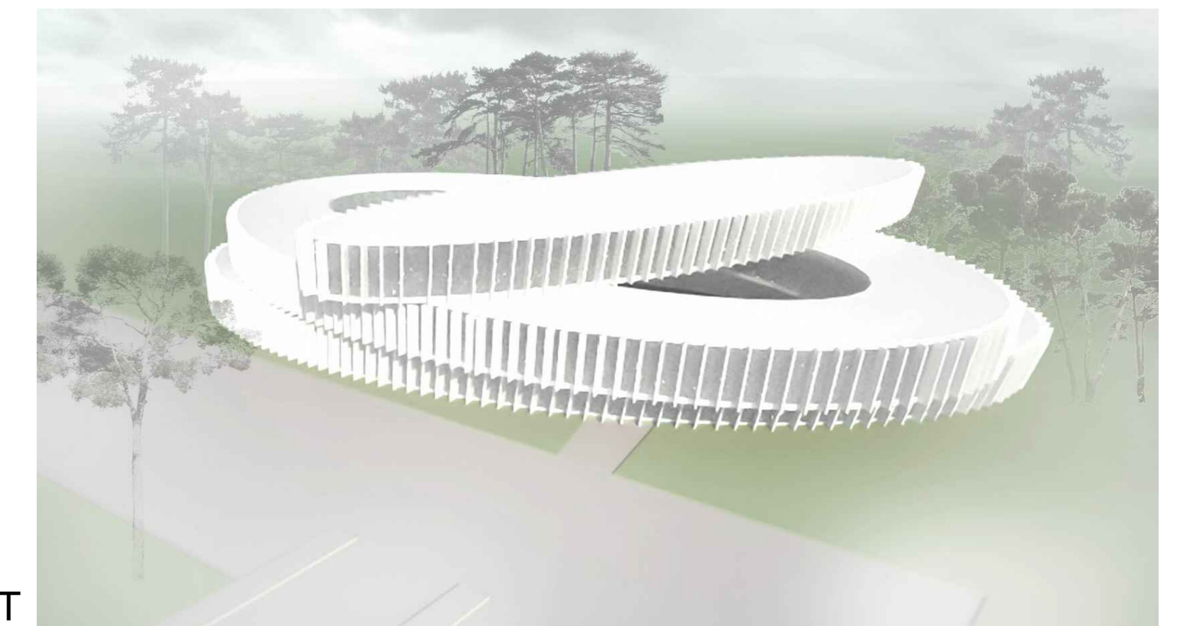
VISTA DALL'ALTO LATO OVEST