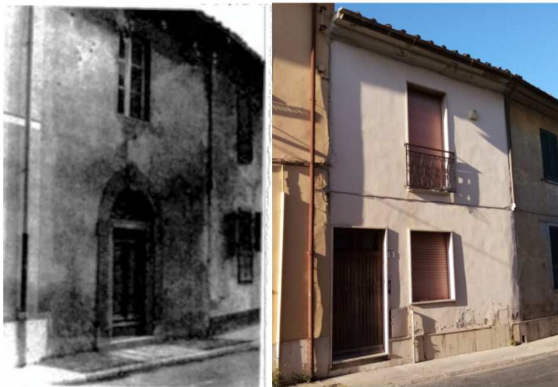
Confronto prospetto ante 59 -attuale