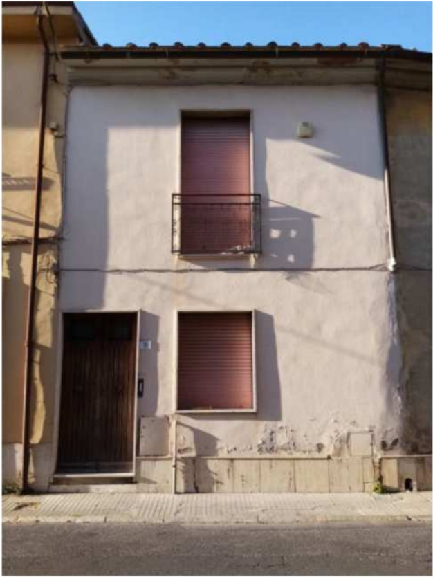
Prospetto su via Cisanello