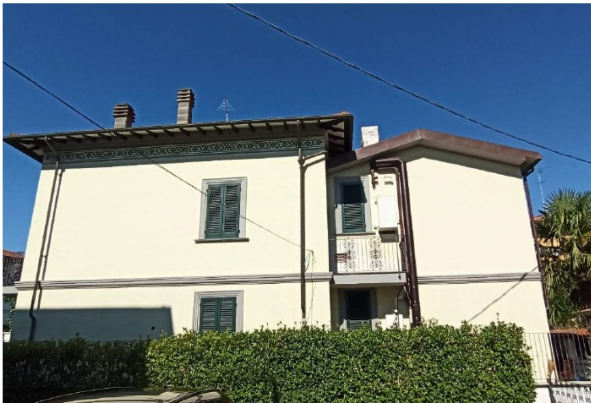
Prospetto laterale est