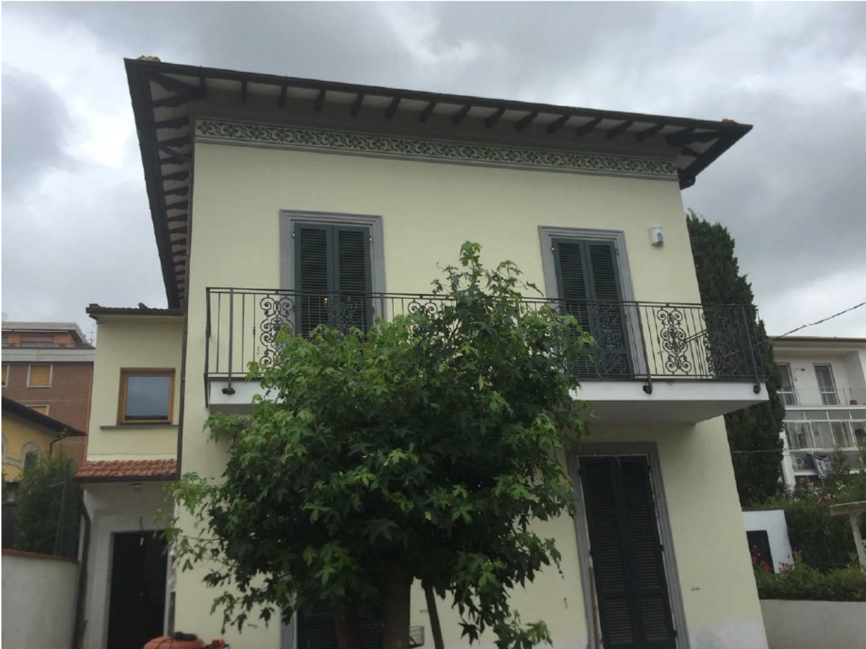
Prospetto su via Chiesa