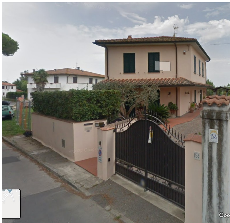
FOTO IMMOBILE OGGETTO DELLA RICHIESTA