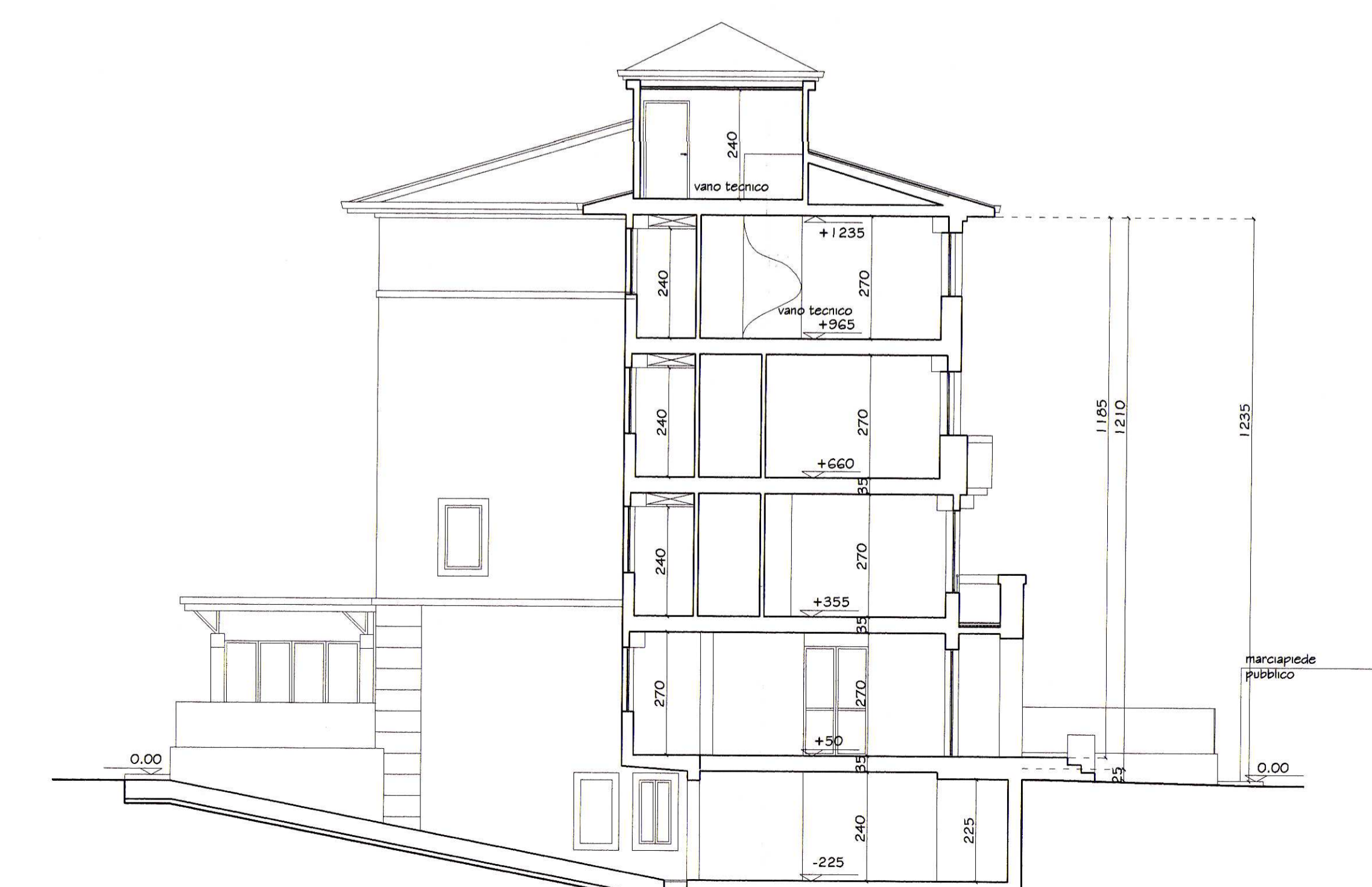
Sezione C - C