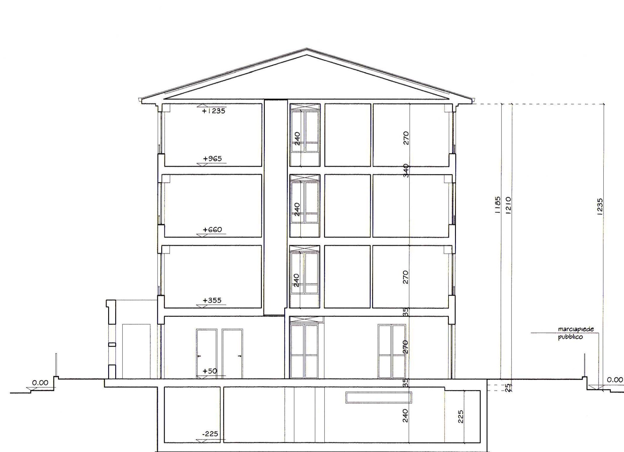
Sezione A - A