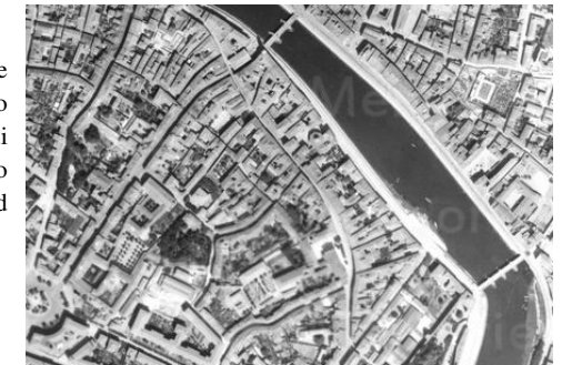
Fig.5 – aerofoto della RAF, 1943

Si nota in questa fase una prima importante edificazione delle aree a tergo del complesso già di S. Domenico poi degli Istituti di Ricovero della città di Pisa, che lascia solo una residua area verde nella parte nord dell'isolato.