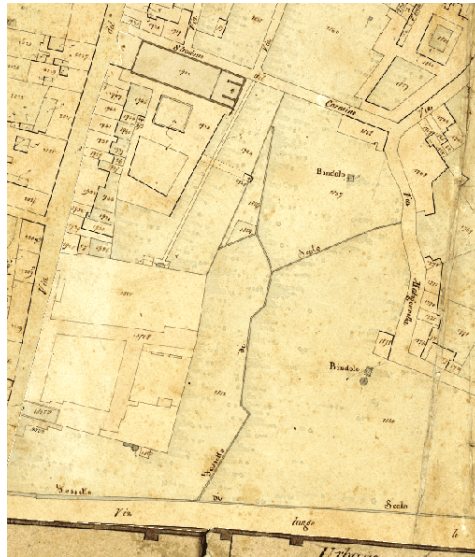
Fig.1 – estratto dal catasto leopoldino

La pianta Van Lint, del 1846, considerata la trasposizione grafica dello stesso Catasto, evidenzia ancor più il carattere agricolo dell'area.