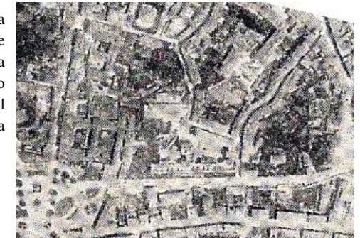
Fig.4- aerofoto, 1925 c.a

Nel corso degli anni '20 del '900 fu avviata la grande urbanizzazione della via già lungo le mura, poi ribattezzata Giovanni Pisano con la realizzazione del grande complesso scolastico e l'edificazione con edifici di abitazione del lato sud, previo abbattimento delle mura medievali.