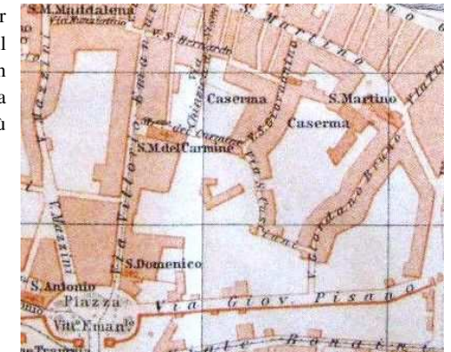
Fig.3 – estratto dalla pianta del 1911

Tale assetto, di origine remota, perdurò per tutto il XIX secolo, salvo la realizzazione, sul finire dello stesso di un unico fabbricato, con pianta ad L, accessibile dalla via Malagonnella, nel frattempo ribattezzata, più decorosamente, via Sancasciani.