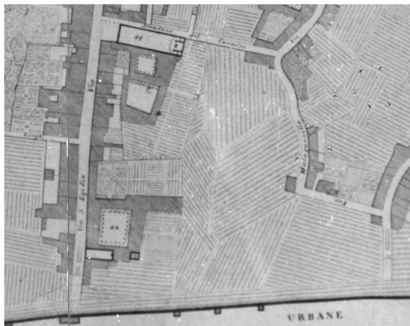
Fig.2 – Estratto pianta Van Lint

Tale assetto, di origine remota, perdurò per tutto il XIX secolo, salvo la realizzazione, sul finire dello stesso di un unico fabbricato, con pianta ad L, accessibile dalla via Malagonnella, nel frattempo ribattezzata, più decorosamente, via Sancasciani.