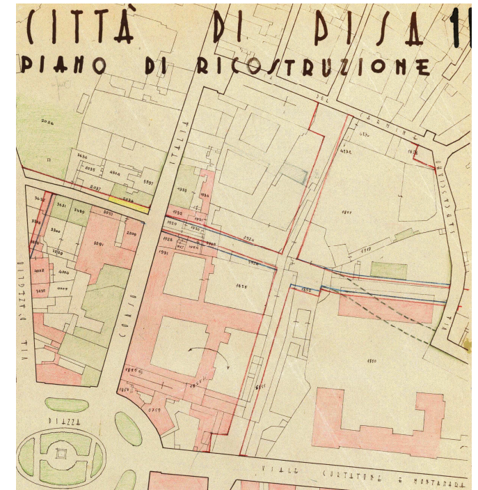
Fig.5- Piano di Ricostruzione, tav.1B

La nuova previsione viaria portò come conseguenza che le aree che in precedenza erano destinate ad orti e giardini si trasformarono in aree edificabili, con la possibilità di realizzare un centro direzionale (come nello spirito del piano) in prossimità della stazione.