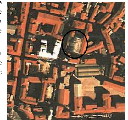
Fig.6. Aerofoto del 1986

Nei primi anni '50 vennero così realizzati nella nuova via, intestata a Filippo Turati, immobili destinati in parte a funzioni direzionali (uffici, negozi, alberghi) in parte ad abitazioni l'isolato fu completamente saturato.