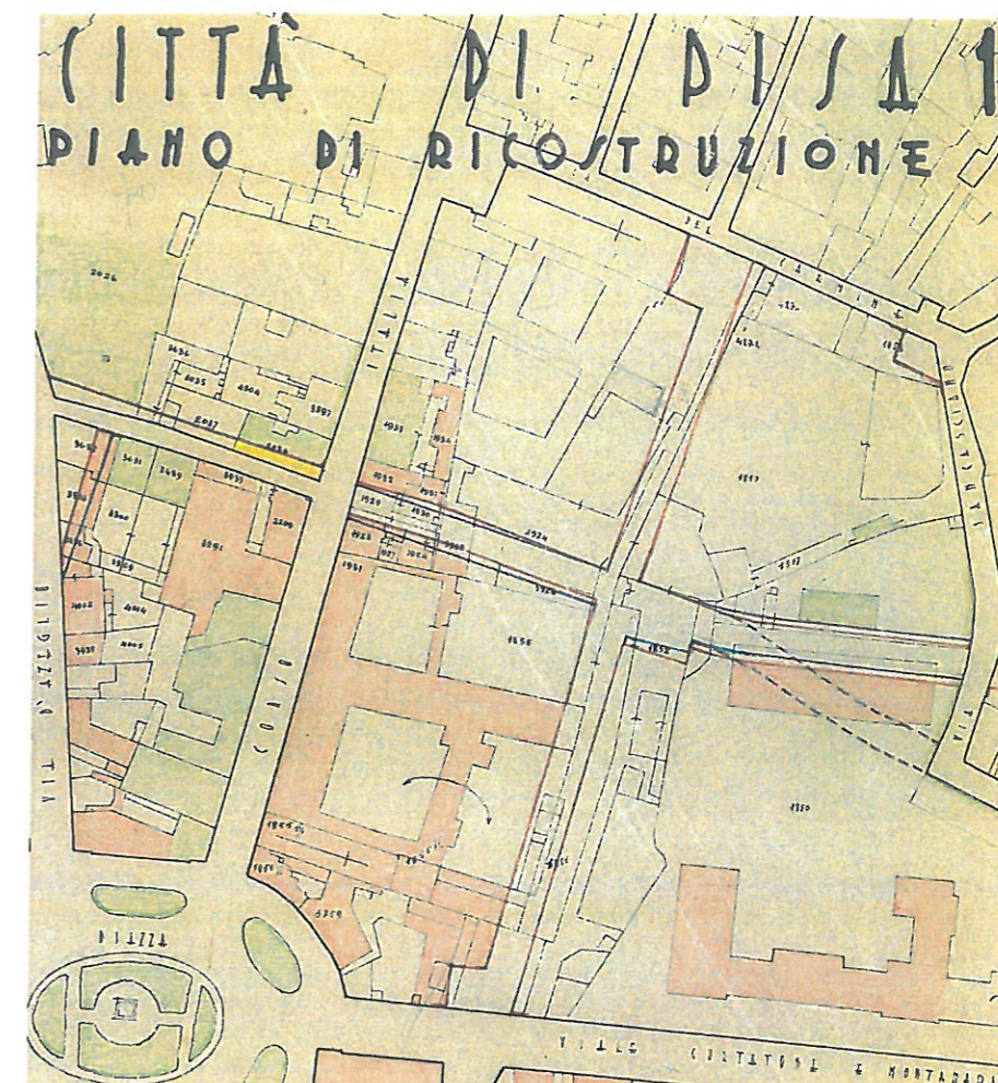
Fig.5- Piano di Ricostruzione, tav.1B

La nuova previsione viaria portò come conseguenza che le aree che in precedenza erano destinate ad orti e giardini si trasformarono in aree edificabili, con la possibilità di realizzare un centro direzionale (come nello spirito del piano) in prossimità della stazione.