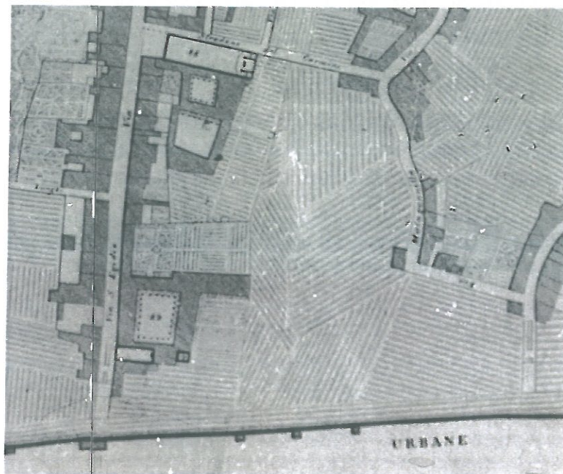
Fig.2 – Estratto pianta Van Lint

La pianta Van Lint, del 1846, considerata la trasposizione grafica dello stesso Catasto, evidenzia ancor più il carattere agricolo dell'area.