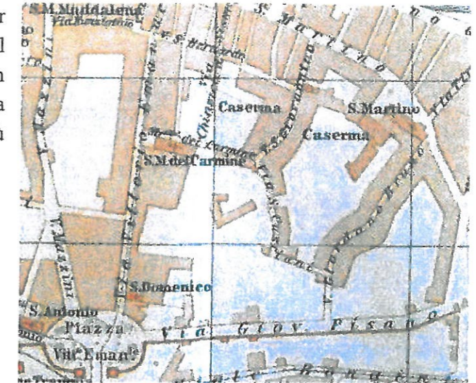
Fig.3 – estratto dalla pianta del 1911

Tale assetto, di origine remota, perdurò per tutto il XIX secolo, salvo la realizzazione, sul finire dello stesso di un unico fabbricato, con pianta ad L, accessibile dalla via Malagonnella, nel frattempo ribattezzata, più decorosamente, via Sancasciani.