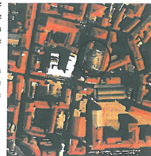
Fig.6. Aerofoto del 1986

Nei primi anni '50 vennero così realizzati nella nuova via, intestata a Filippo Turati, immobili destinati in parte a funzioni direzionali (uffici, negozi, alberghi) in parte ad abitazioni l'isolato fu completamente saturato.