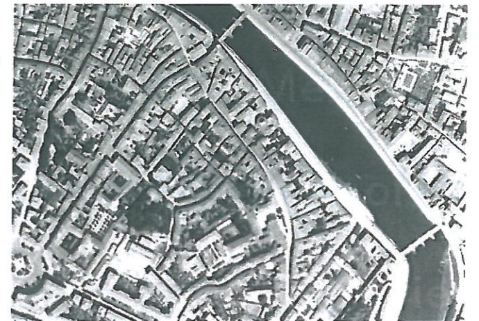
Fig.5 – aerofoto della RAF, 1943

Si nota in questa fase una prima importante edificazione delle aree a tergo del complesso già di S. Domenico poi degli Istituti di Ricovero della città di Pisa, che lascia solo una residua area verde nella parte nord dell'isolato.