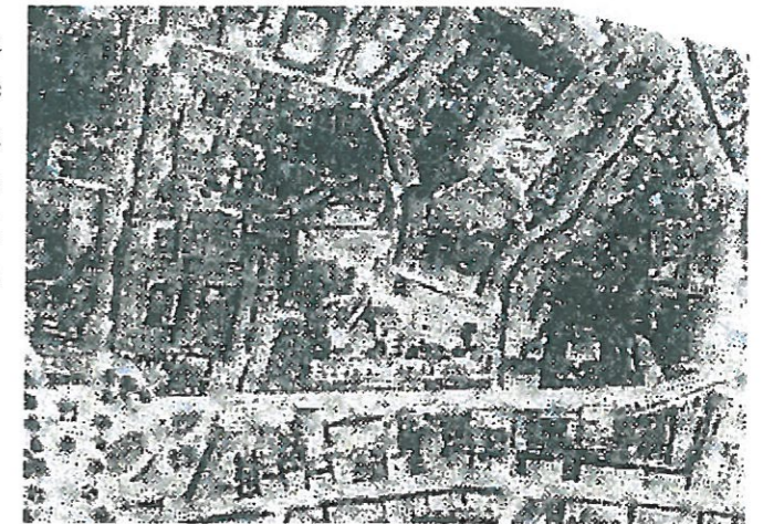
Fig.4 - aerofoto, 1925 c.a

Nel corso degli anni '20 del '900 fu avviata la grande urbanizzazione della via già lungo le mura, poi ribattezzata Giovanni Pisano con la realizzazione del grande complesso scolastico e l'edificazione con edifici di abitazione del lato sud, previo abbattimento delle mura medievali.