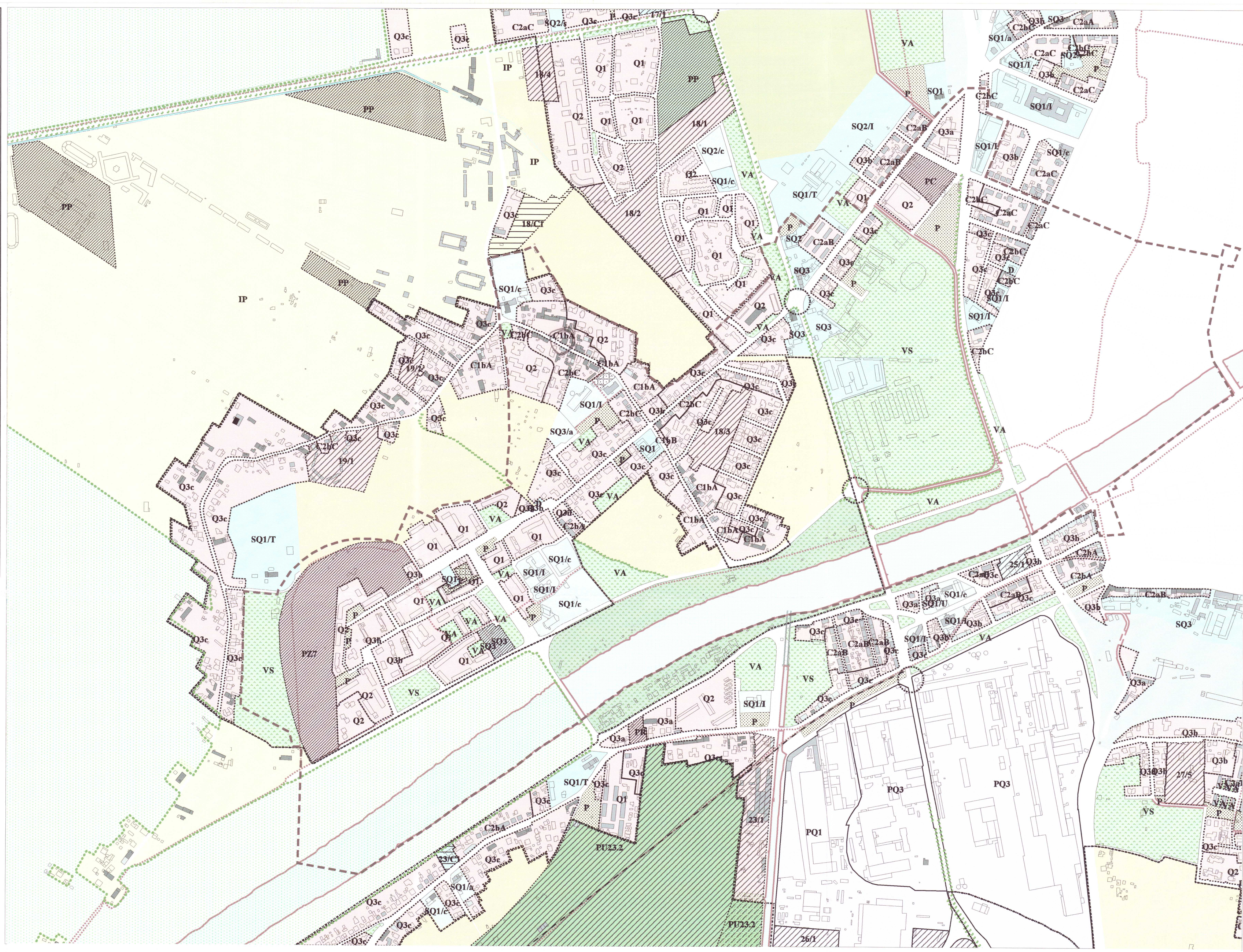
R.U. STATO ATTUALE

Luglio 2004 VARIANTE AL R.U. VIGENTE TAV. 3a