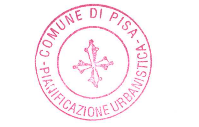
Tavola modificata con l'approvazione definitiva delibera del Consiglio Comunale n.70 del 17 dicembre 2001