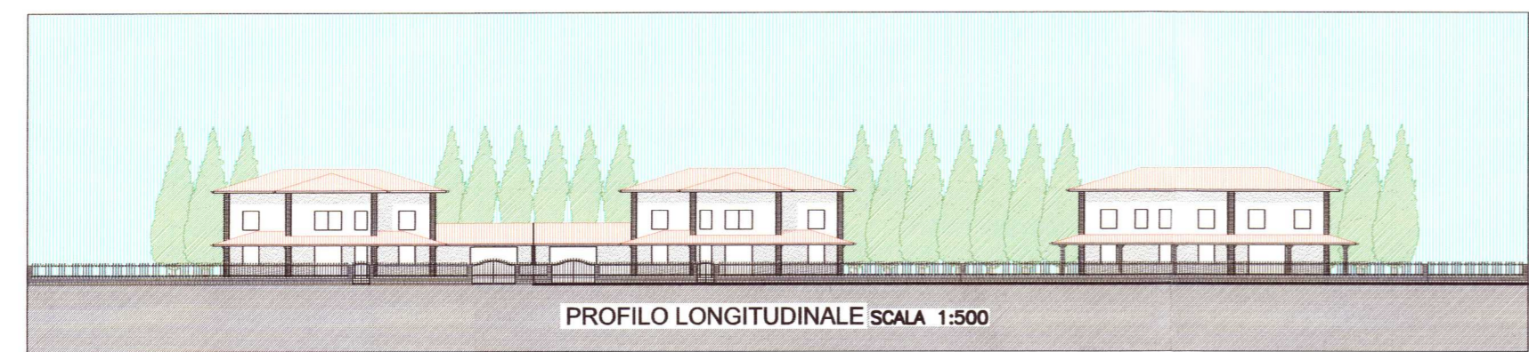
PROFILO LONGITUDINALE SCALA 1:500