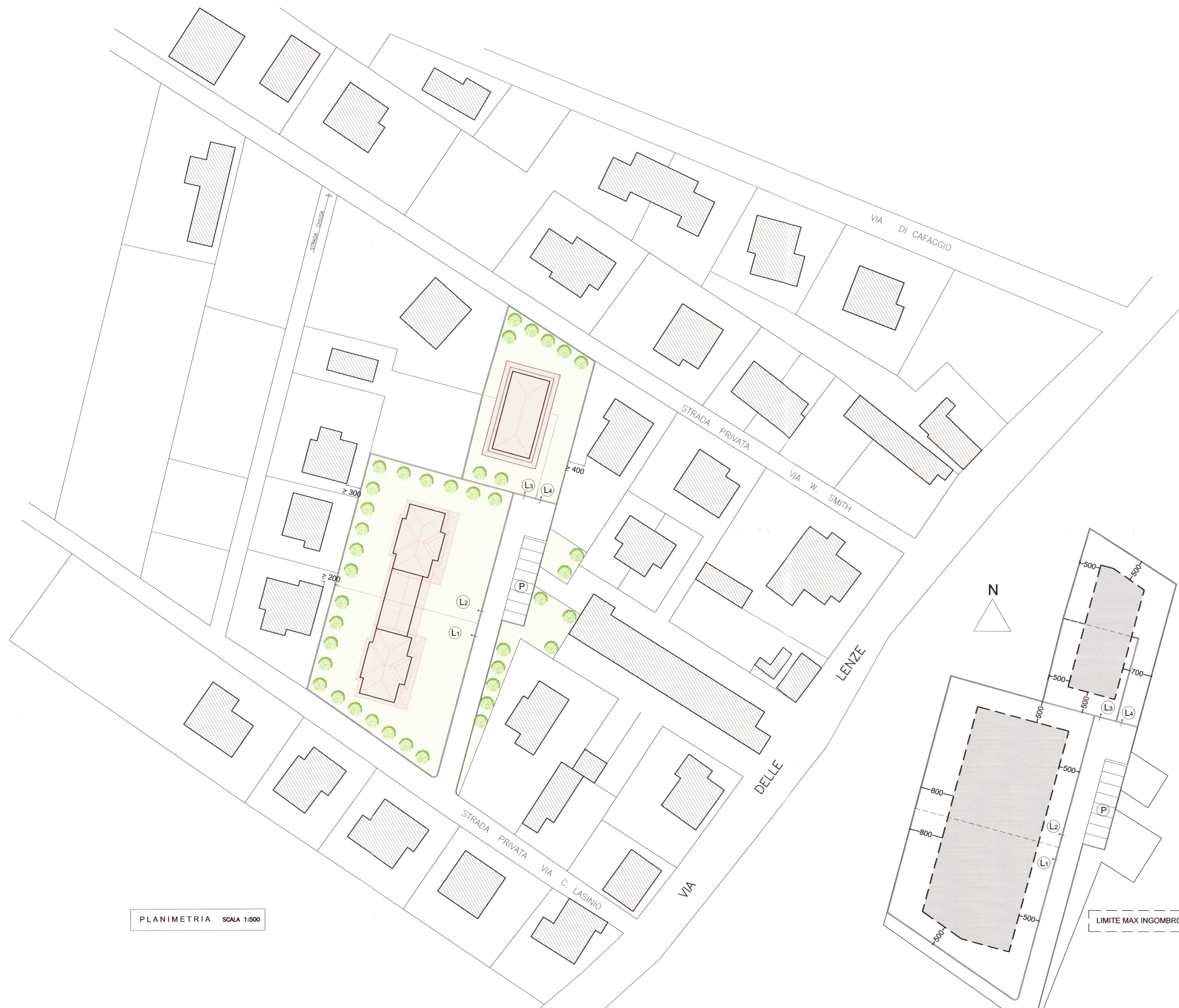
PLANIMETRIA SCALA 1:500