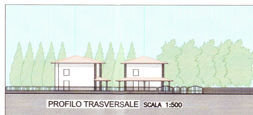
PROFILO TRASVERSALE SCALA 1:500