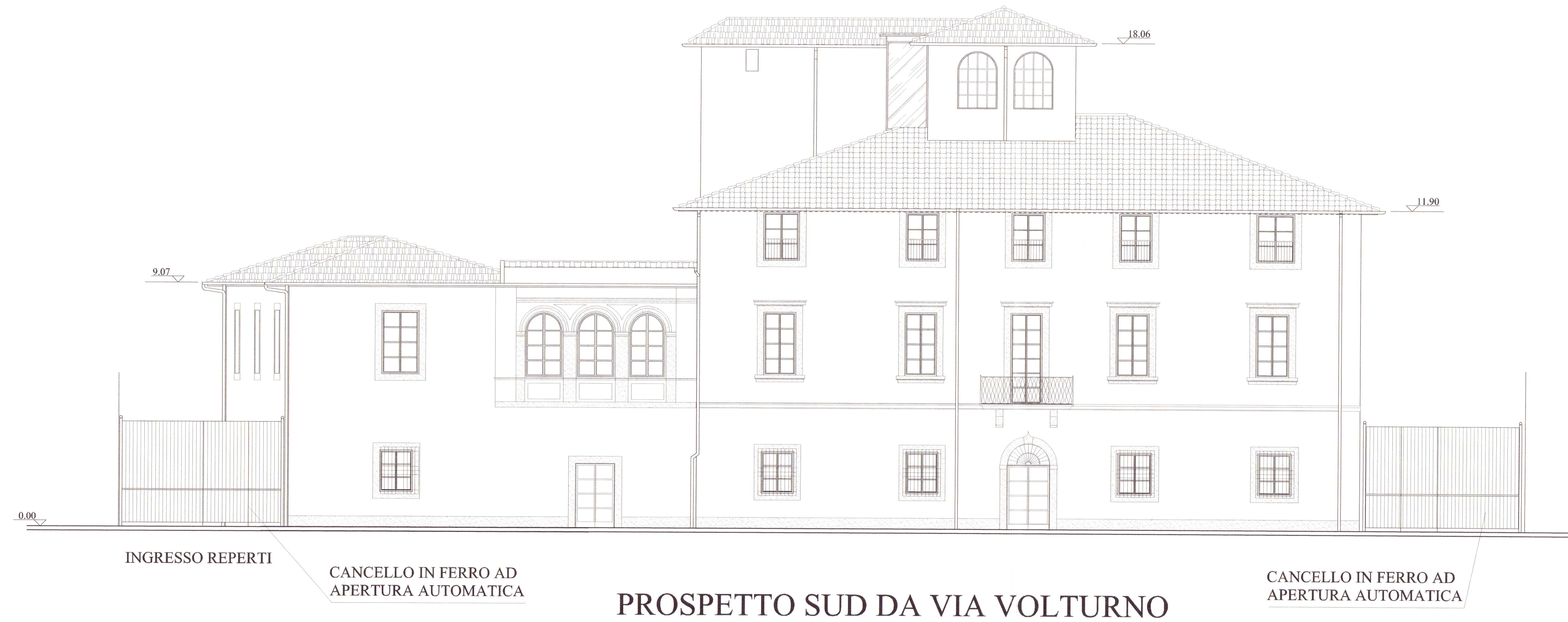
PROSPETTO SUD DA VIA VOLTURNO