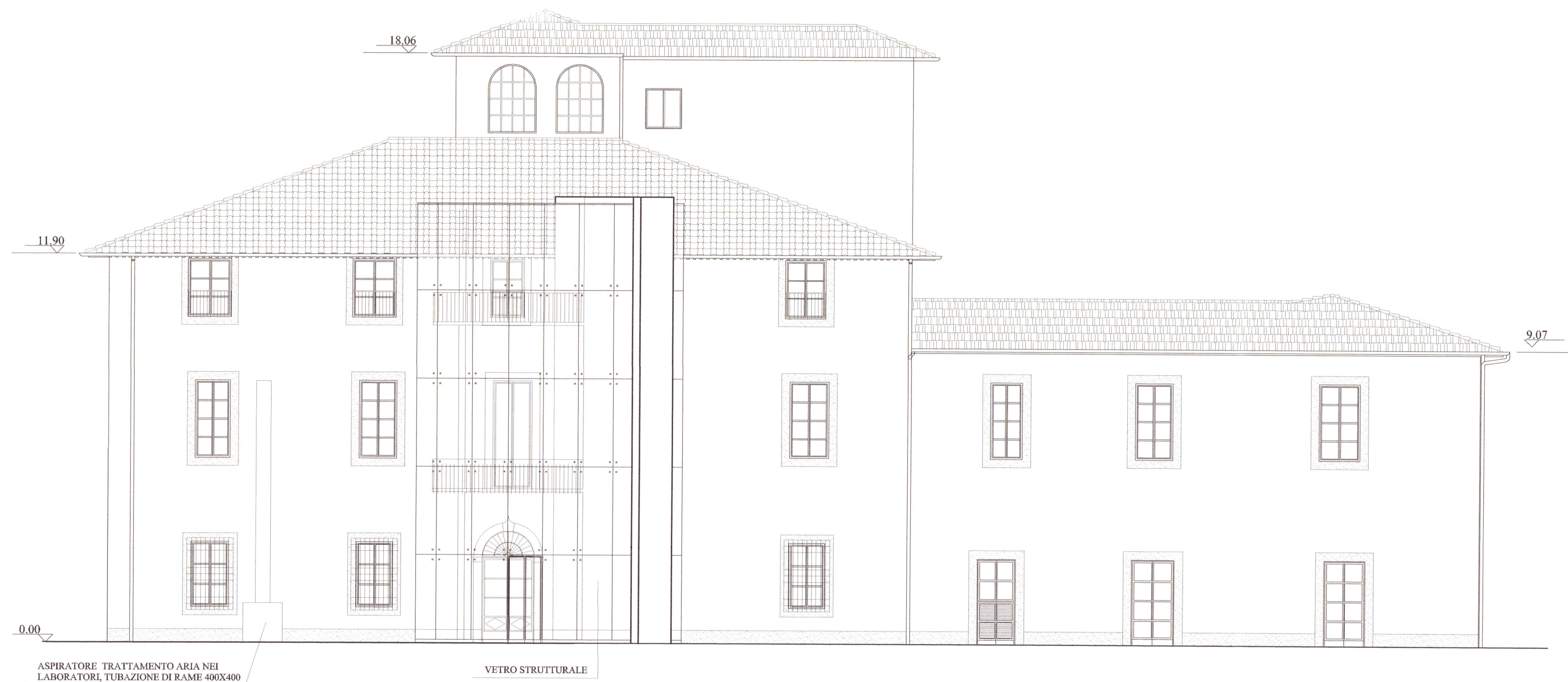
PROSPETTO NORD DAL GIARDINO