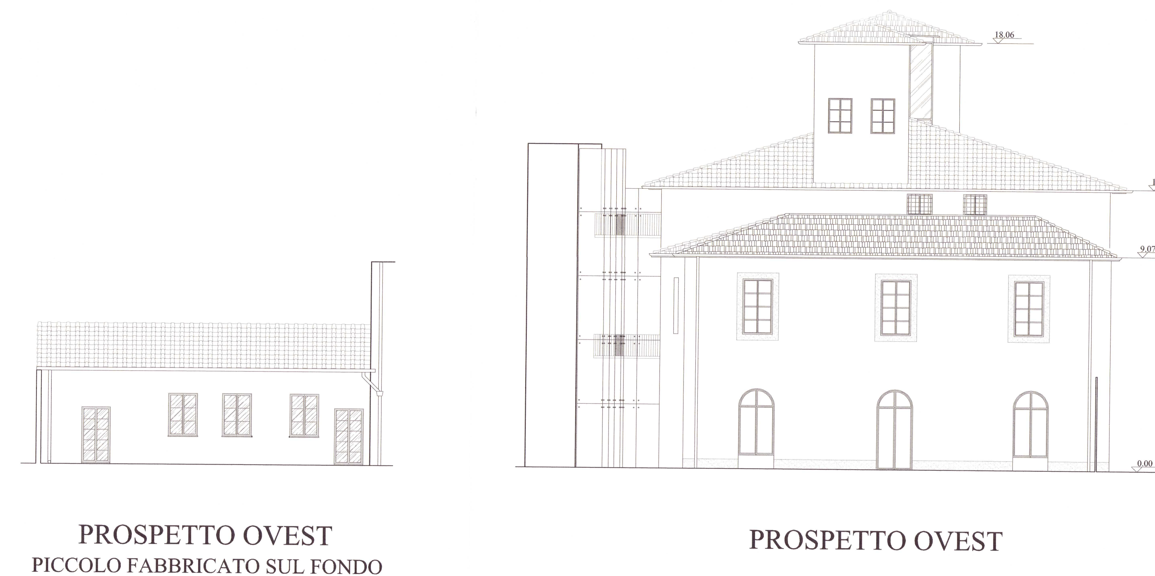
PROSPETTO OVEST PICCOLO FABBRICATO SUL FONDO