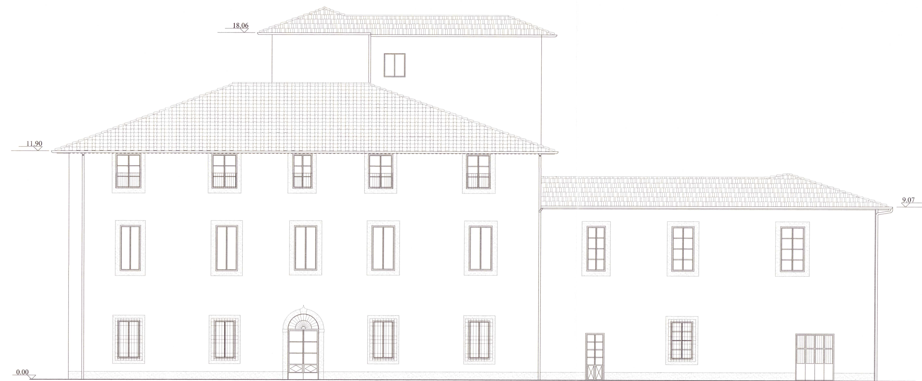
PROSPETTO NORD DAL GIARDINO INTERNO