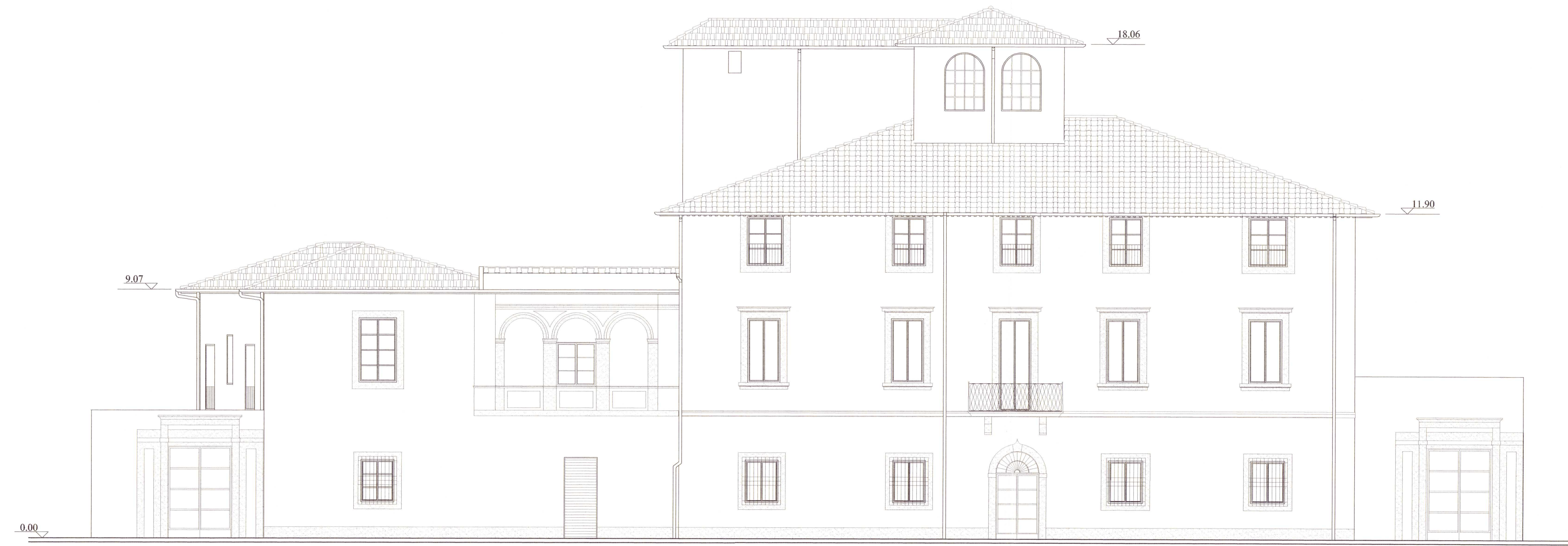
PROSPETTO SUD DA VIA VOLTURNO