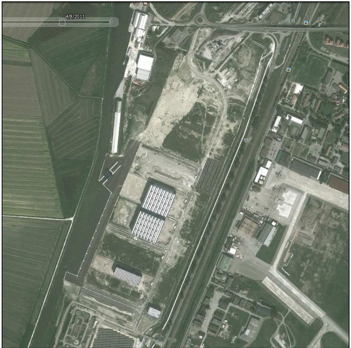
Fig. 2 – STATO PRIMA FASE DEI LAVORI ANNI 2006/2012