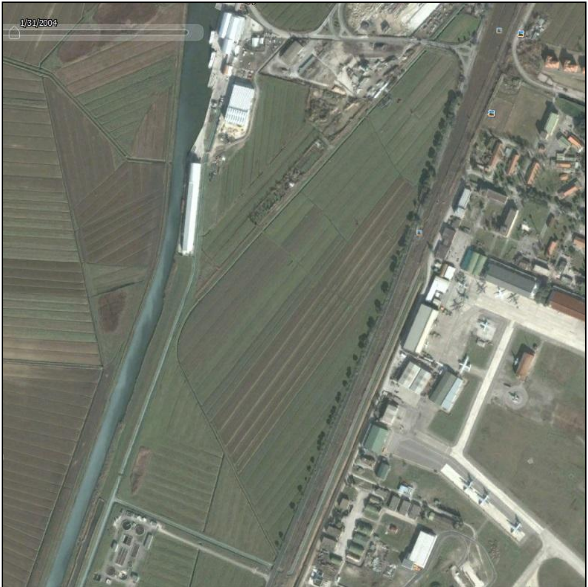
Fig. 1 – STATO ANTE PIANO ATTUATIVO 2005