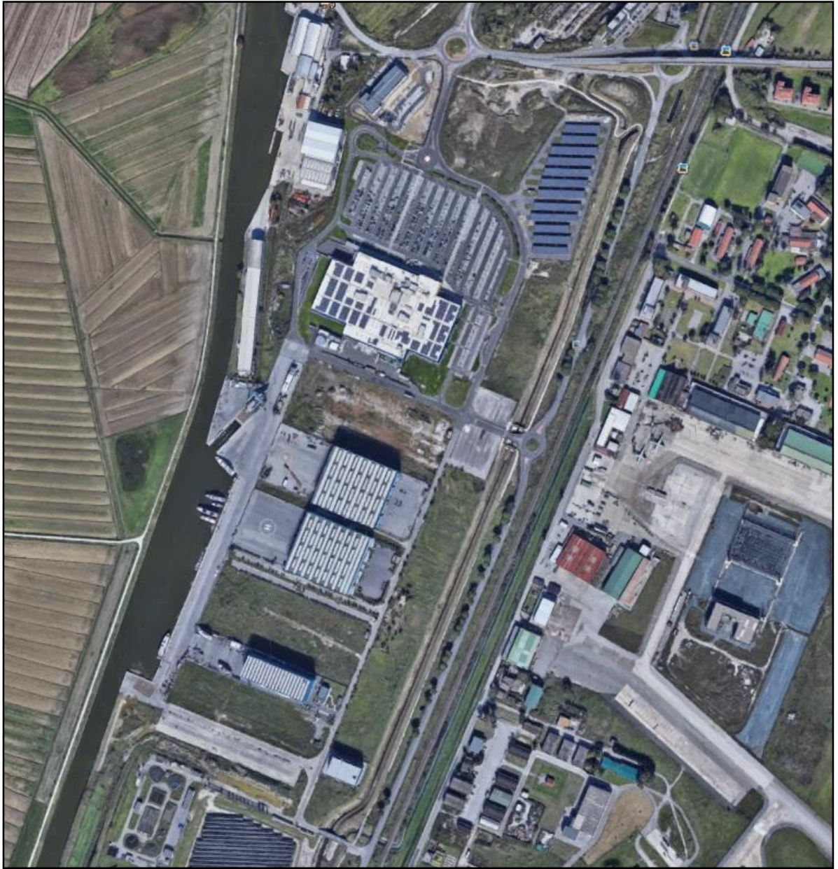
Fig. 3 – STATO SECONDA FASE DEI LAVORI ANNI 2012/2017