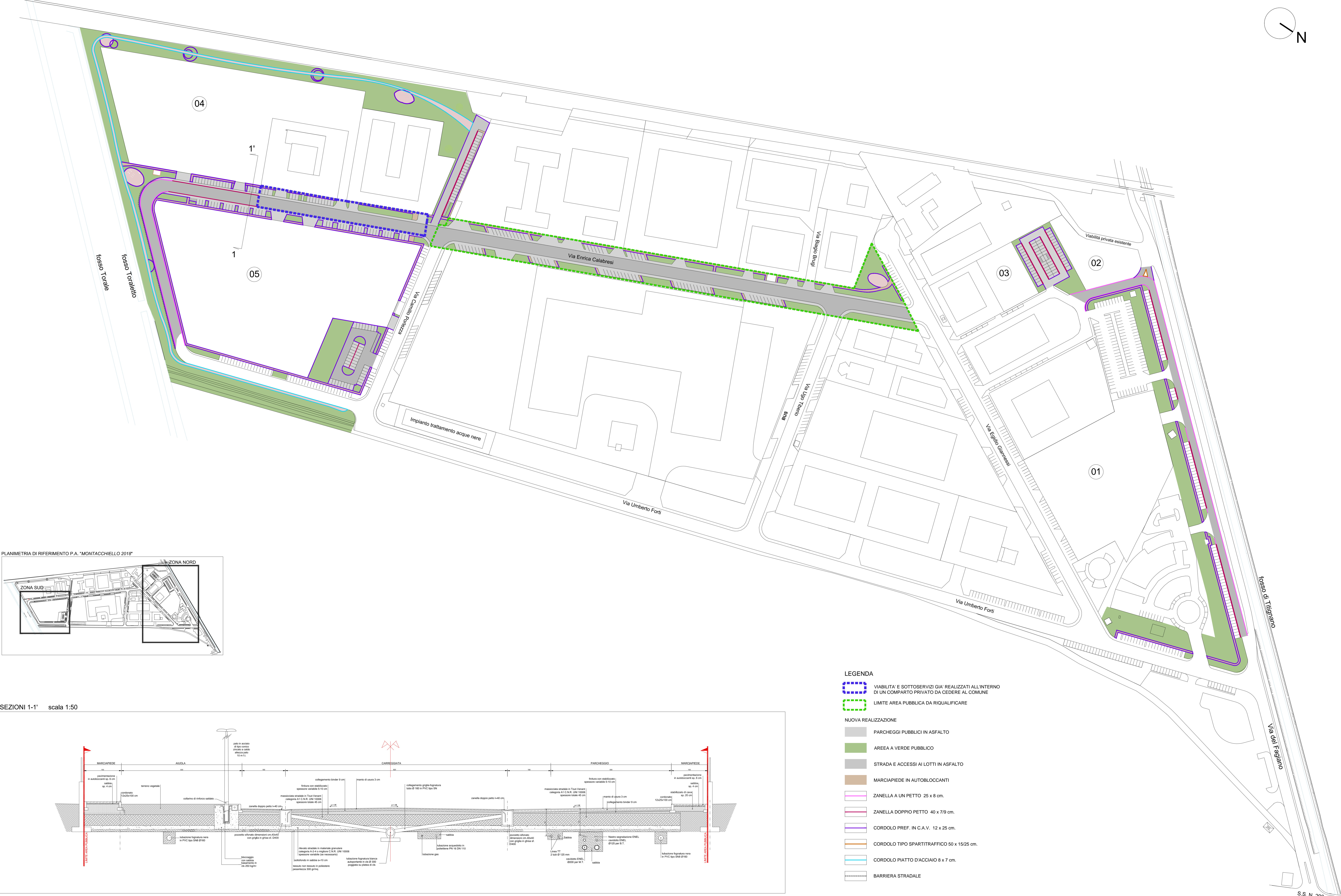
PLANIMETRIA DI RIFERIMENTO P.A. "MONTACCHIELLO 2018"