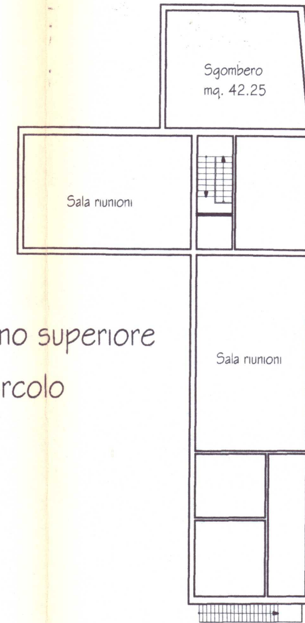
Pianta piano superiore Circolo