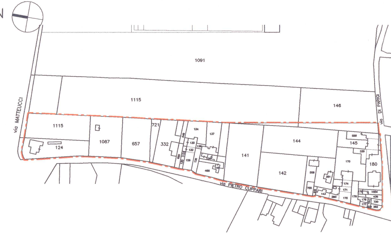
Elenco catastale delle proprietà