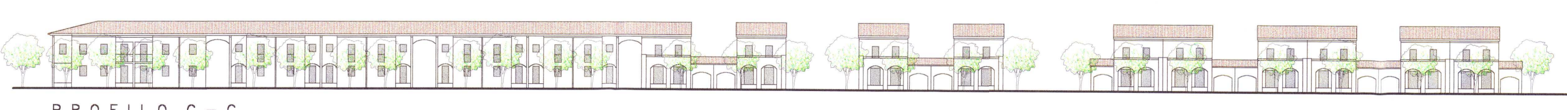
PROFILO C - C