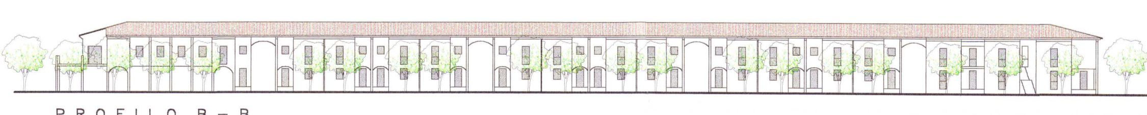
PROFILO B - B