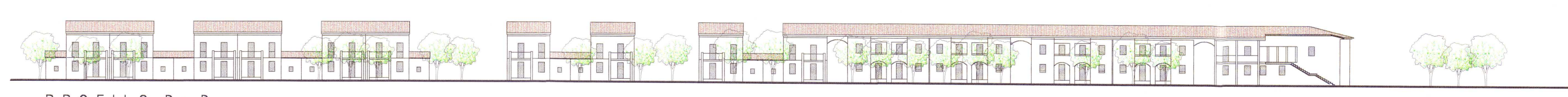
PROFILO D - D