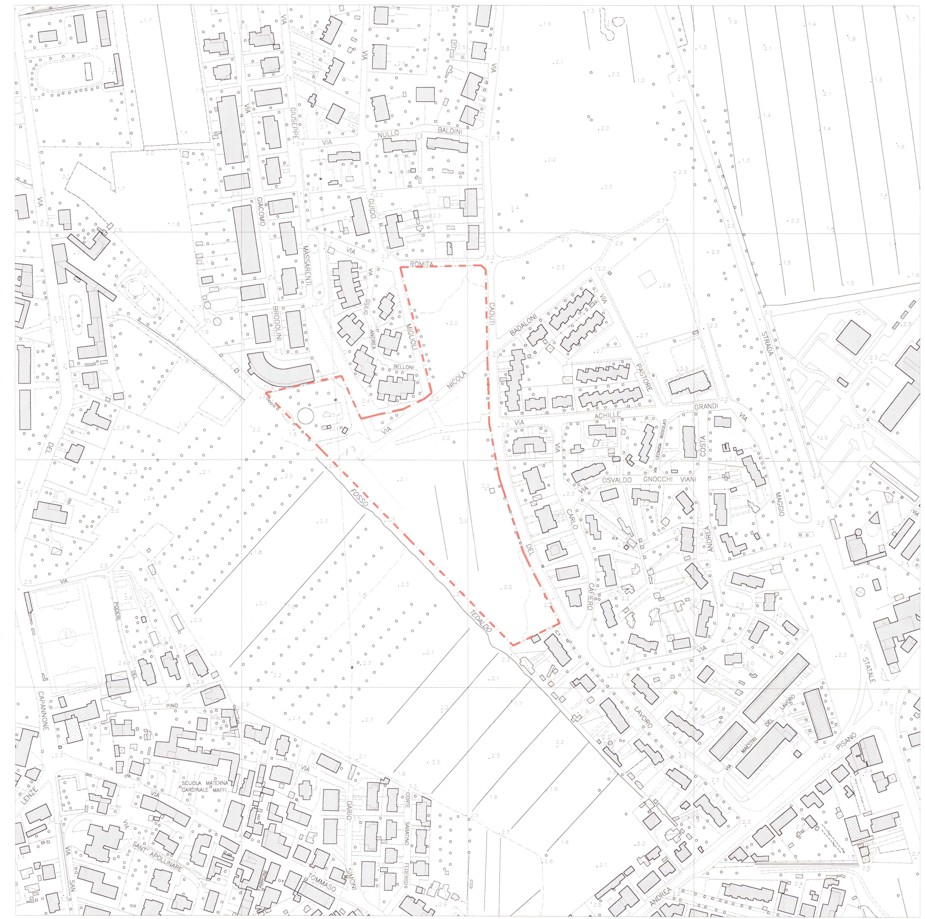
AEROFOTOGRAMMETRICO scala 1 : 2000 LIMITE DEL COMPARTO DI INTERVENTO - - - - -