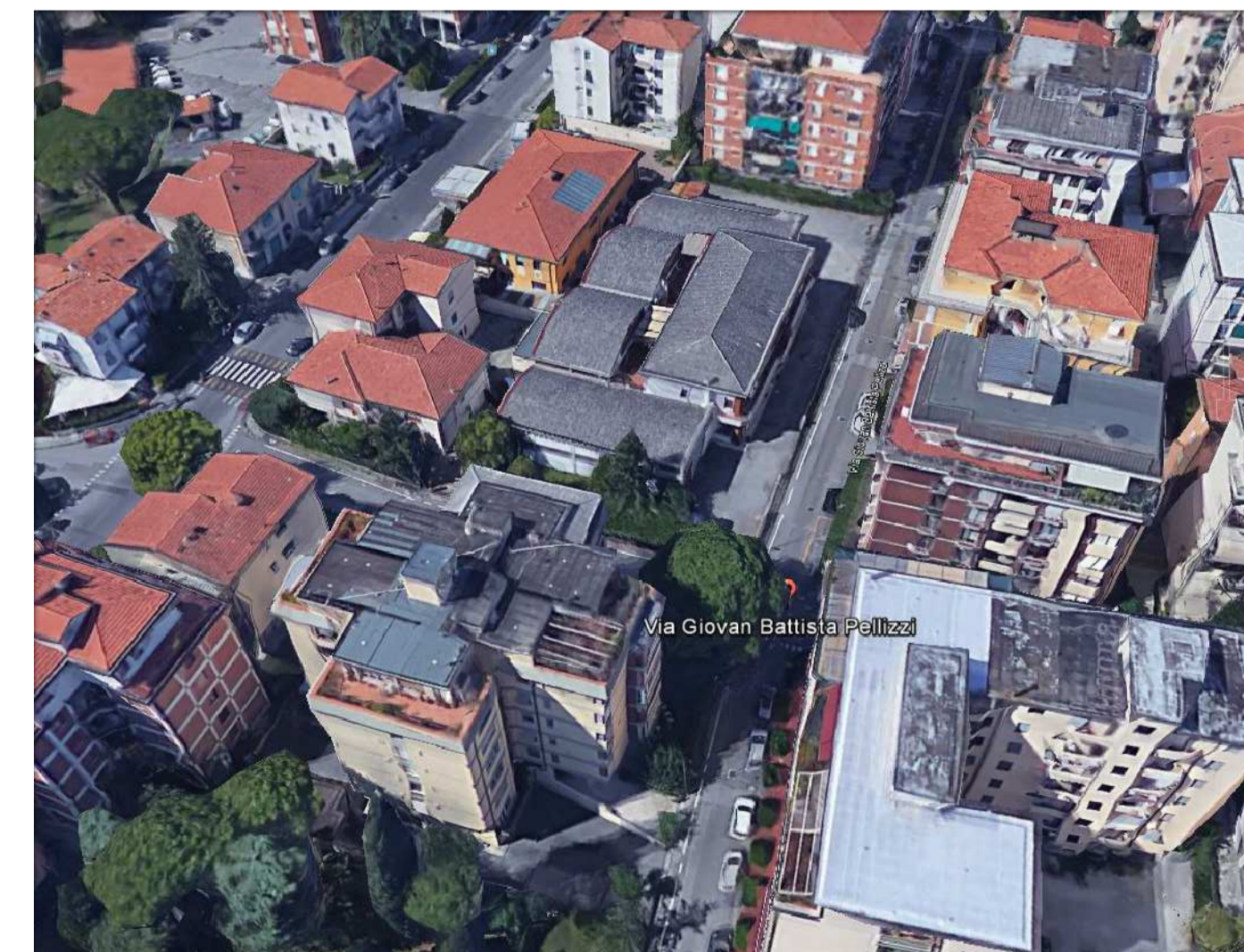
PROFILI ALTIMETRICI VIA PELLIZZI - SCALA 1:500