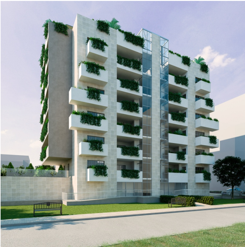
VISTA lato principale

L'accesso carrabile al edificio avverrà con percorso a senso unico con ingresso dal lato est( via medaglie d'oro ) ed uscita dal lato nord ovest su via Pellizzi , con un passaggio