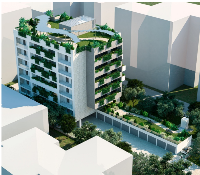
Vista lato sud- est