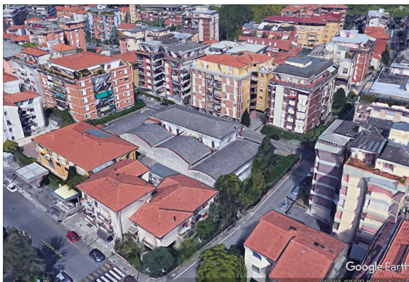
Vista lato sud- est

Studio : PISA via Putignano 294 - tel./fax 050/983118 - P.iva 0130232 050 0 e- mail info@baggianiarchitetto.it