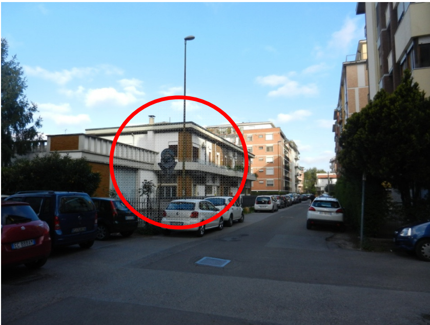
Immagine di via Pellizzi lati est

Il piano terra come si evince dalle tav. grafiche e DOC fotografica risulta costituito da tre locali distinti , un locale commerciale con servizio igienico a cui si accede da portone tipo artigianale ; un locale centrale intermedio ad uso commercio all'ingrosso suddiviso in tre stanze ed infine un altro ampio locale sul lato ovest con uffici. La sede stradale è di larghezza ml 8.10 ed è sprovvista di marciapiede su entrambi i lati . Le altezze interne vano da un min di H 4 ml ad un massimo di H 7,50 . Al piano primo , di H 3 ml si trovano le due abitazioni del proprietario accessibili da vano scala interno all'edificio ed indipendente . Nel contesto, molto urbanizzato, NON sono presenti aree verdi e/o giardini pubblici e/o spazi di aggregazione. Gli edifici esistenti sono posti a poca distanza l'uno dall'altro e lasciando pochissimi spazi di marginalità. L'edilizia è molto intensiva e spontanea con scarsa qualità architettonica ed urbana, pur essendo un quartiere molto richiesto per la sua vicinanza al centro storico ed alle mura storiche .