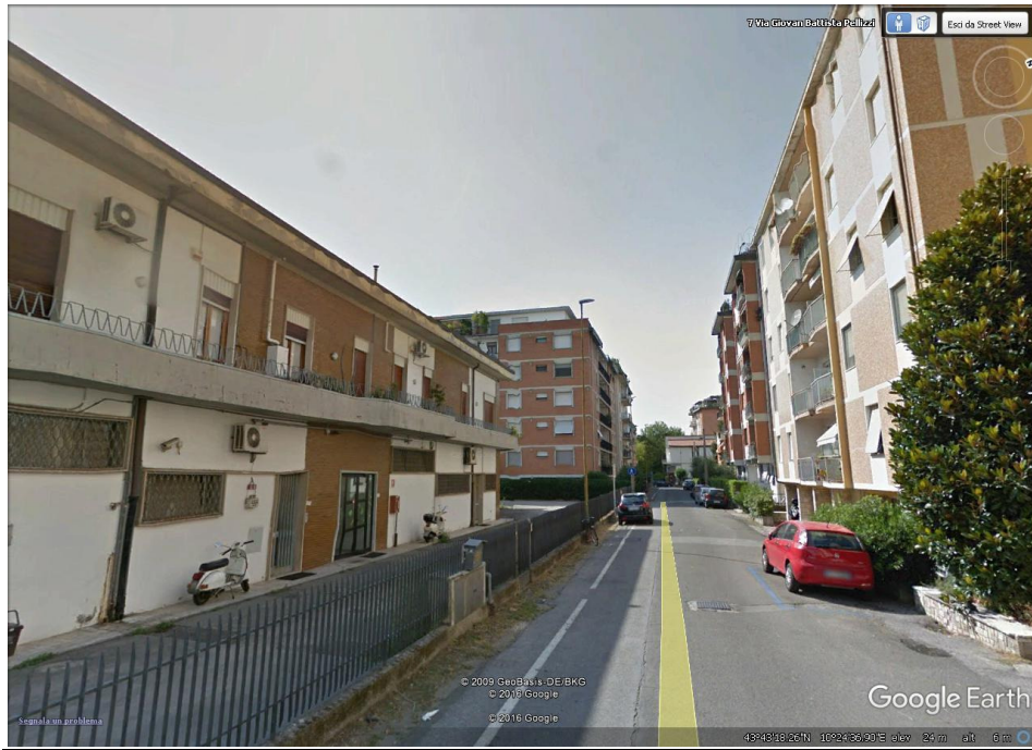
Particolare della via Pellizzi