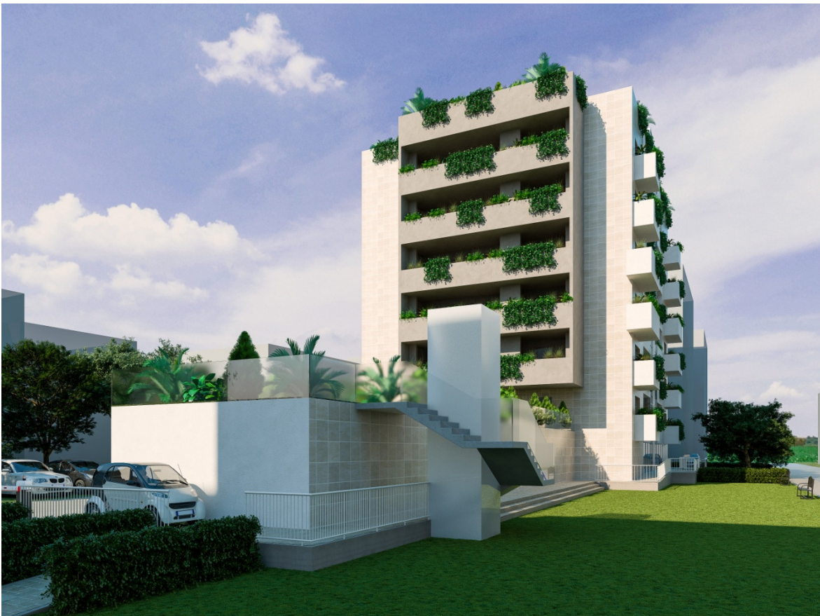
VISTA lato est

In conformità alla cartografia del PGRA , approvata con D.D. N 9 del 14.03.17 che individua il battente idraulico a 3.90mt slmm ; la quota di via Pellizzi fissata dal PC è di 318mt slmm . meglio specificata nella relazione idraulica allegata . Detto ciò tutto il piano terra, comprensivo della zona destinata a parcheggi privati , sarà impostato ad una quota di sicurezza idraulica di massima piena duecentennale + 0,72 cm rispetto alla via Pellizzi .Mentre la zona di ingresso al condominio sarà impostata ad un'ulteriore quota di margine di sicurezza + 1.02 mt . Tale dislivello verrà superato con idonee rampe carrabili e pedonali come indicato in progetto .