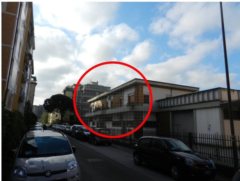
Immagine di via Pellizzi lati ovest