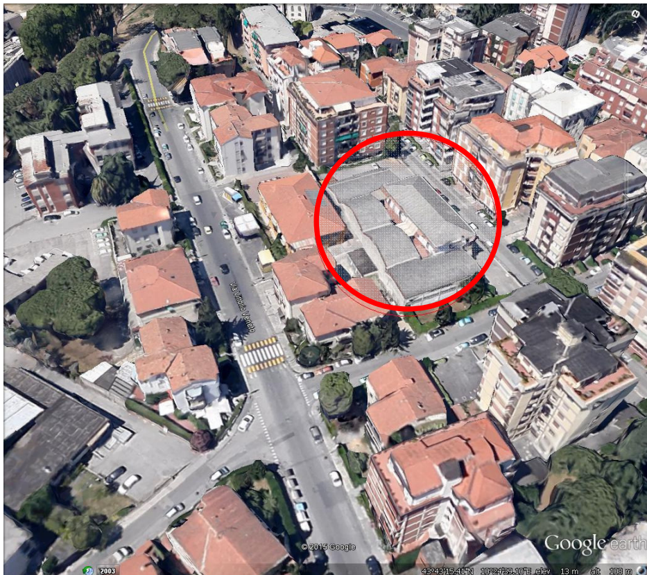
Posizione e contesto architettonico

Il contesto del fabbricato è sostanzialmente residenziale servito con alcune piccole attività commerciali (farmacia, panificio, alimentari ,poste ) buona a zona residenziale a pochi passi dal centro storico che si raggiunge attraverso via san Francesco in pochi minuti di passeggiata . Le scuole elementari e medie sono distanti circa 200 mt , ed i lungarni si trovano a circa 550 mt.