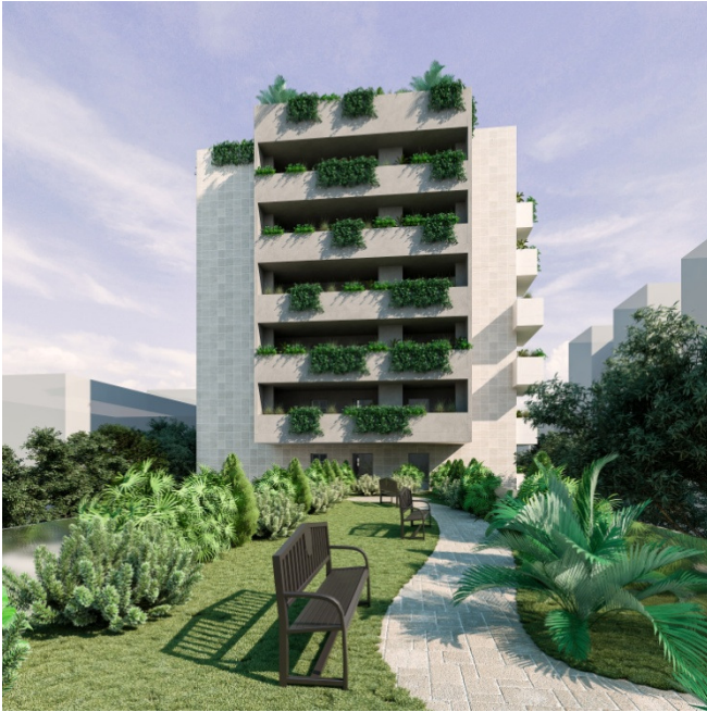
Vista dal giardino pensile a quota