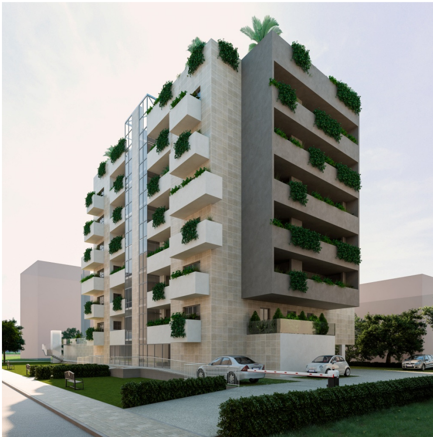
Vista lato nord ovest da via Pellizzi

Parte B stato di progetto ----- da pag 13