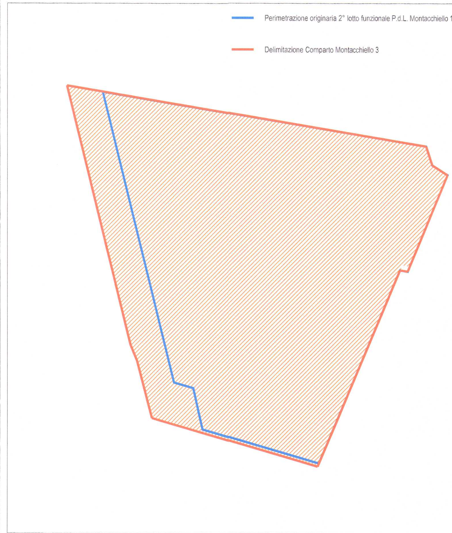
DIMENSIONAMENTO E SPAZI A STANDARDS URBANISTICI

Giugno 2008 - agg. novembre 2008 scala: 1:1000 - 1:2000 Tav. n° 05b