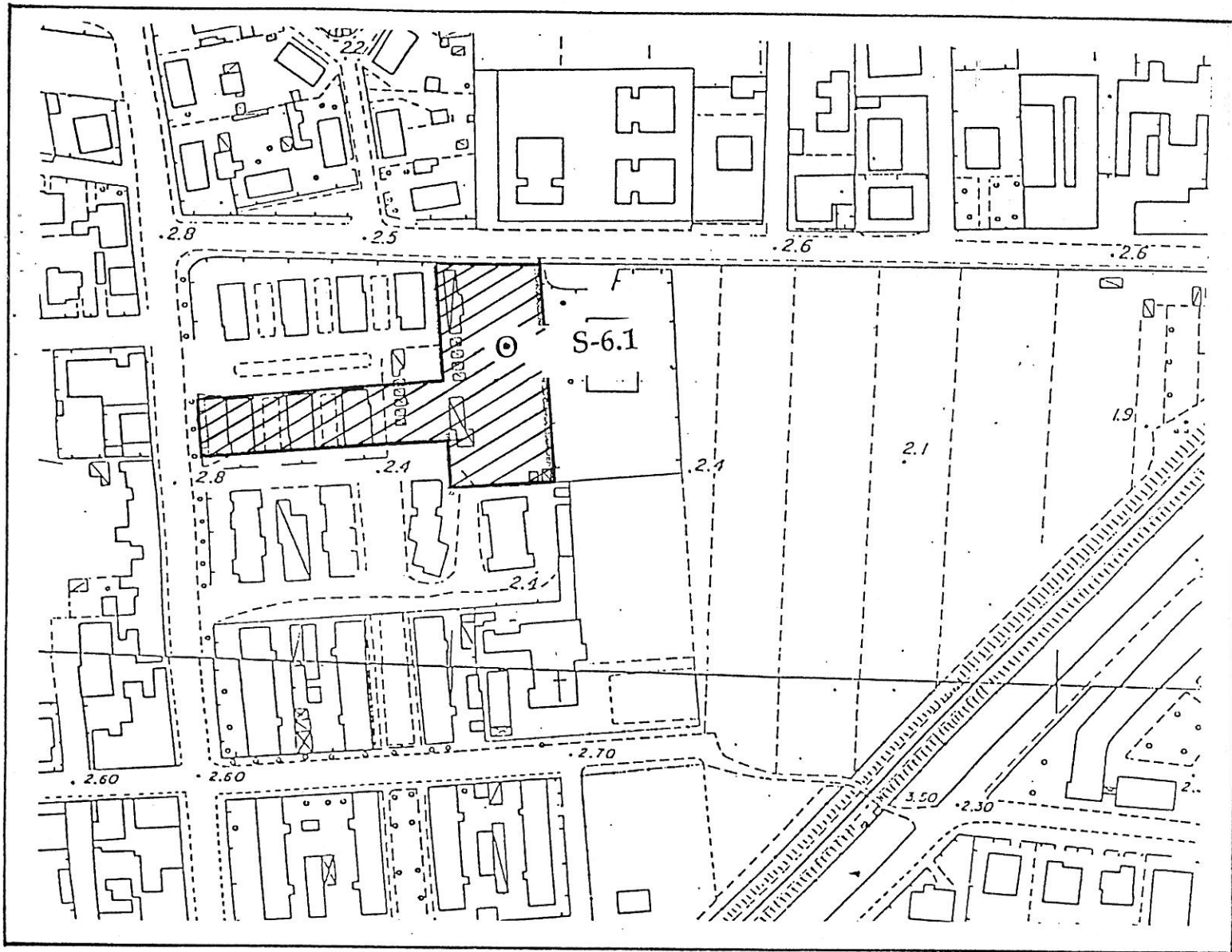
All. 1 Corografia dell'Area d'intervento ed ubicazione del sondaggio (Scala 1:2.000)