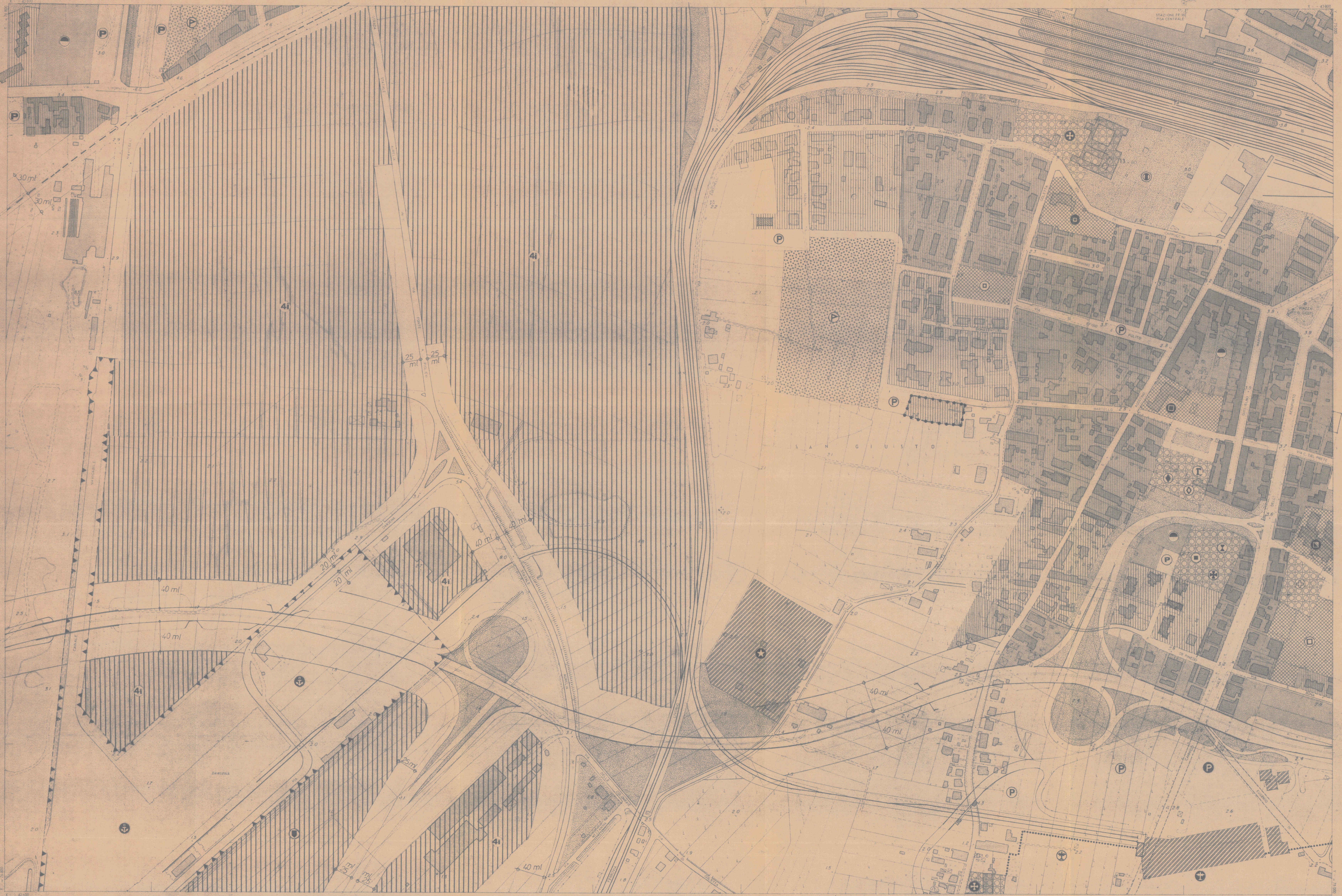
SCALA 1:2000 EQUIDISTANZA m 2