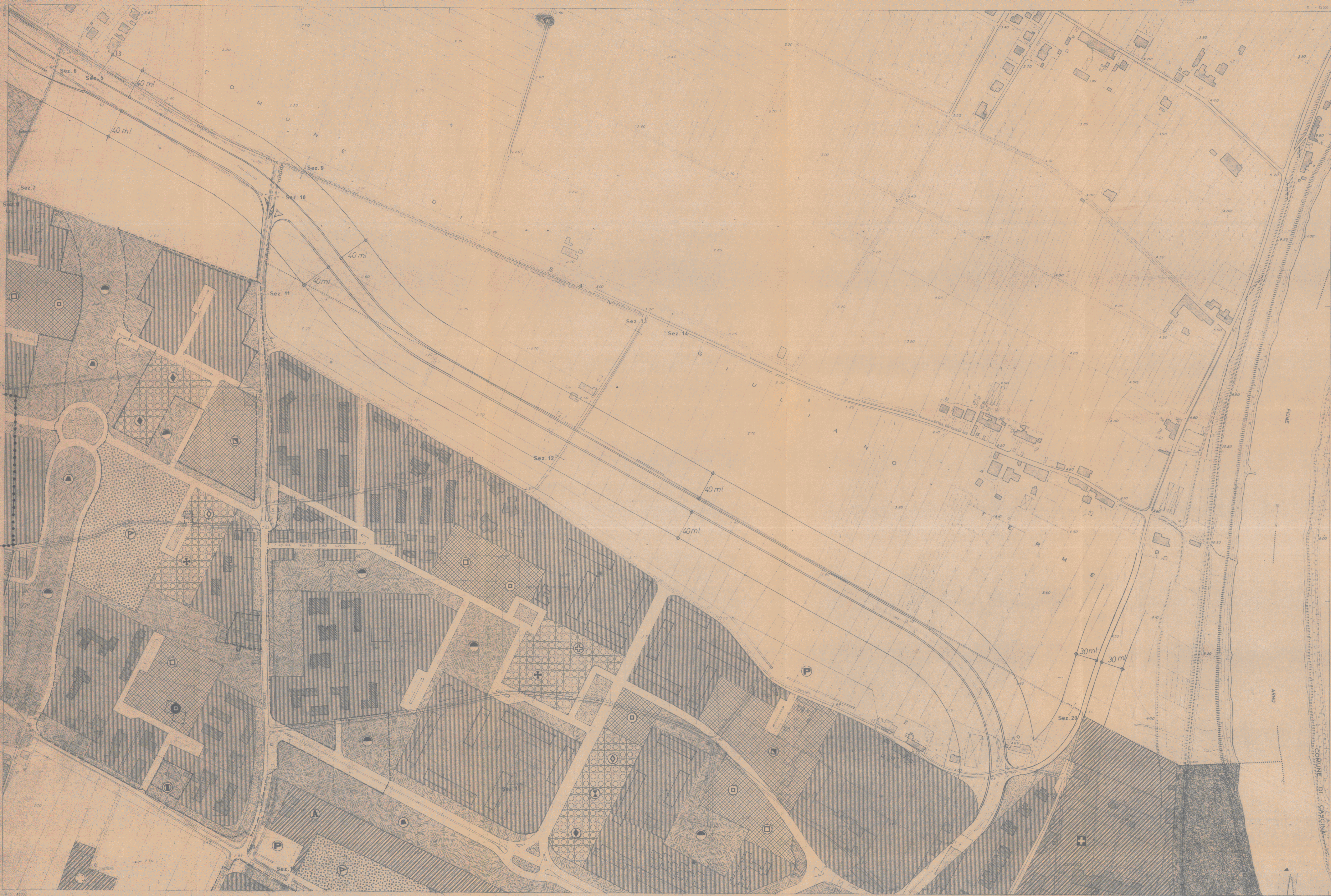
SCALA 1:2000 EQUITANZA m. 2