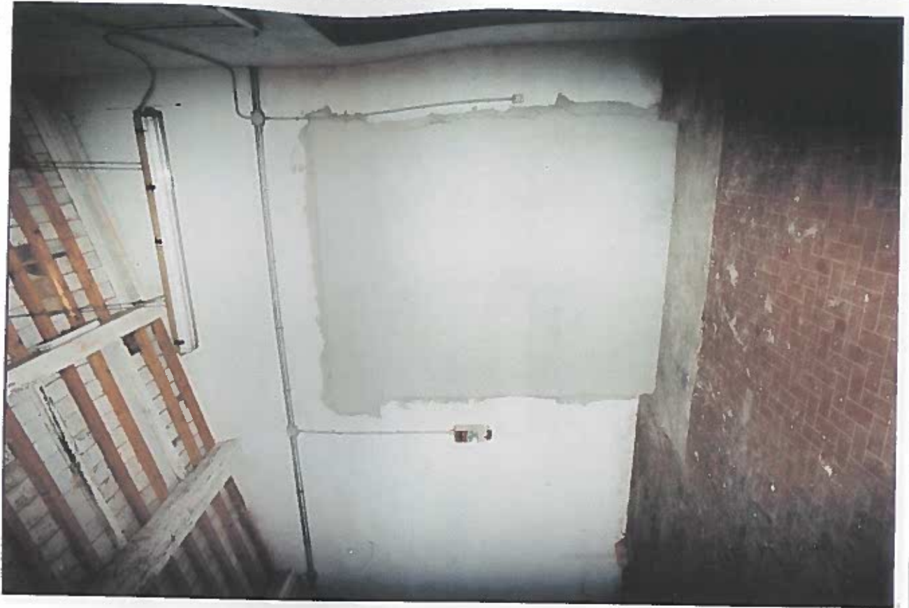
PARTICOLARE PARETE DESTRA DEL SECONDO LOCALE