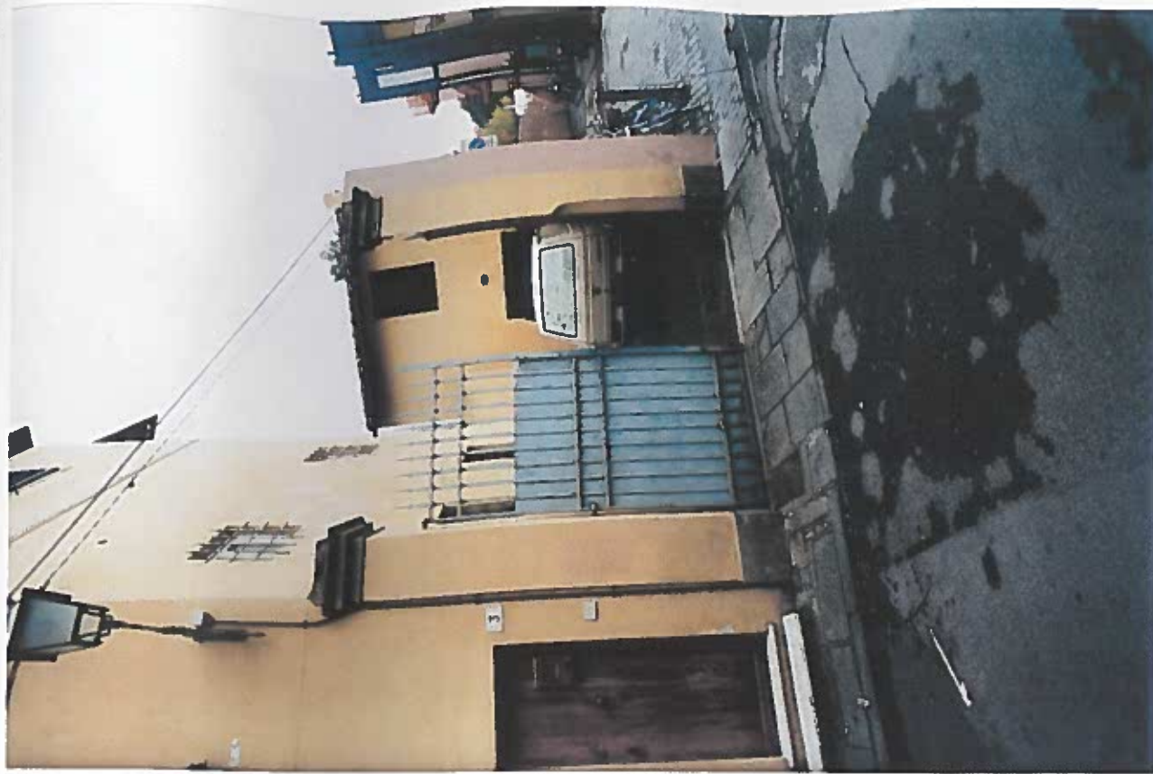
VISTA DEL CANCELLO E DEL CORTILE