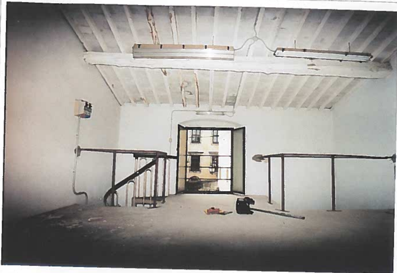
PIANO PRIMO: ARRIVO DELLA SCALA E APERTURA