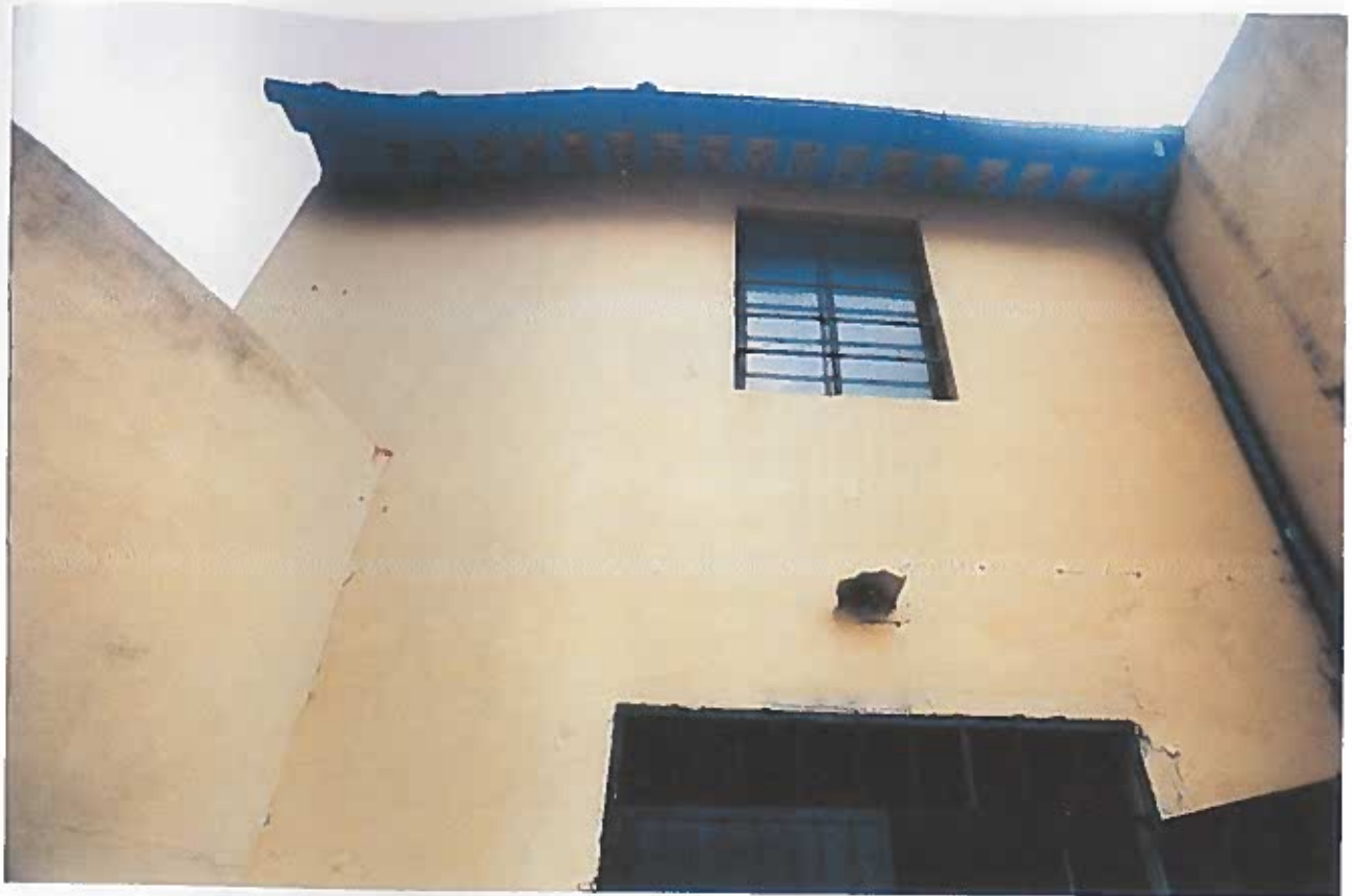
PARTE SUPERIORE DEL PROSPETTO PRINCIPALE