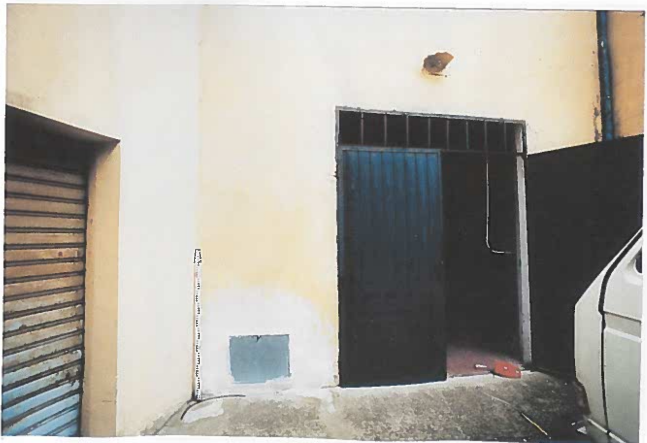
PARTE INFERIORE DEL PROSPETTO PRINCIPALE