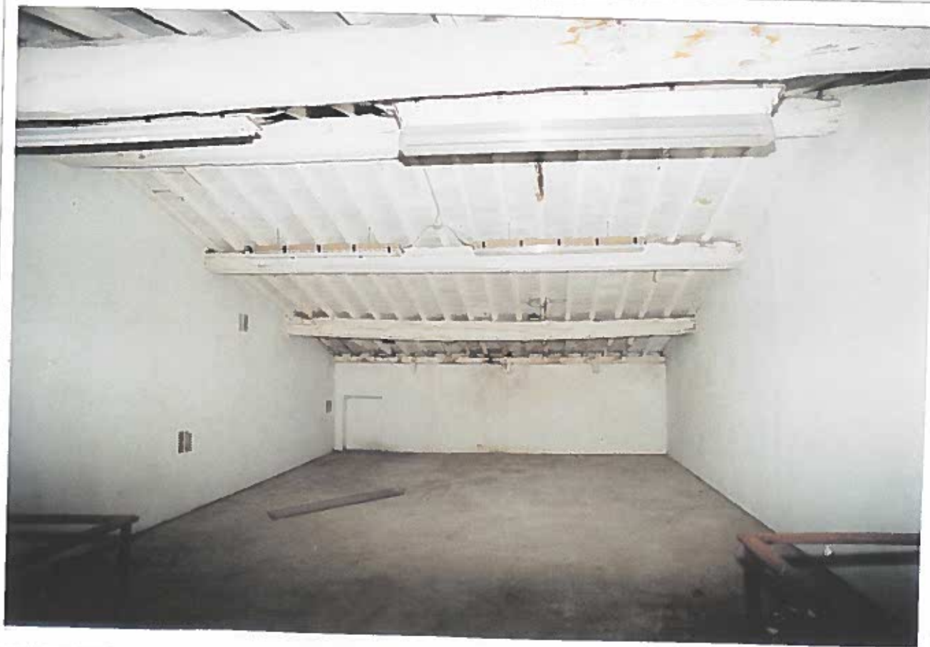
PIANO PRIMO: PARETE DI FONDO E COPERTURA