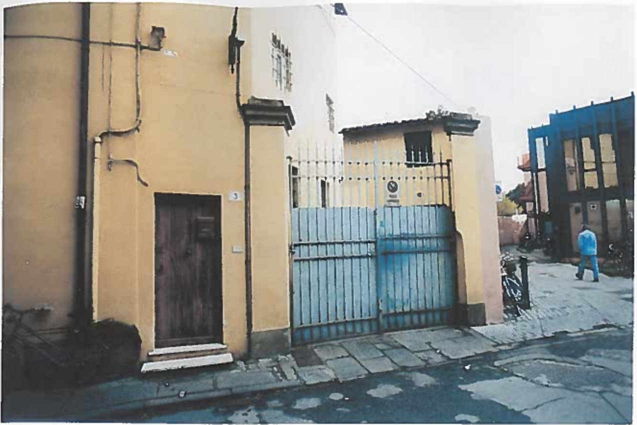
VISTA DEL CANCELLO SU VIA MARTIRI