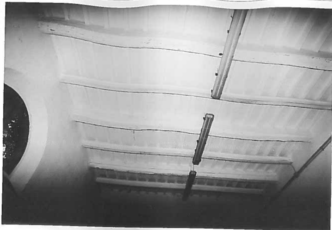
COPERTURA DEL PRIMO LOCALE