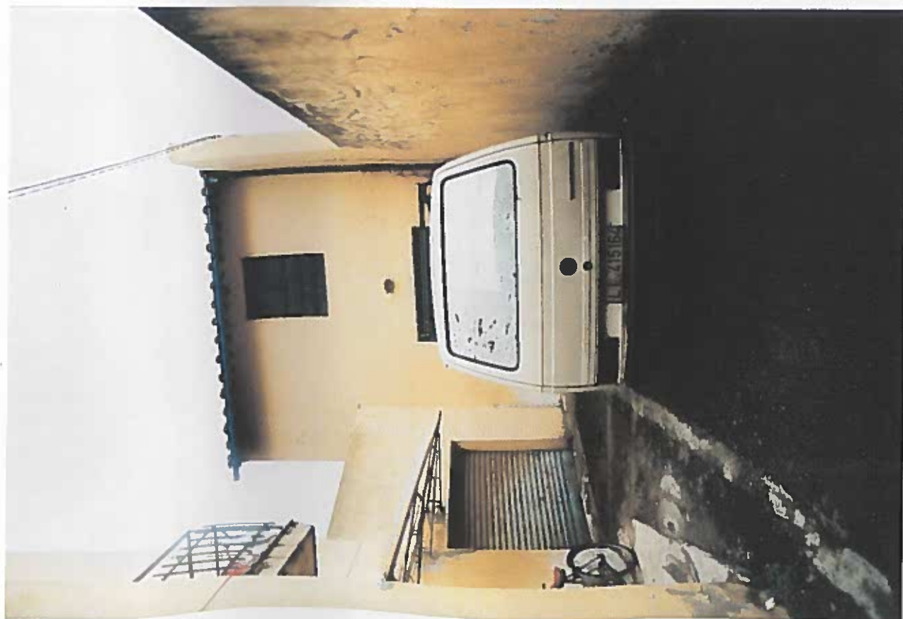
VISTA DEL CORTILE DI ACCESSO ALL'IMMOBILE