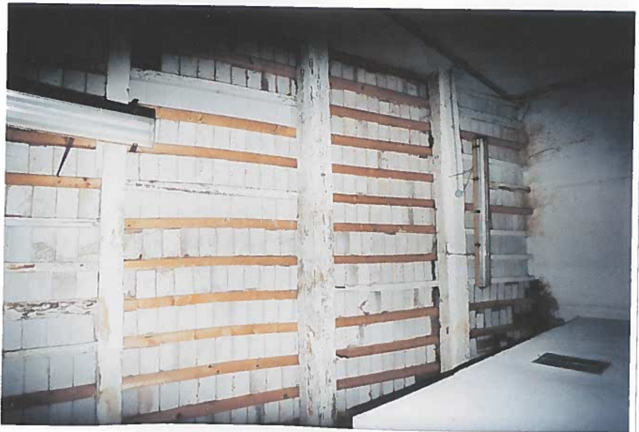
COPERTURA DEL SECONDO LOCALE