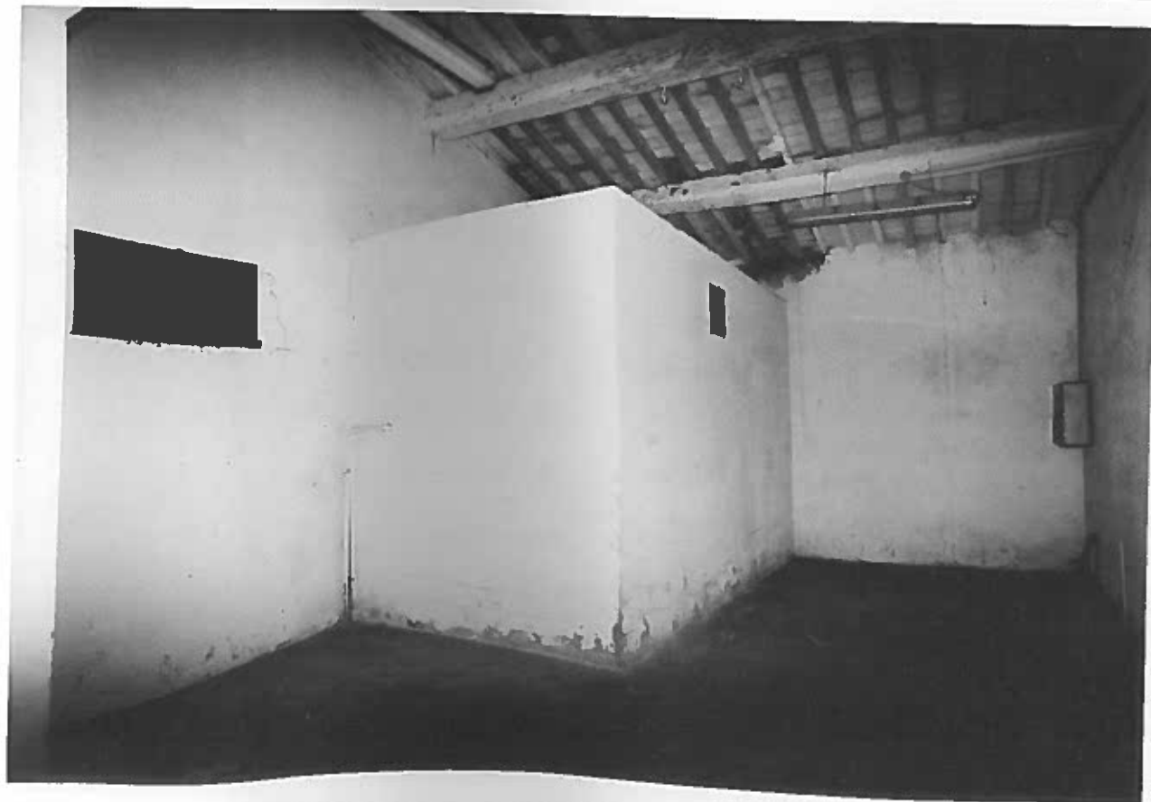
VISTA DEL SECONDO LOCALE