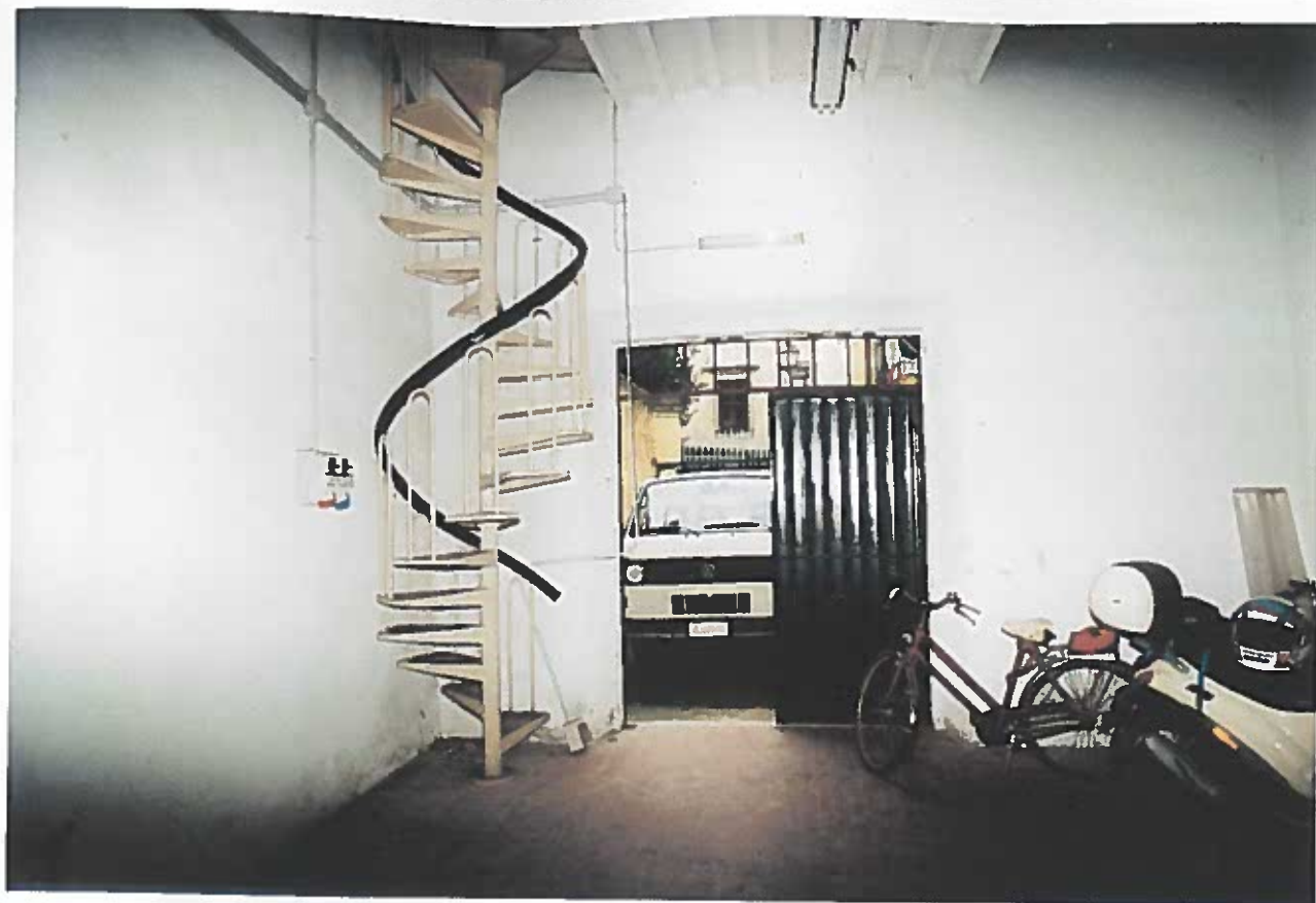
VISTA DEL PRIMO LOCALE VERSO LA PORTA DI INGRESSO