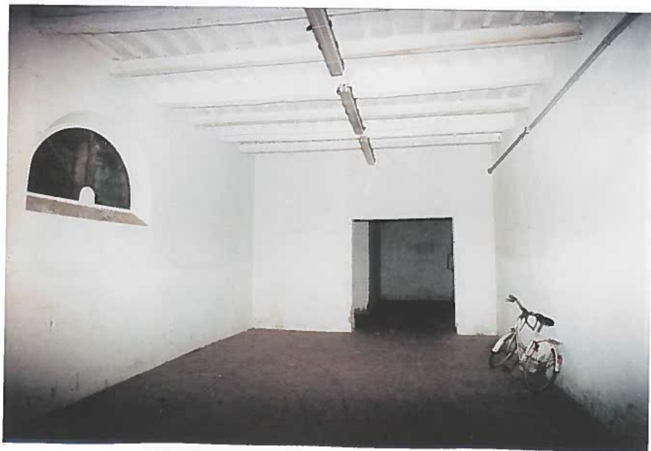
VISTA DEL PRIMO LOCALE DALLA PORTA DI INGRESSO