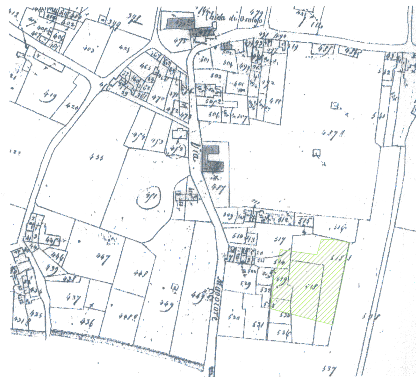
Catasto Leopoldino Ferdinando sez. H Rigione Oratoio foglio 1 della mappa aggiornata al 1876

56121 pisa, via emilia n° 95 tel. 050. 984418 fax 050. 3161422 E.mail momapisa@libero.it