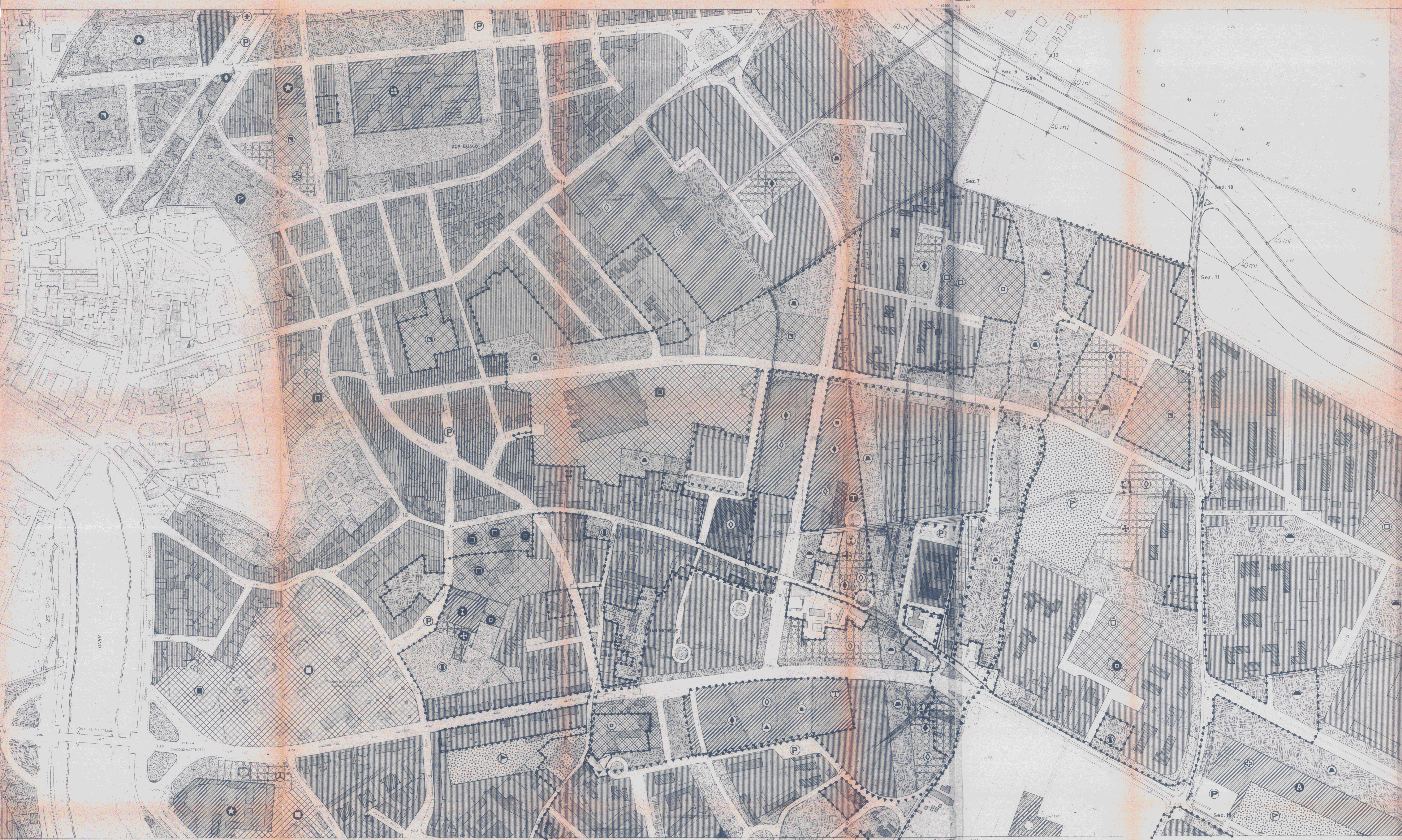
SCALA 1:2000 EQUIDISTANZA m 2