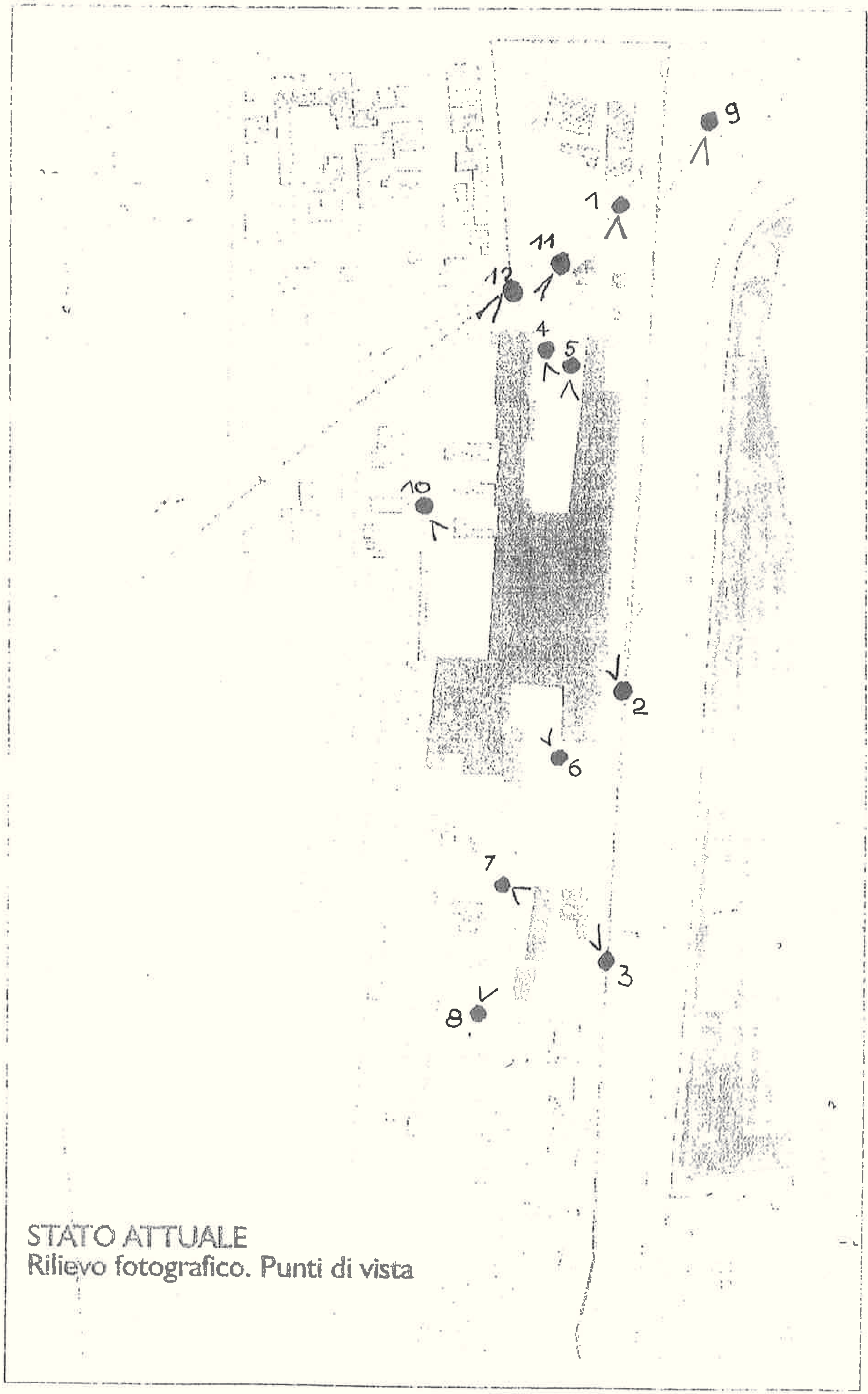
STATO ATTUALE Rilievo fotografico. Punti di vista