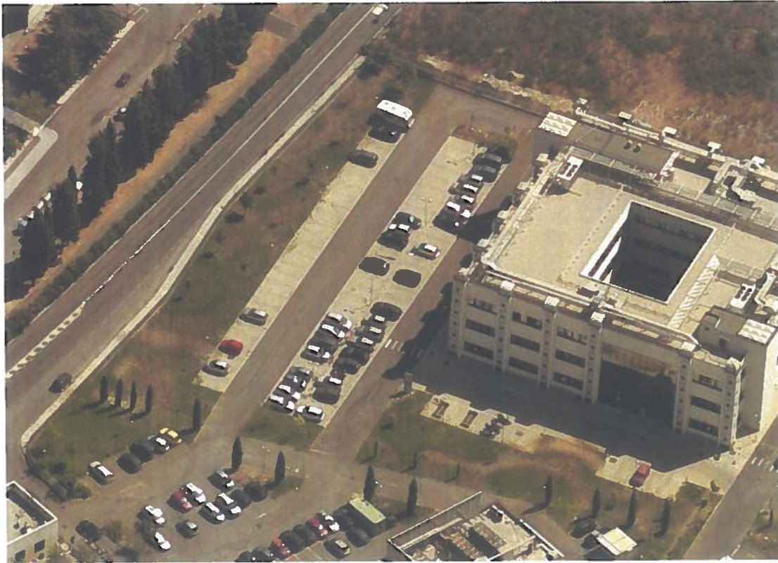
• vista dall'alto