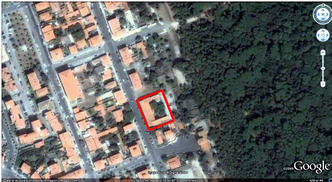
Vista aerea allo stato attuale