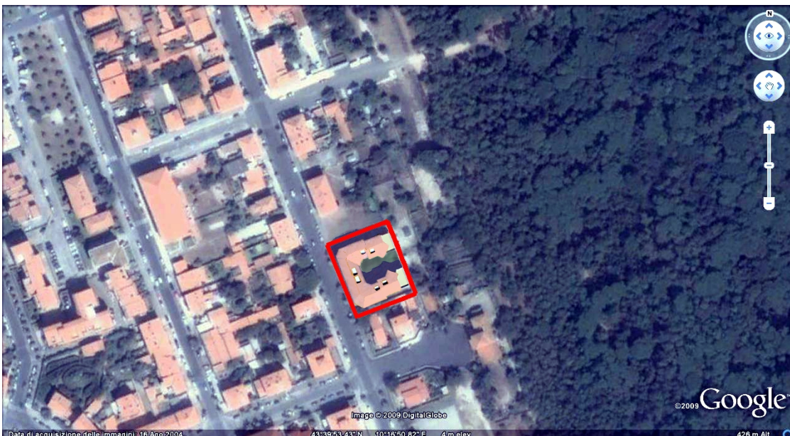
Vista aerea allo stato di progetto