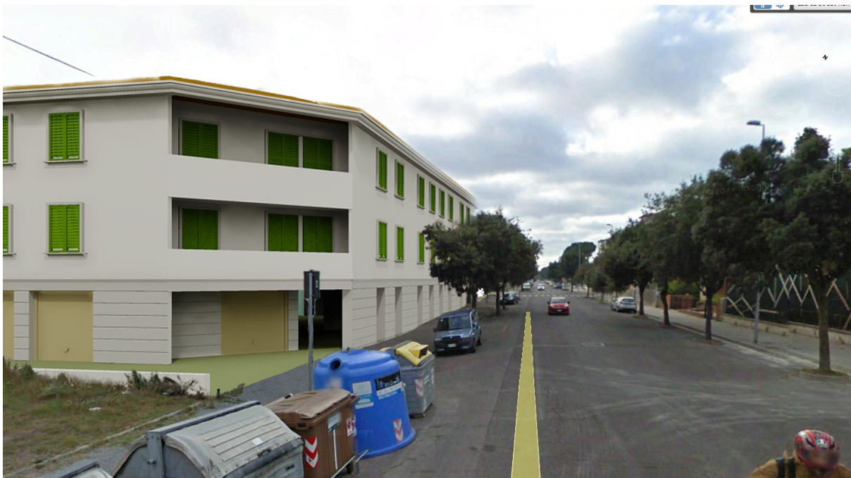
In prossimità dell'edificio