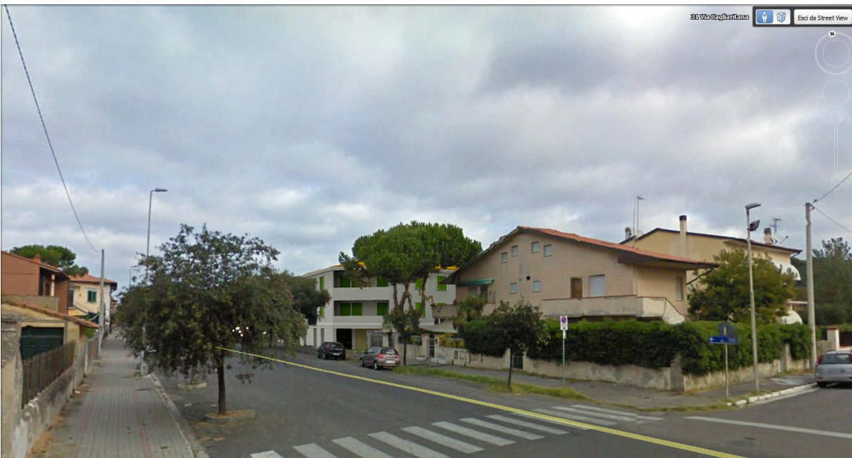
In allontanamento lungo Via Milazzo direzione Sud