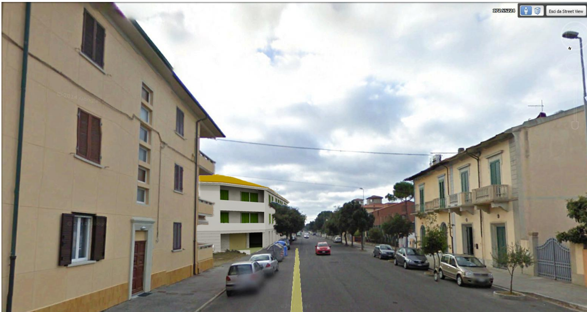
In avvicinamento lungo Via Milazzo direzione Sud