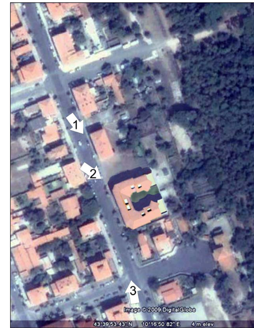
Punti di scatto foto