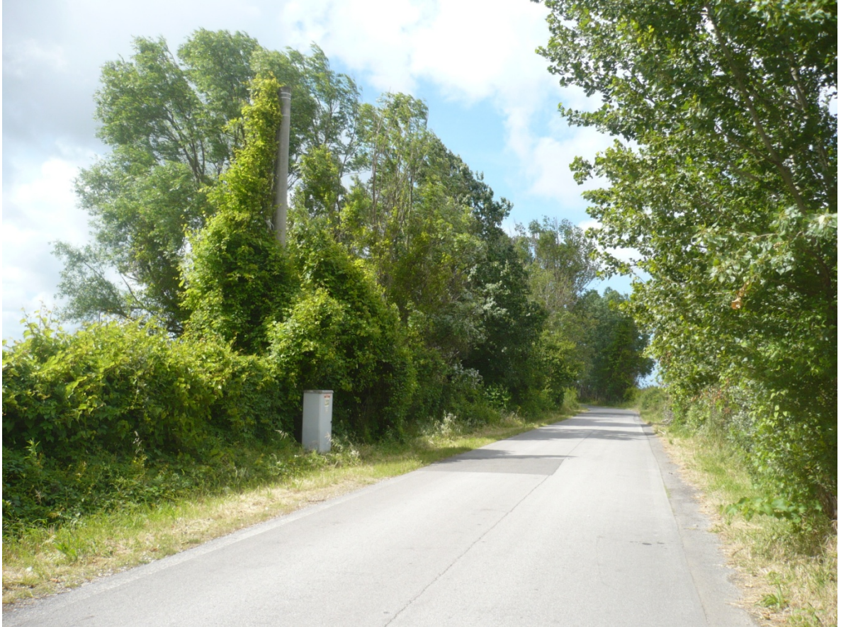
Immagine 5 - Vista da Via Cariola