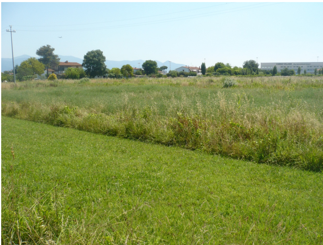
Immagine 38 area compresa tra via di S.Giusto e Via Gargalone vista da via degli Olmetti