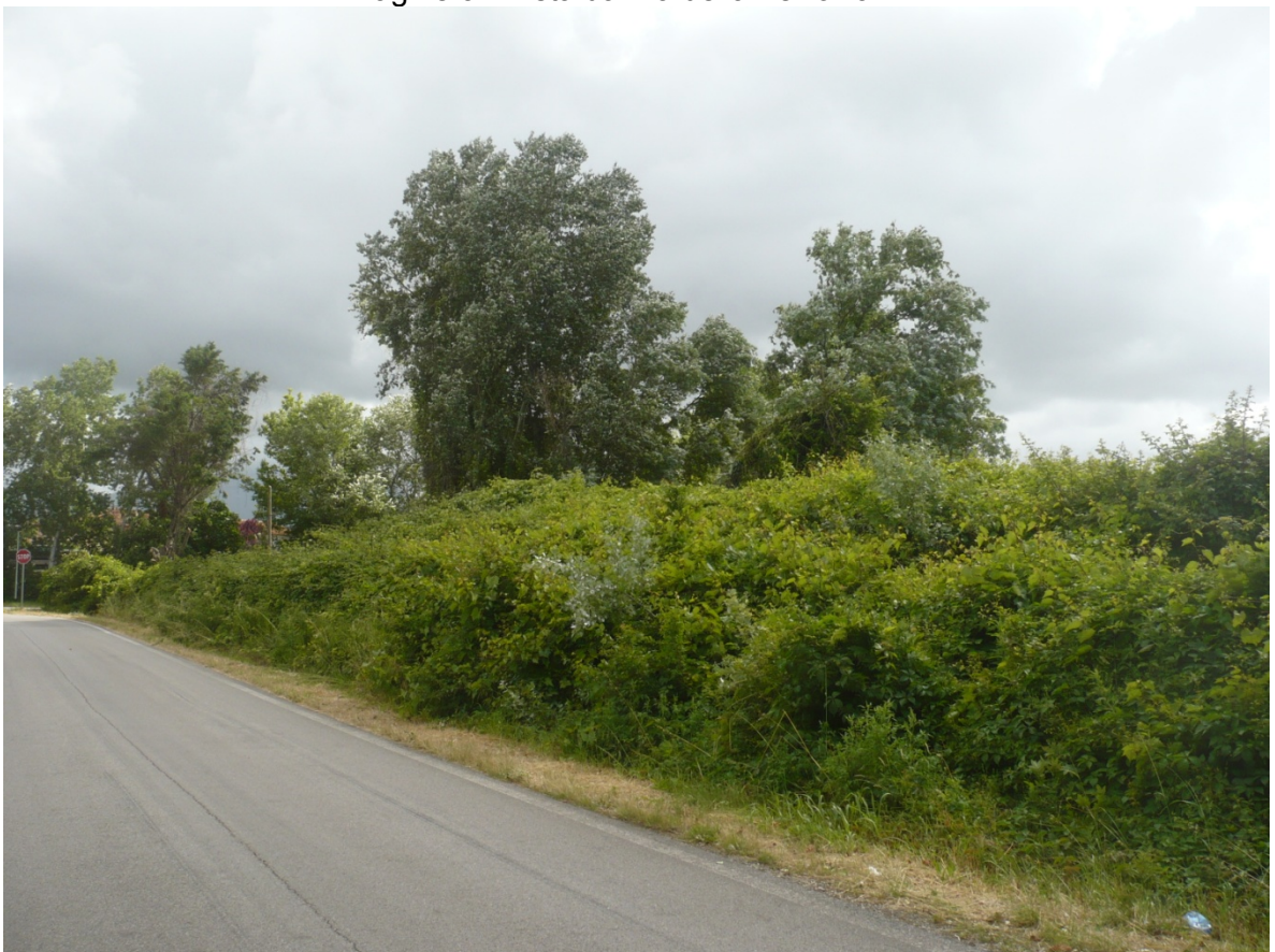
Immagine 4 - Vista da Via Cariola