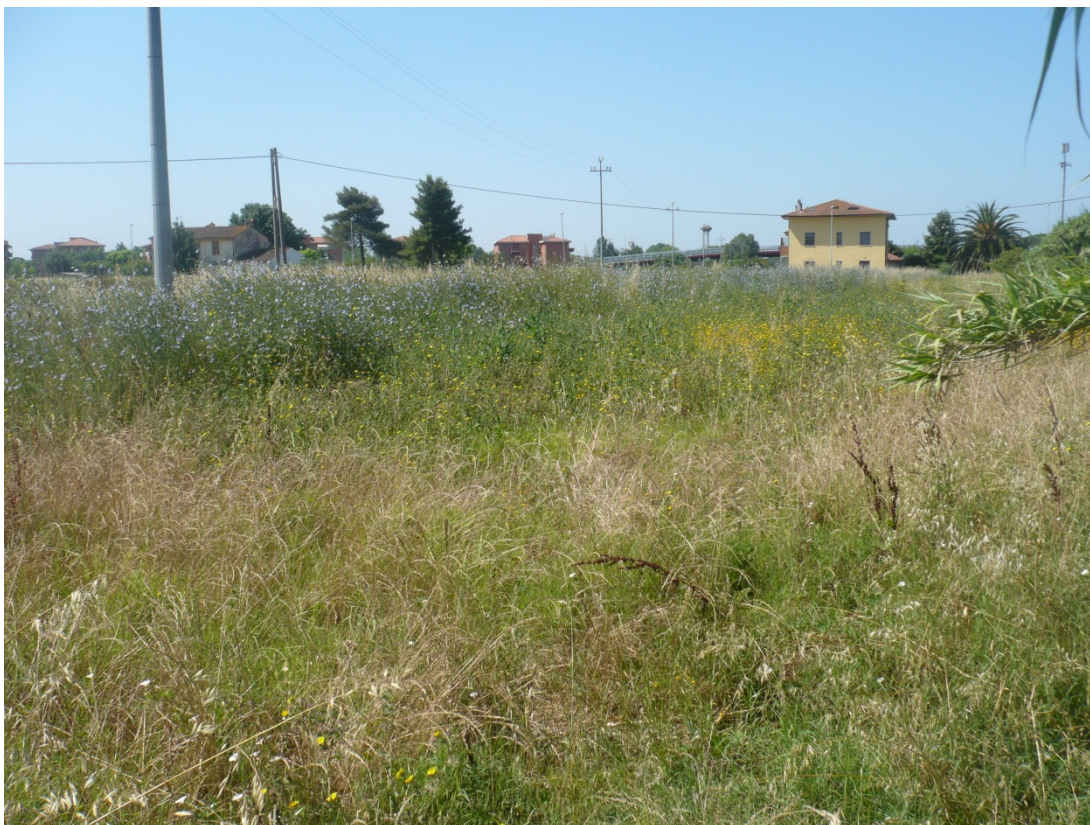
Immagine 17 area compresa tra ferrovia Pisa C.le – aeroporto e via di S.Giusto vista dall’angolo della ferrovia