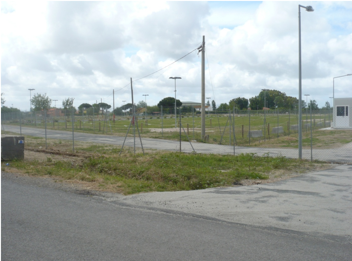
Immagine 1 - Vista da Via della Ferrovia