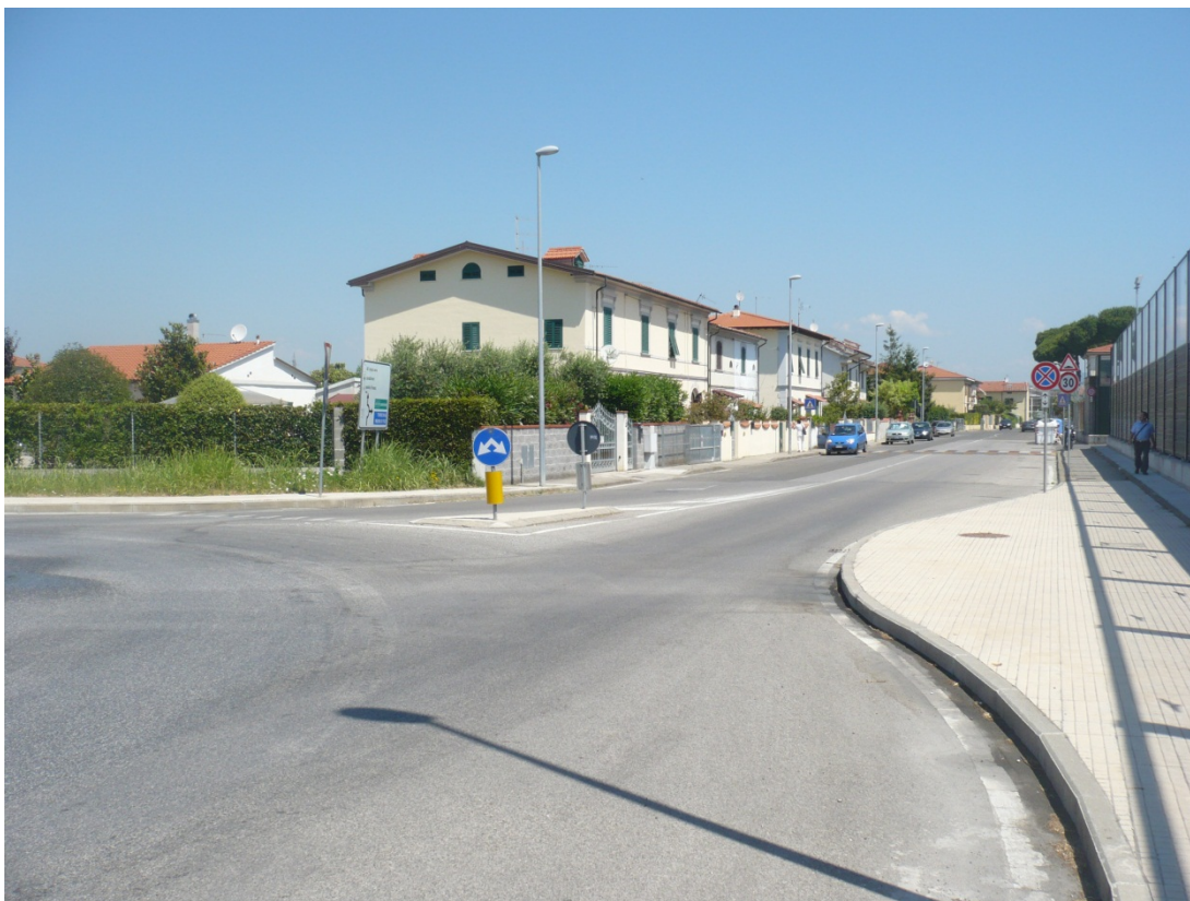
Immagine 40 via Asmara vista dalla rotatoria con via Gargalone