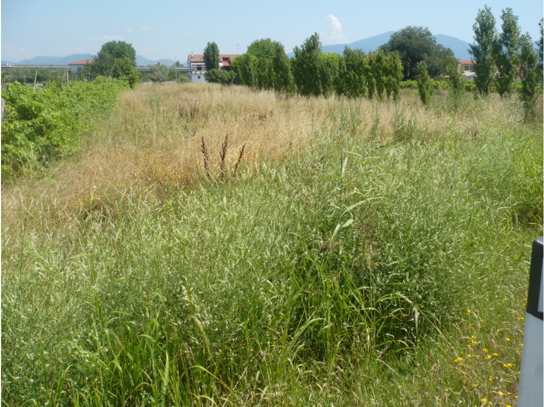
Immagine 47 area compresa tra via S. Giusto e Via Gargalone vista da Via Gargalone