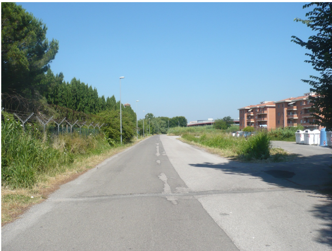
Immagine 5 Via degli Olmetti vista in direzione ferrovia Pisa Livorno