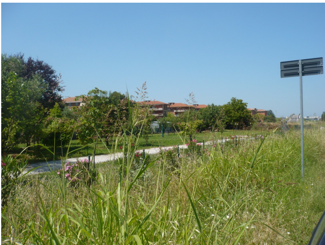
Immagine 42 area compresa tra via Gargalone e via degli Olmetti vista dall'angolo tra via Gargalone e via Caduti di Kindu