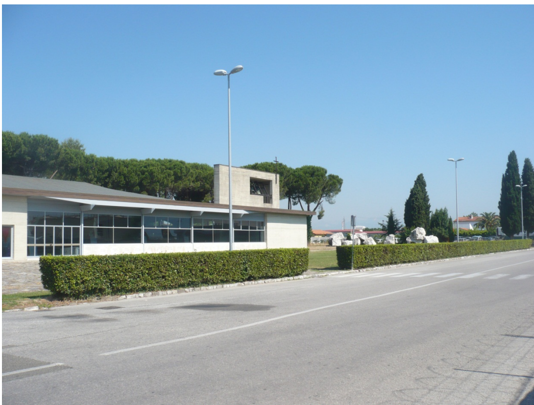
Immagine 2 Sacrario caduti di Kindu