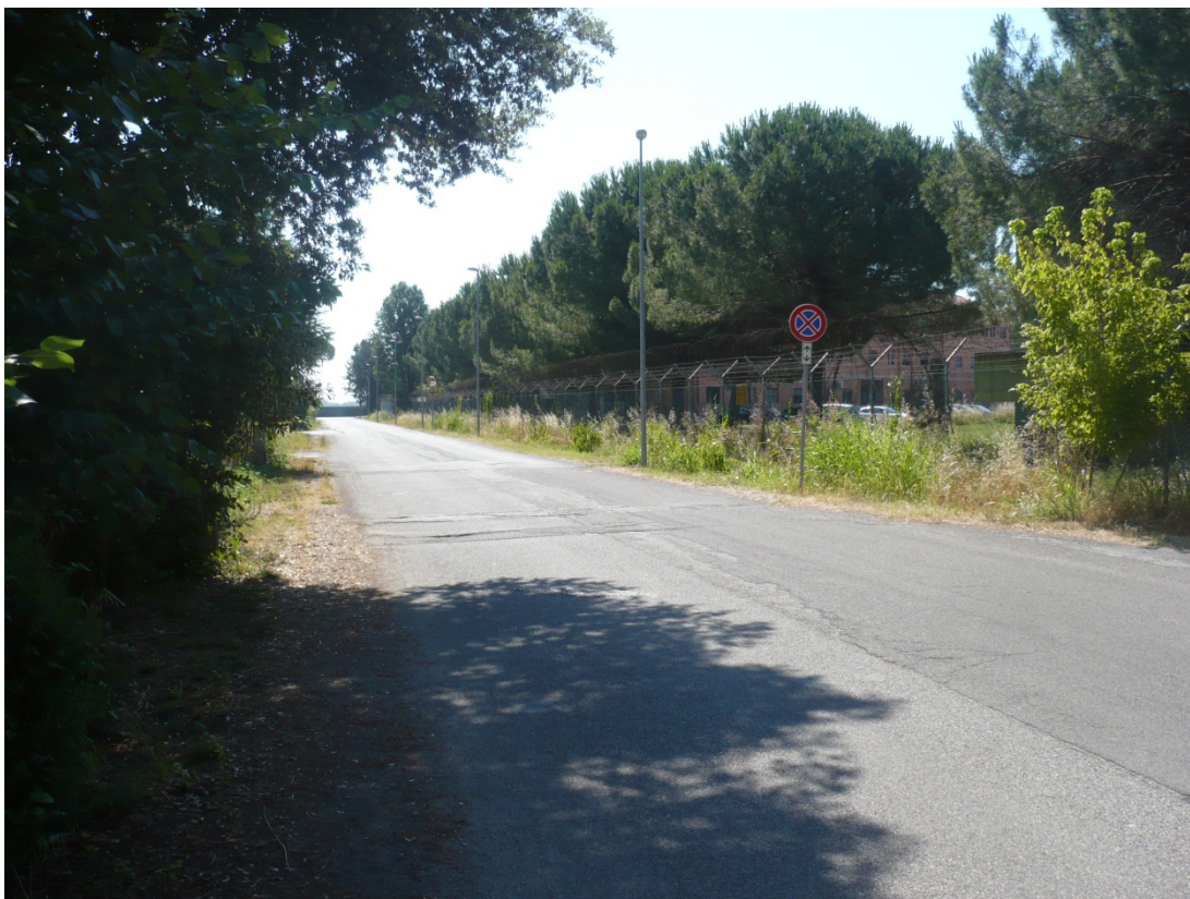
Immagine 3 Via degli Olmetti vista in direzione aeroporto