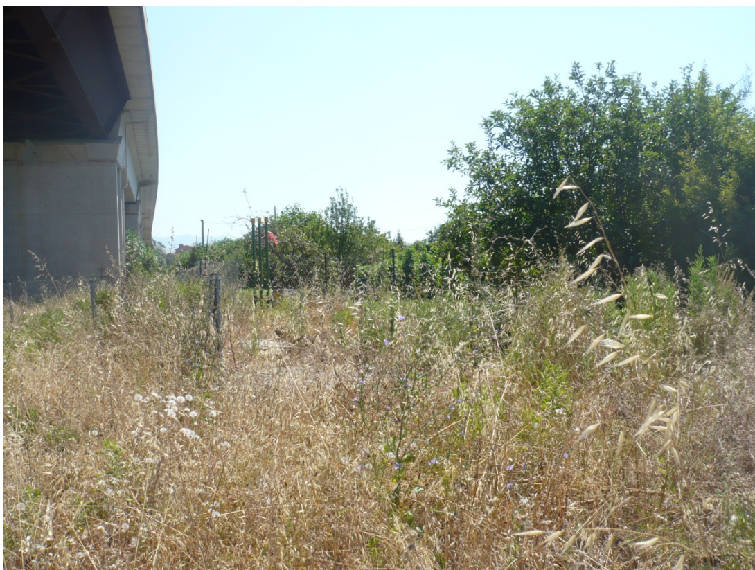
Immagine 14 area compresa tra la SGC FiPiLi e la ferrovia Pisa c.le – aeroporto vista dall’angolo della ferrovia con via di Goletta