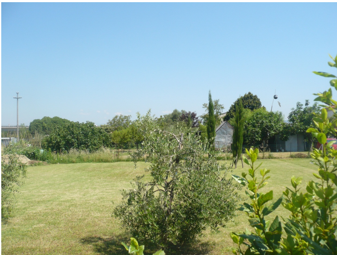
Immagine 25 area compresa tra ferrovia Pisa C.le – aeroporto e via di S.Giusto vista via di S.Giusto