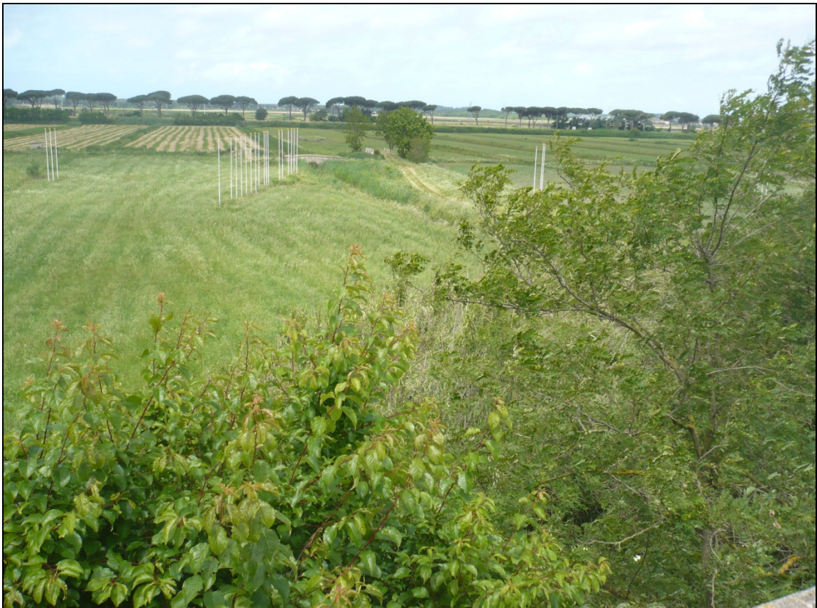
Foto 4 dal ponte sulla ferrovia di Via Enrico Pezzi in direzione Ovest Nord Ovest