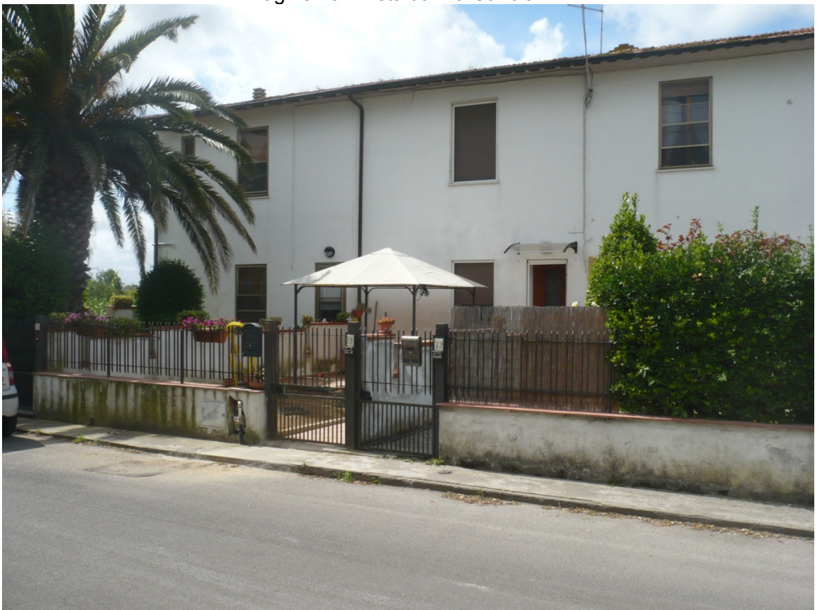
Immagine 16 - Vista da Via Cariola