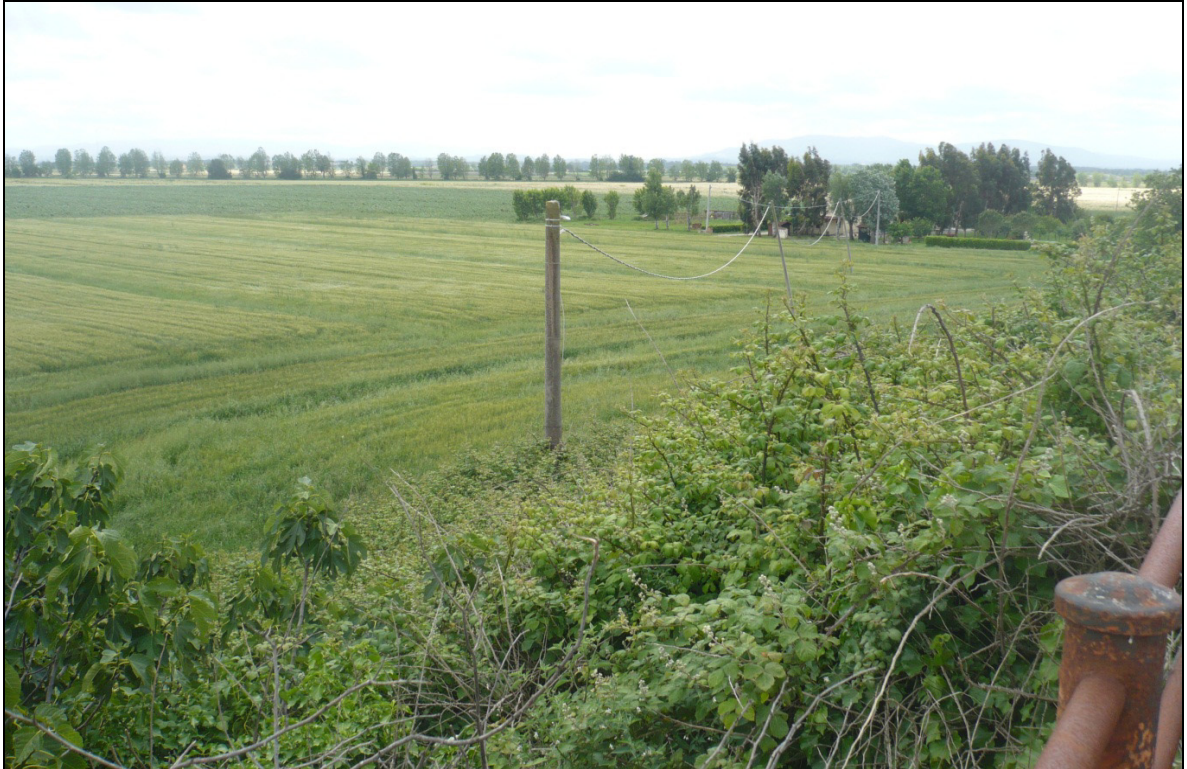
Foto 1 – dal ponte sulla ferrovia di Via Enrico Pezzi in direzione Sud Est