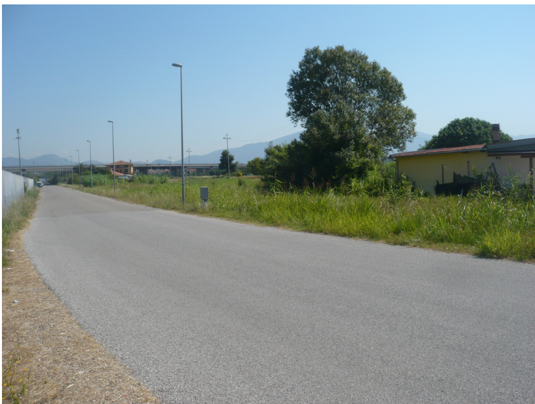
Immagine 6 Via degli Olmetti vista da sotto il cavalcavia Gargalone in direzione SGC FiPiLi