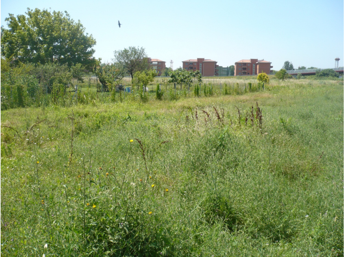
Immagine 33 area compresa tra via di S.Giusto e Via Gargalone vista da via di San Giusto