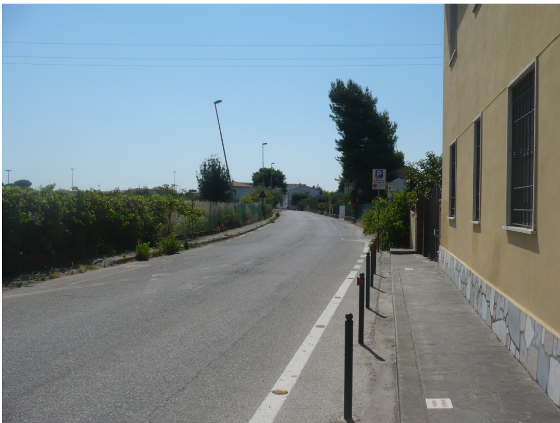
Immagine 12 via di S.Giusto vista da via degli Olmetti