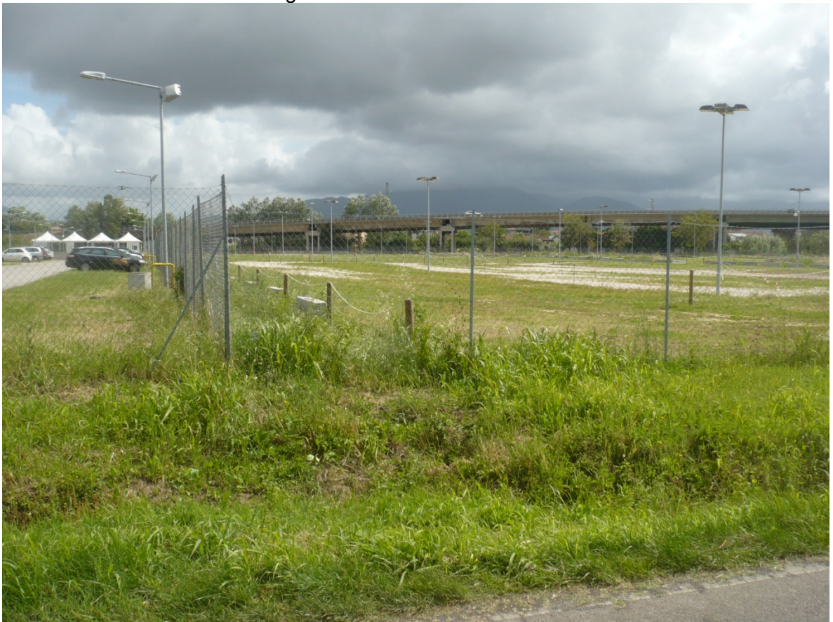
Immagine 10 - Vista da Via Cariola