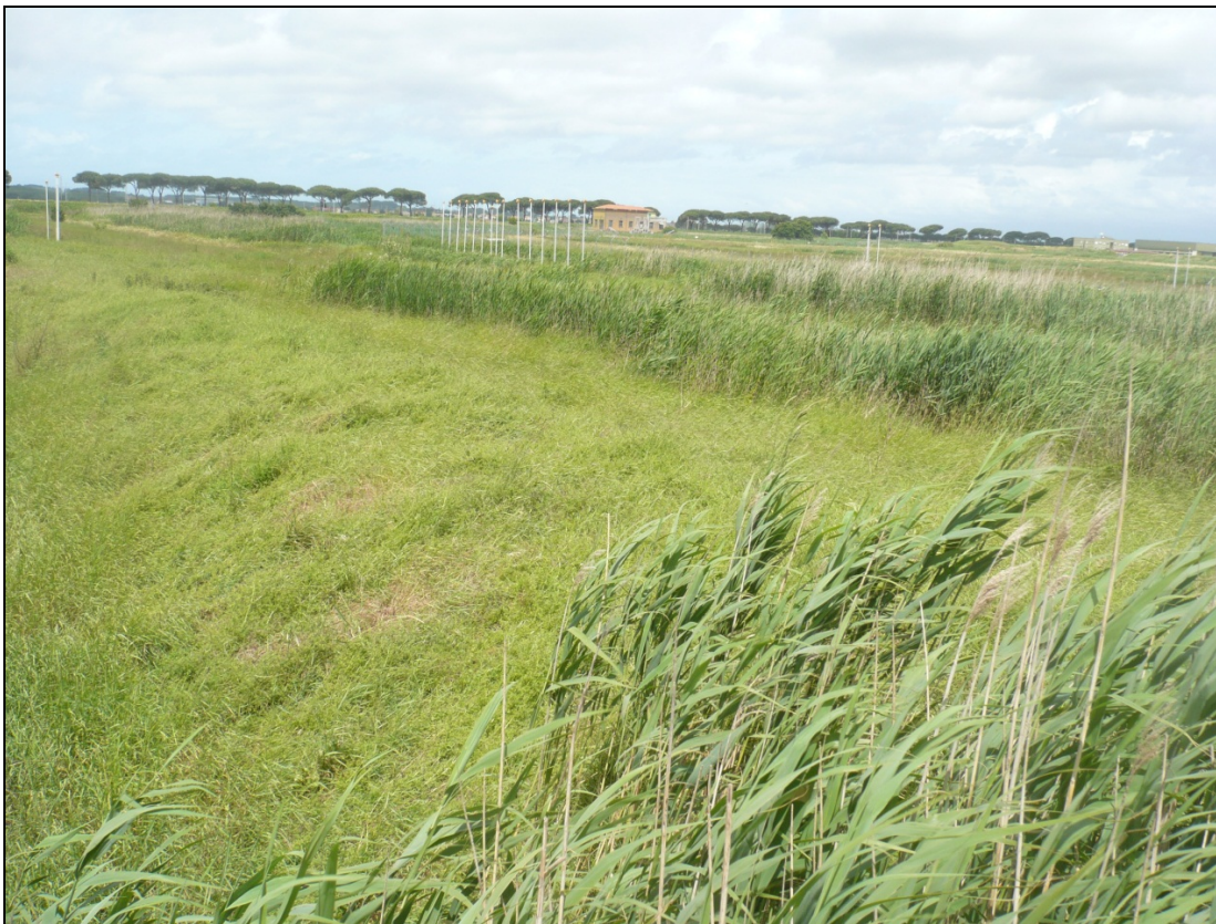
Foto 10 da Via Enrico Pezzi tra la ferrovia e l'aeroporto in direzione Nord Nord Ovest