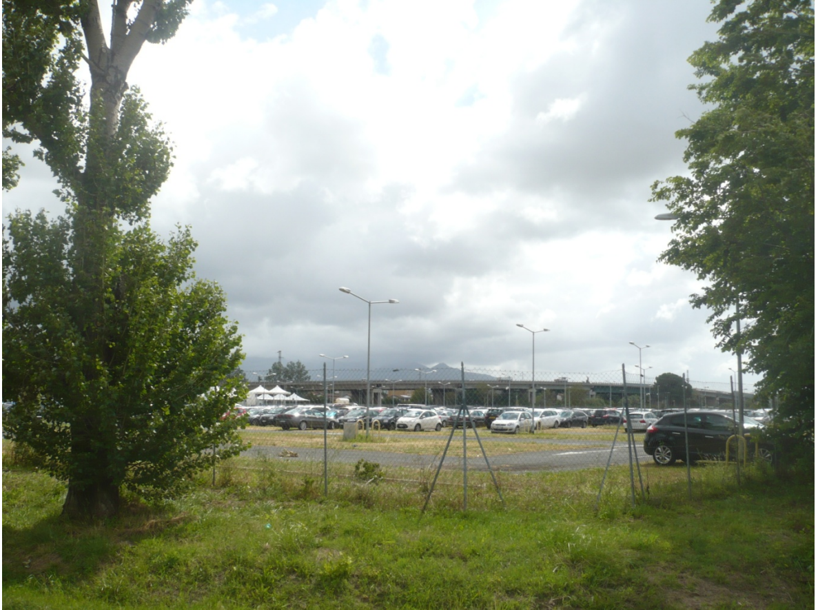
Immagine 7 - Vista da Via Cariola