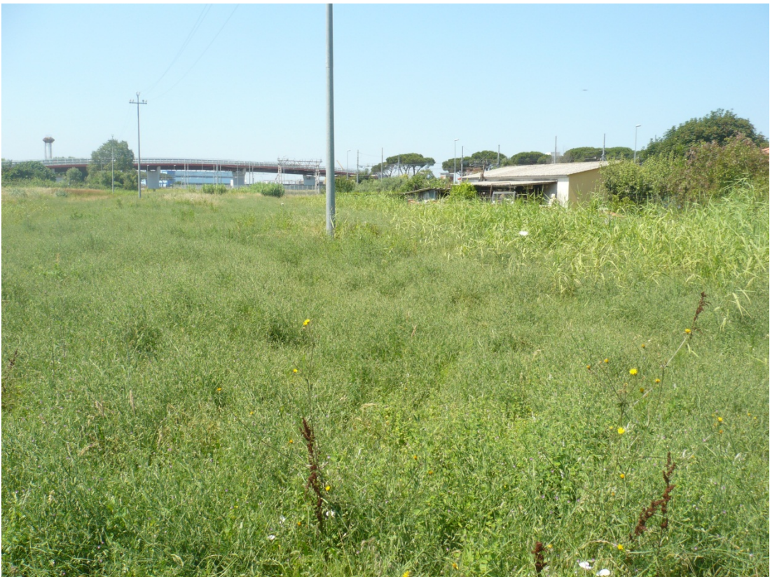
Immagine 34 area compresa tra via di S.Giusto e Via Gargalone vista da via di San Giusto