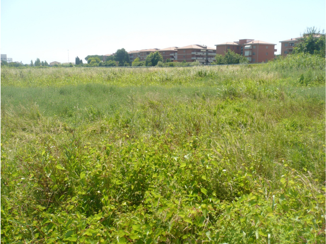
Immagine 35 area compresa tra via di S.Giusto e Via Gargalone vista da via degli Olmetti