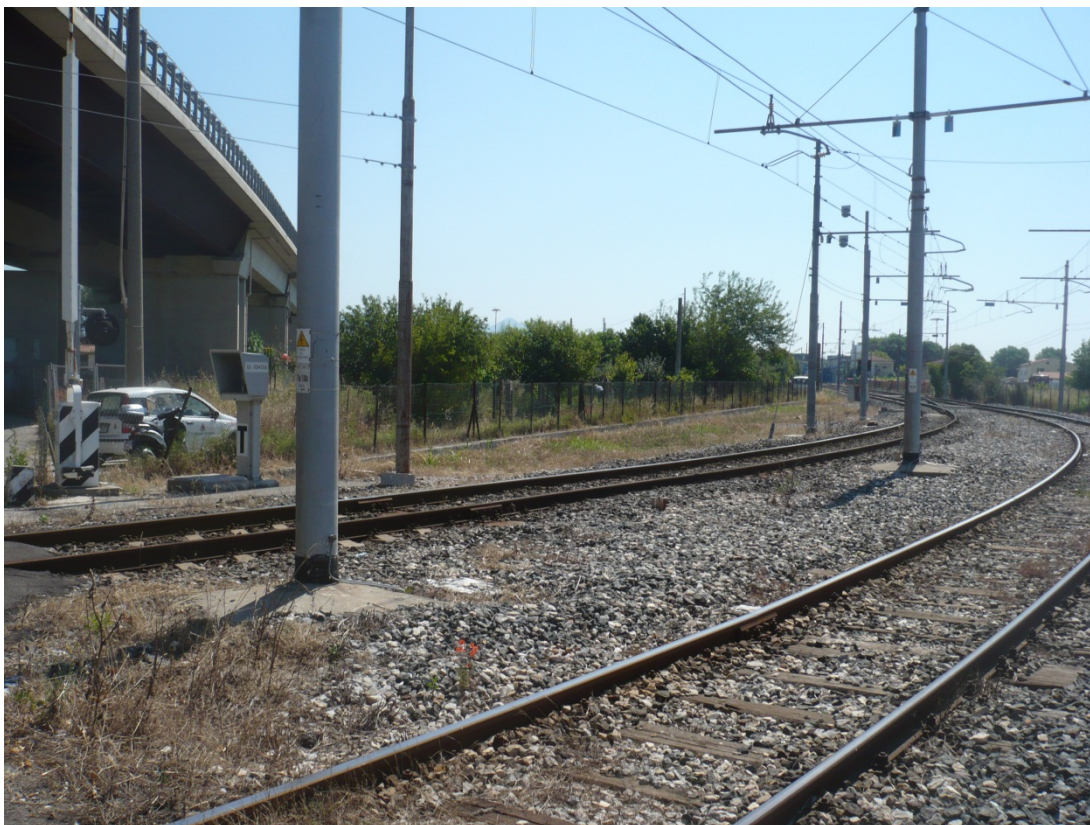
Immagine 15 ferrovia direzione aeroporto vista dal passaggio a livello di via di Goletta