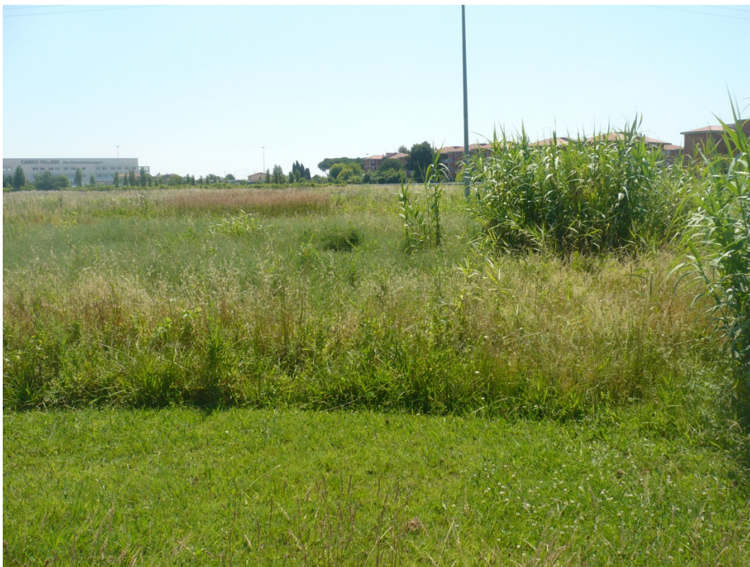
Immagine 37 area compresa tra via di S.Giusto e Via Gargalone vista da via degli Olmetti