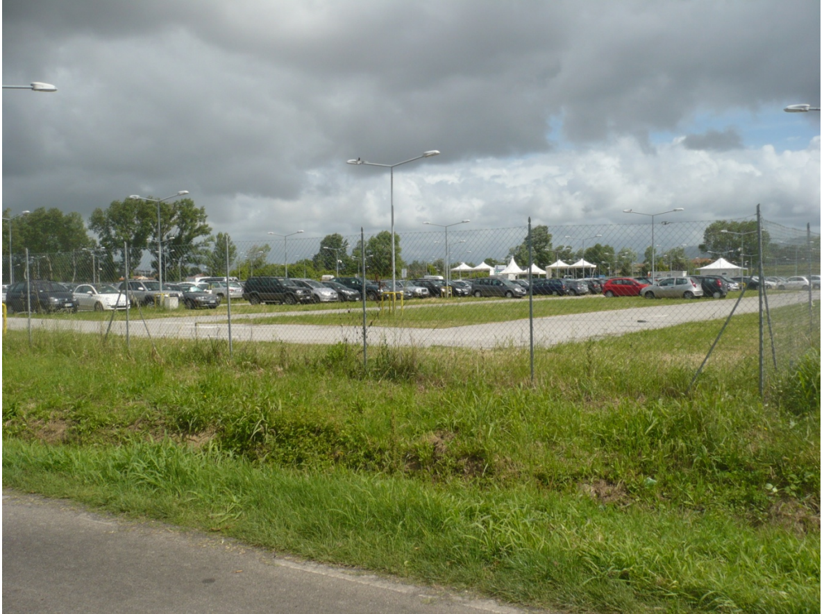
Immagine 9 - Vista da Via Cariola