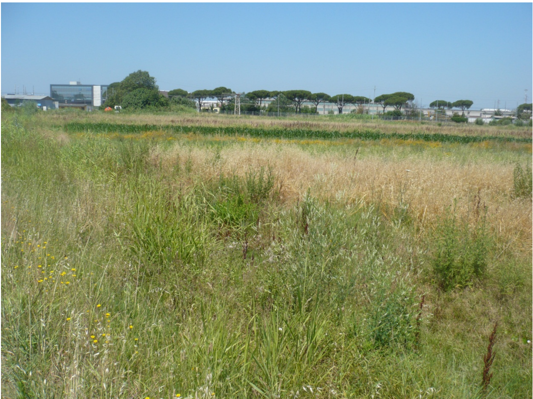
Immagine 44 area compresa tra via S. Giusto e Via Gargalone vista da Via Gargalone