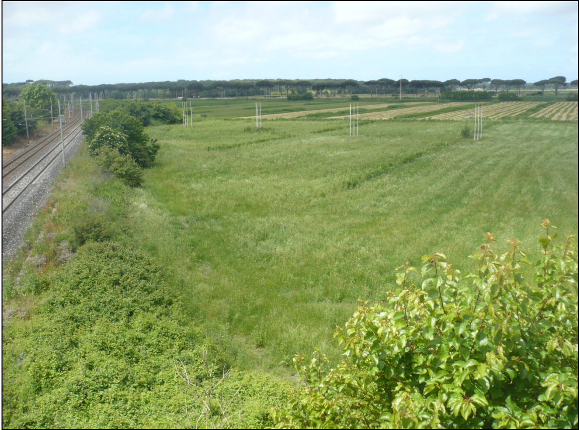
Foto 3 dal ponte sulla ferrovia di Via Enrico Pezzi in direzione Ovest Sud Ovest