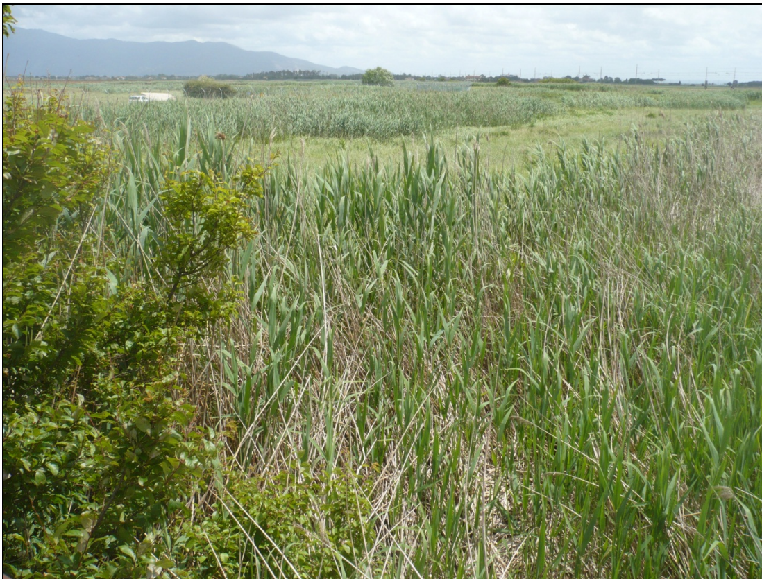
Foto 12 da Via Enrico Pezzi tra la ferrovia e l'aeroporto in direzione Est