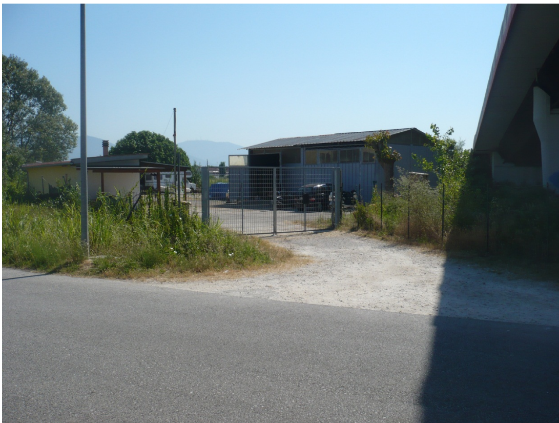
Immagine 7 Via degli Olmetti vista da sotto il cavalcavia Gargalone in direzione ovest