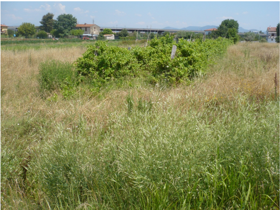
Immagine 46 area compresa tra via S. Giusto e Via Gargalone vista da Via Gargalone