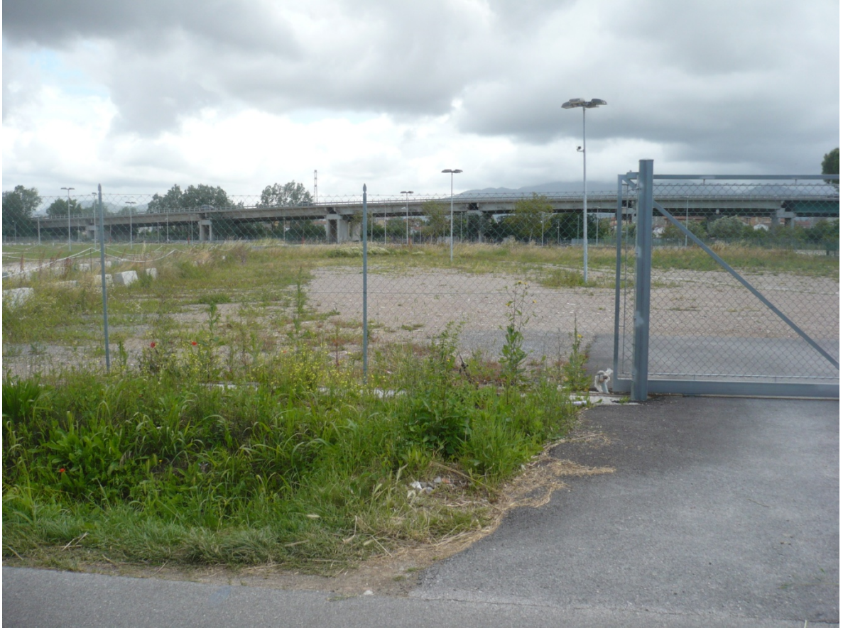
Immagine 13 - Vista da Via Cariola