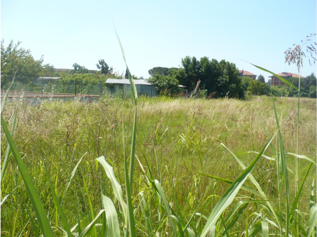
Immagine 27 area compresa tra via di S.Giusto e Via Gargalone vista da via di San Giusto