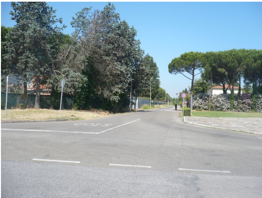
Immagine 1 – via degli Olmetti vista da via Caduti di Kindu