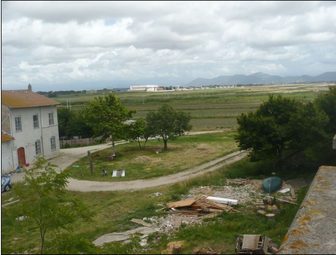
Foto 7 dalla rampa lato aeroporto del ponte sulla ferrovia d Via Enrico Pezzi in direzione Nord Nord Ovest