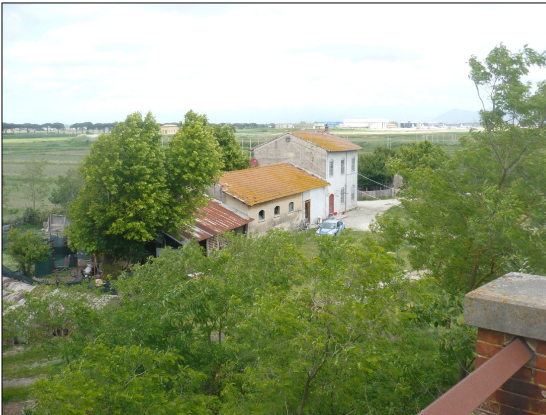
Foto 6 dal ponte sulla ferrovia di Via Enrico Pezzi in direzione Nord