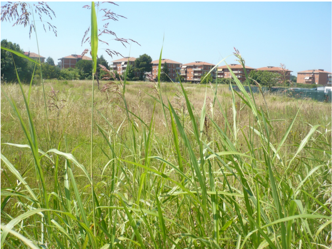
Immagine 28 area compresa tra via di S.Giusto e Via Gargalone vista da via di San Giusto