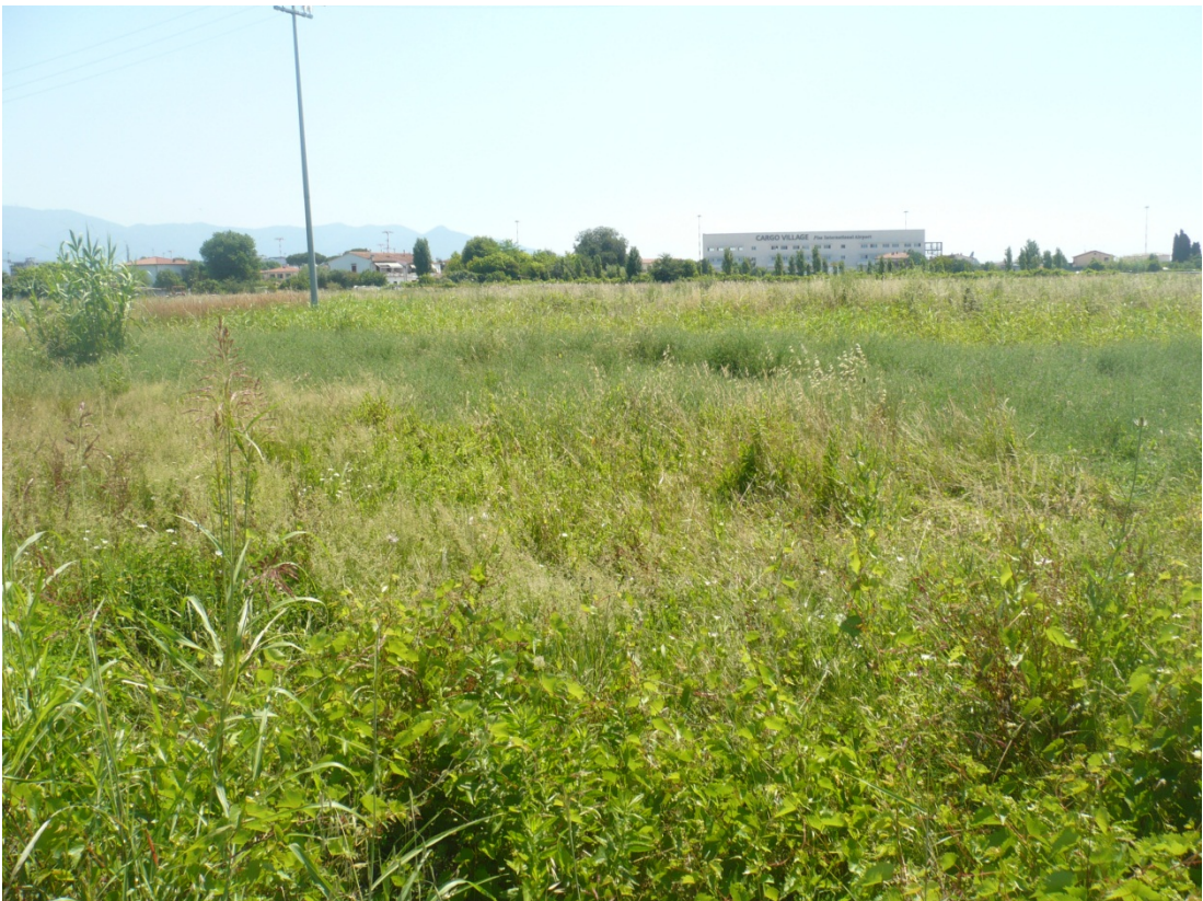
Immagine 36 area compresa tra via di S.Giusto e Via Gargalone vista da via degli Olmetti