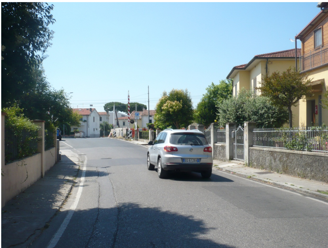
Immagine 19 via S:Agostino vista in direzione della ferrovia Pisa c.le - aeroporto