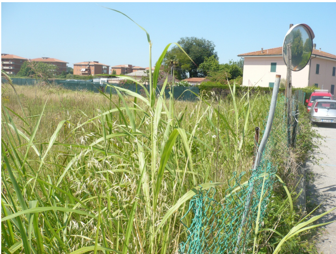
Immagine 29 area compresa tra via di S.Giusto e Via Gargalone vista da via di San Giusto