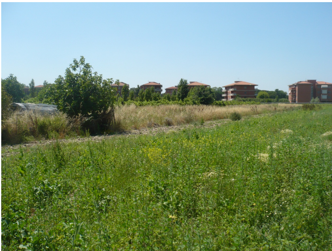
Immagine 30 area compresa tra via di S.Giusto e Via Gargalone vista da via di San Giusto