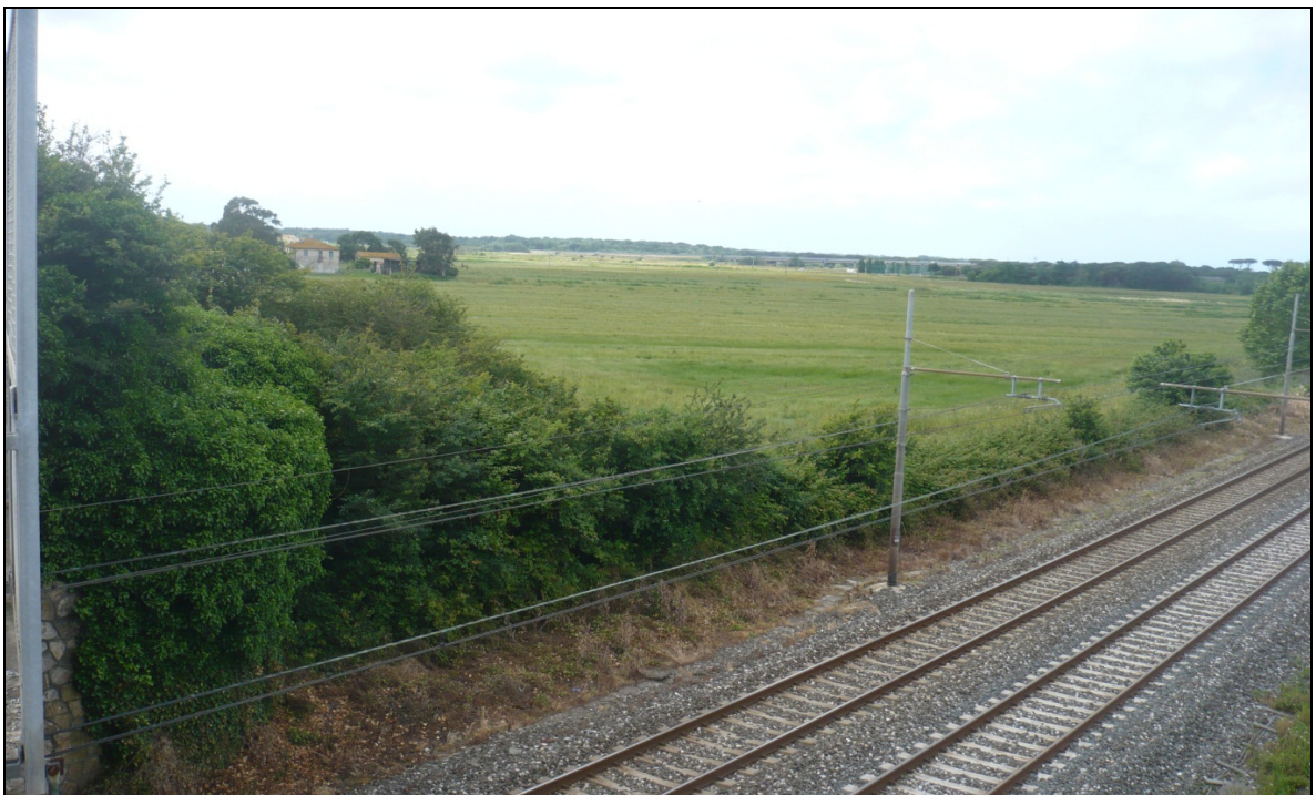
Foto 2 – dal ponte sulla ferrovia di Via Enrico Pezzi in direzione Sud Ovest