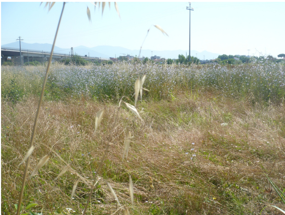
Immagine 10 area compresa tra ferrovia Pisa C.le – aeroporto e via di S.Giusto vista da via degli Olmetti angolo con via di S.Giusto