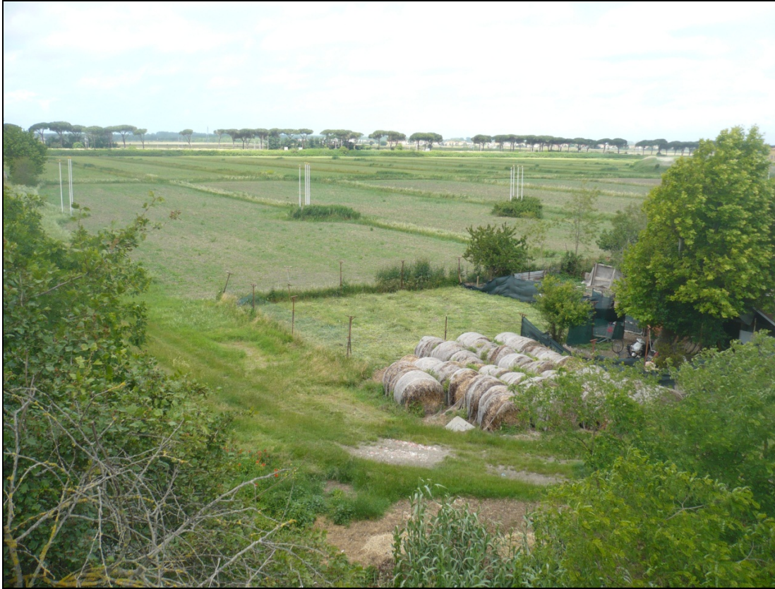
Foto 5 dal ponte sulla ferrovia di Via Enrico Pezzi in direzione Ovest Nord Ovest