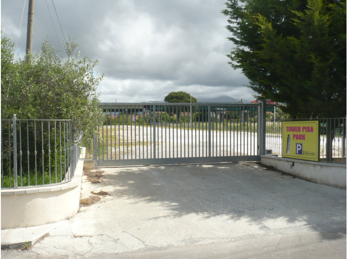
Immagine 15 - Vista da Via Cariola