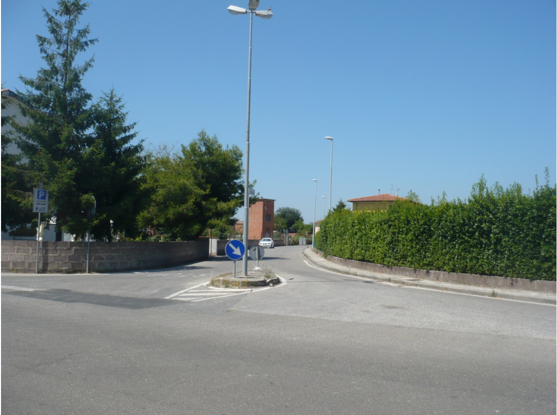
Immagine 23 Via di S.Giusto vista dall'incrocio con via S. Agostino e via Asmara