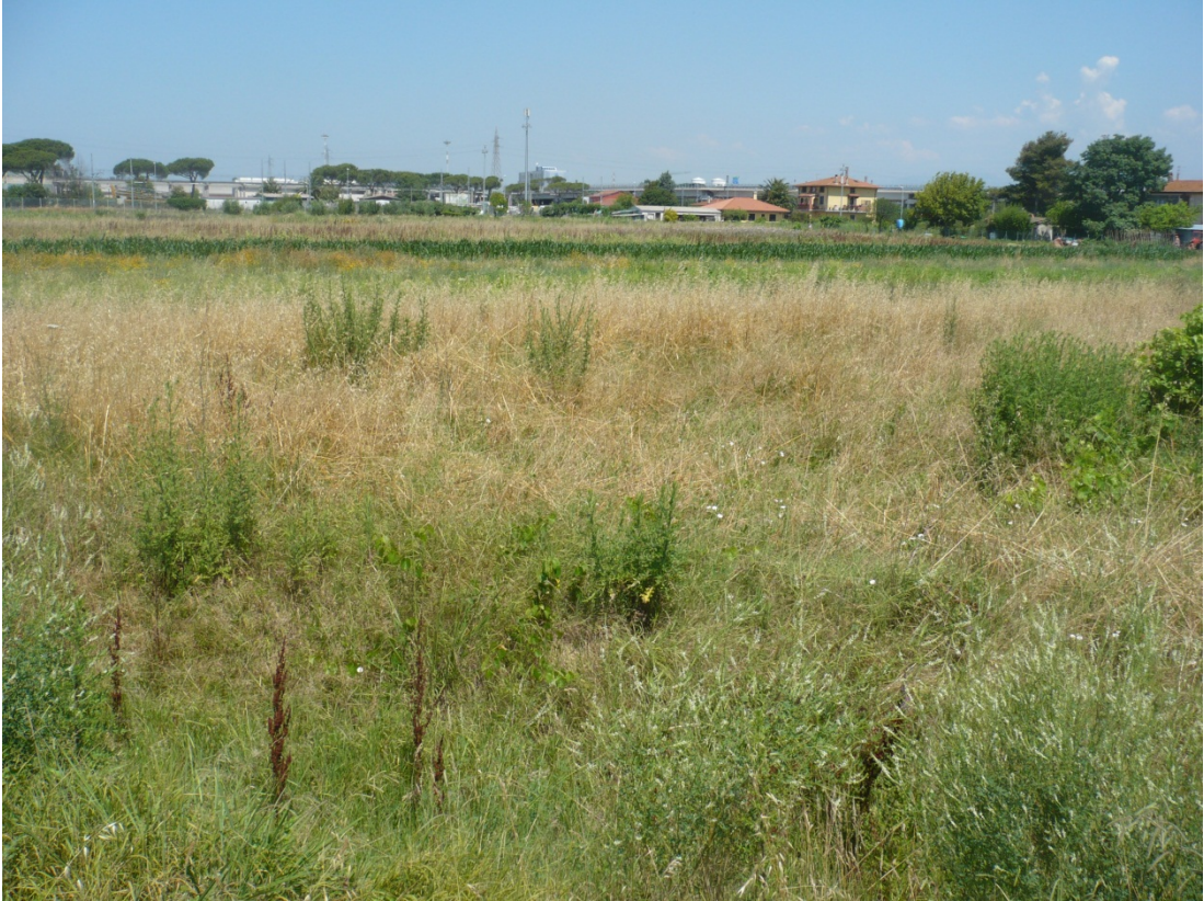
Immagine 45 area compresa tra via S. Giusto e Via Gargalone vista da Via Gargalone