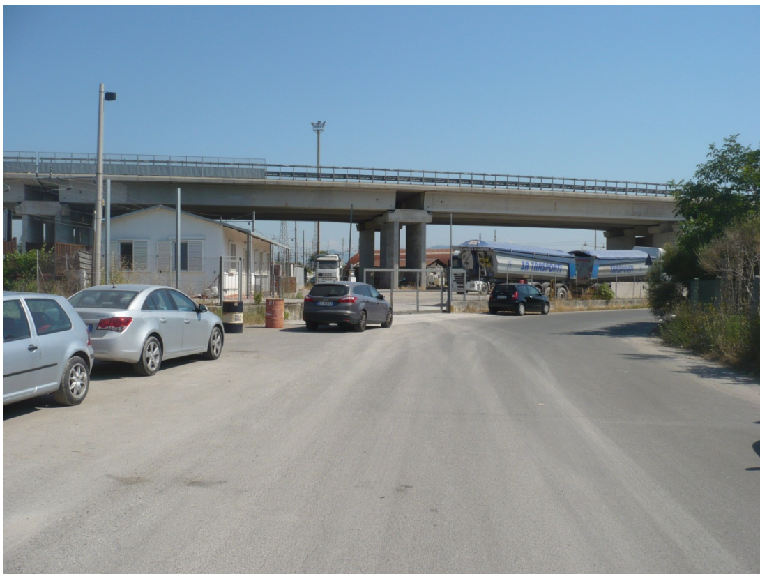
Immagine 13 tratto finale di via degli Olmetti visto in direzione SGC FiPiLi