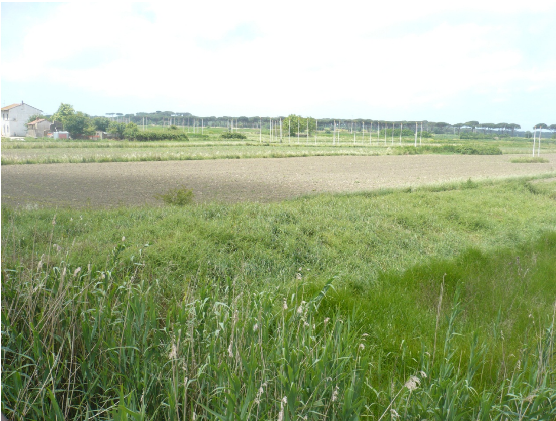
Foto 8 da Via Enrico Pezzi tra la ferrovia e l'aeroporto in direzione Sud Sud Ovest