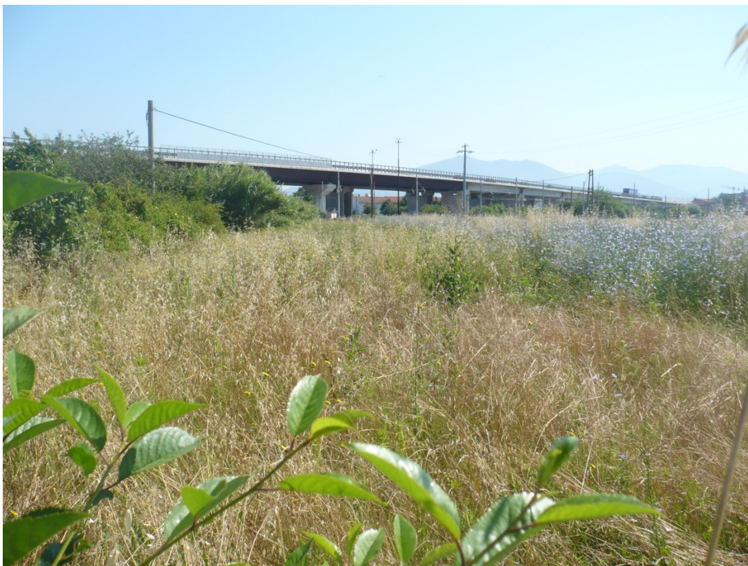
Immagine 9 area compresa tra ferrovia Pisa C.le – aeroporto e via di S.Giusto vista da via degli Olmetti angolo con via di S.Giusto