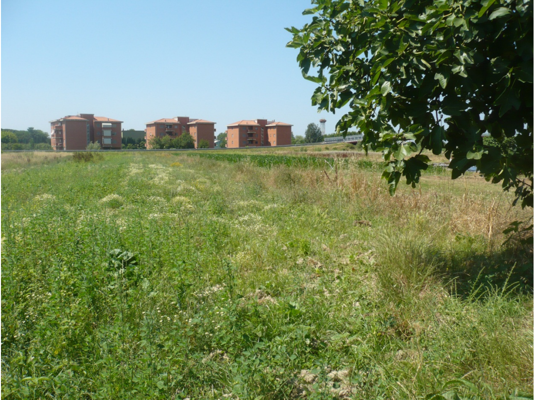
Immagine 31 area compresa tra via di S. Giusto e Via Gargalone vista da via di San Giusto