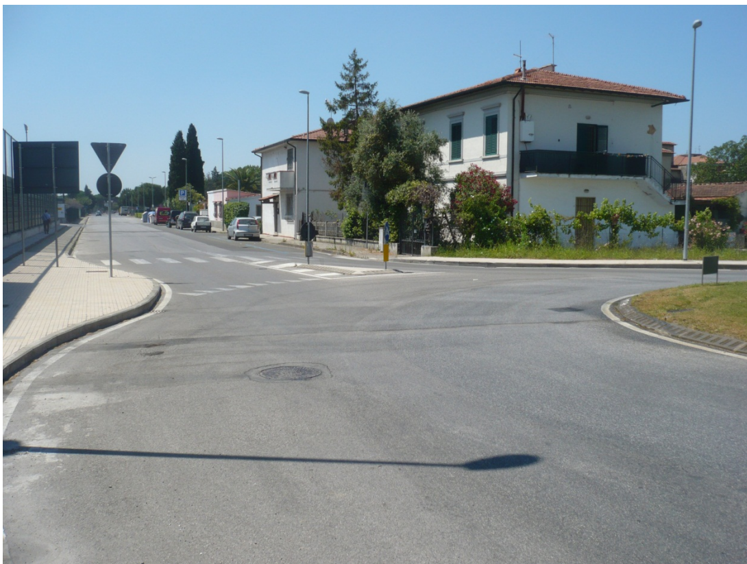
Immagine 41 via Caduti di Kindu vista da rotatoria con via Gargalone