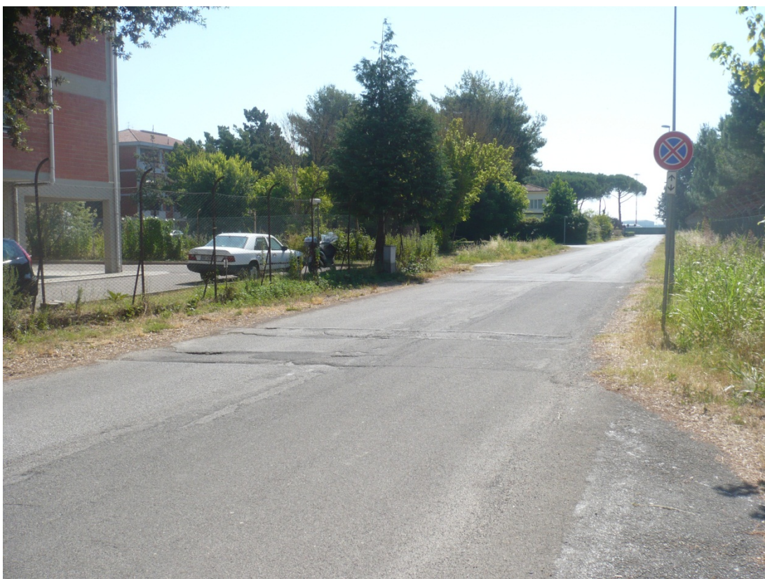
Immagine 4 Via degli Olmetti vista in direzione aeroporto