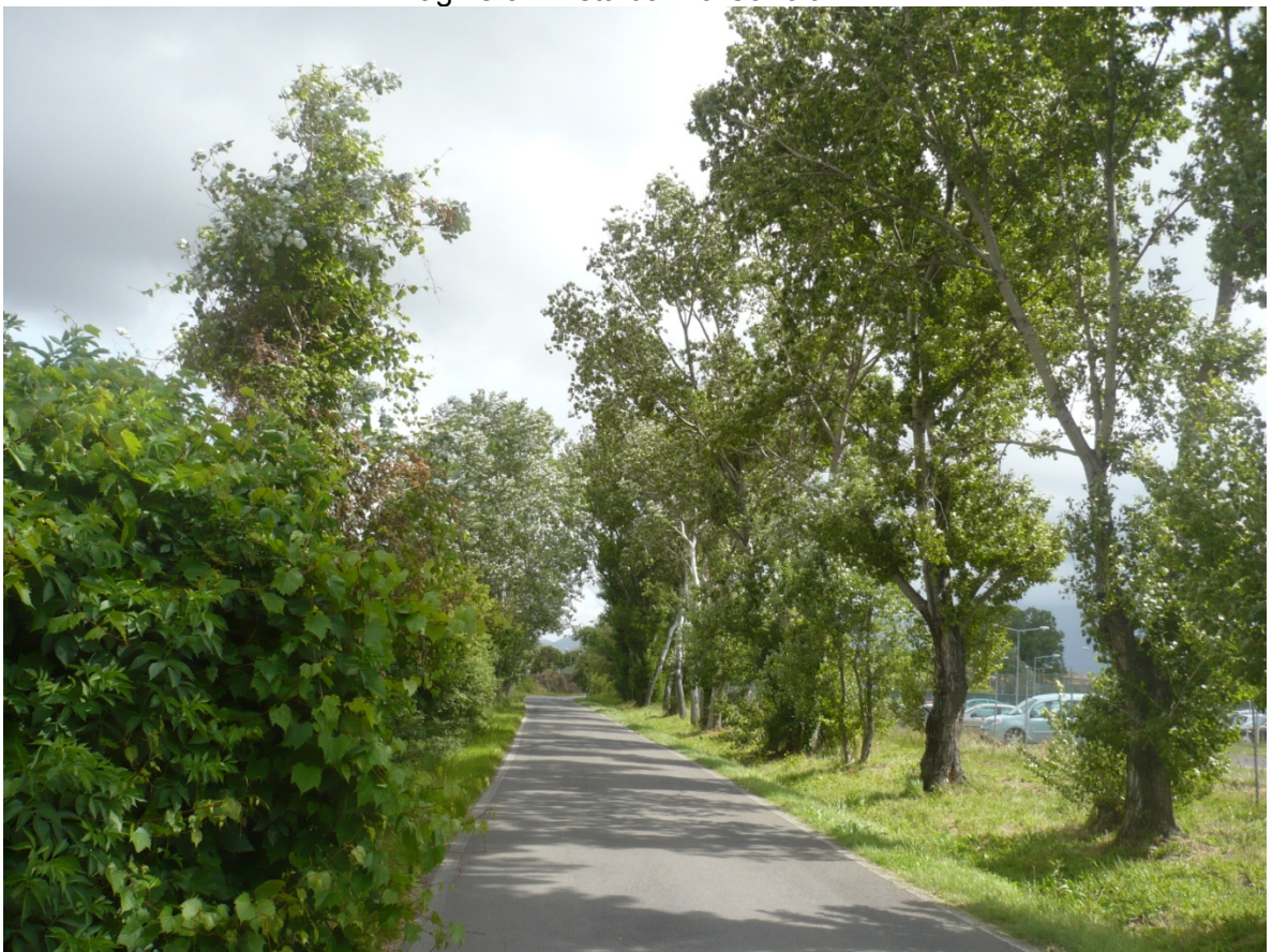
Immagine 6 - Vista da Via Cariola