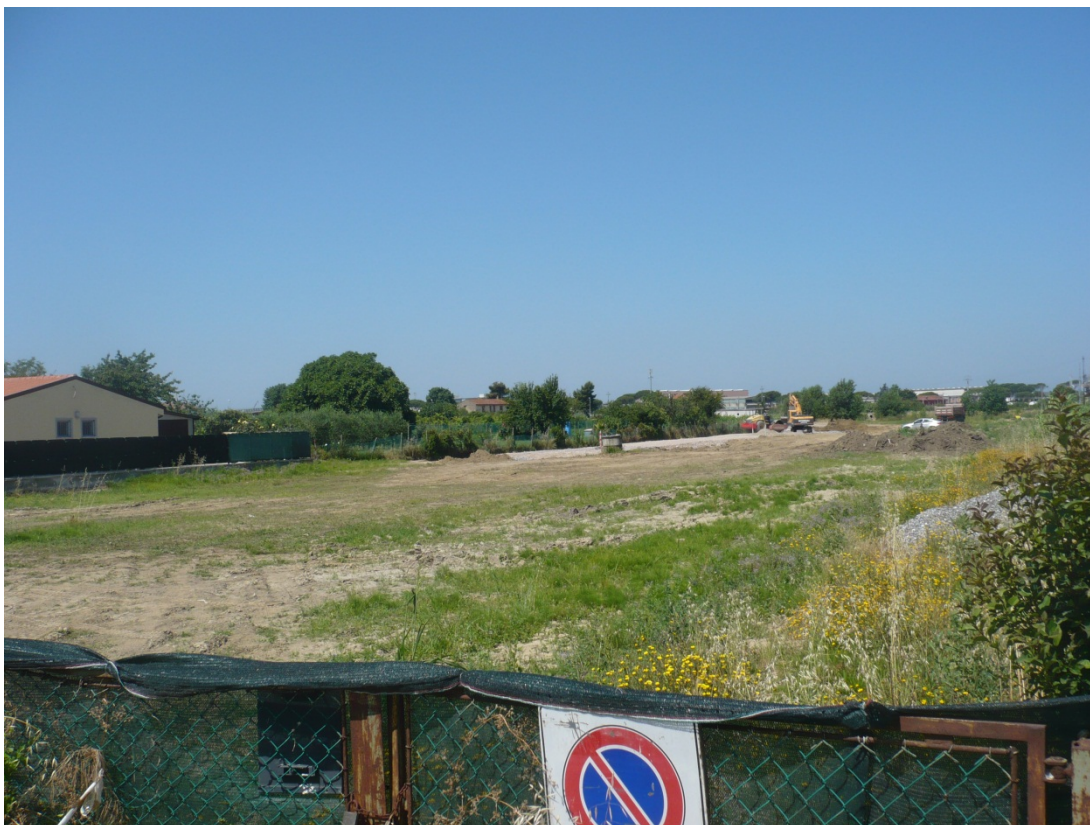
Immagine 21 area cantiere people mover posta su lato sud della ferrovia Pisa c.le –aeroporto vista dal passaggio a livello con via S.Agostino