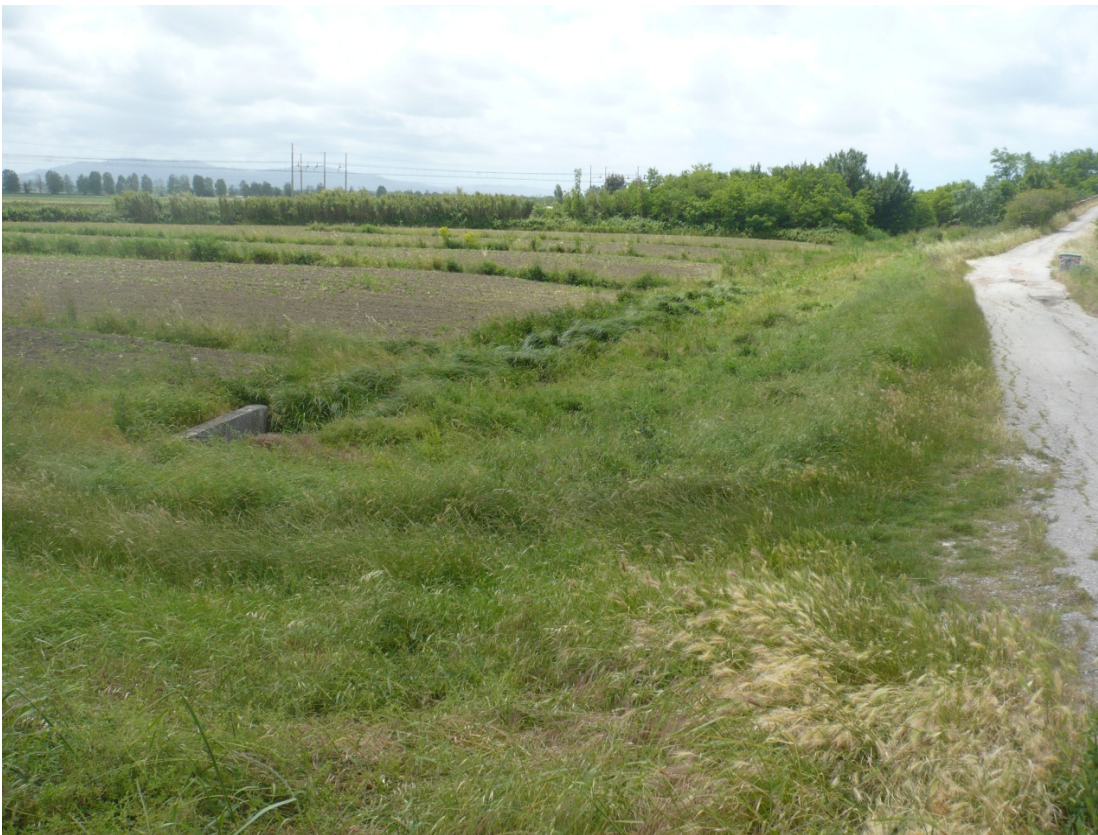
Foto 14 da Via Enrico Pezzi tra la ferrovia e l'aeroporto in direzione Sud