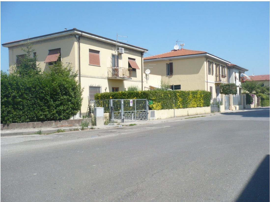
Immagine 24 via S.Agostino in direzione del passaggio a livello vista dall'incrocio con via di S. Giusto