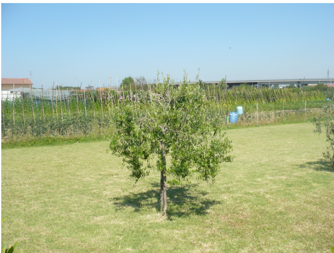
Immagine 26 area compresa tra ferrovia Pisa C.le – aeroporto e via di S.Giusto vista via di S.Giusto