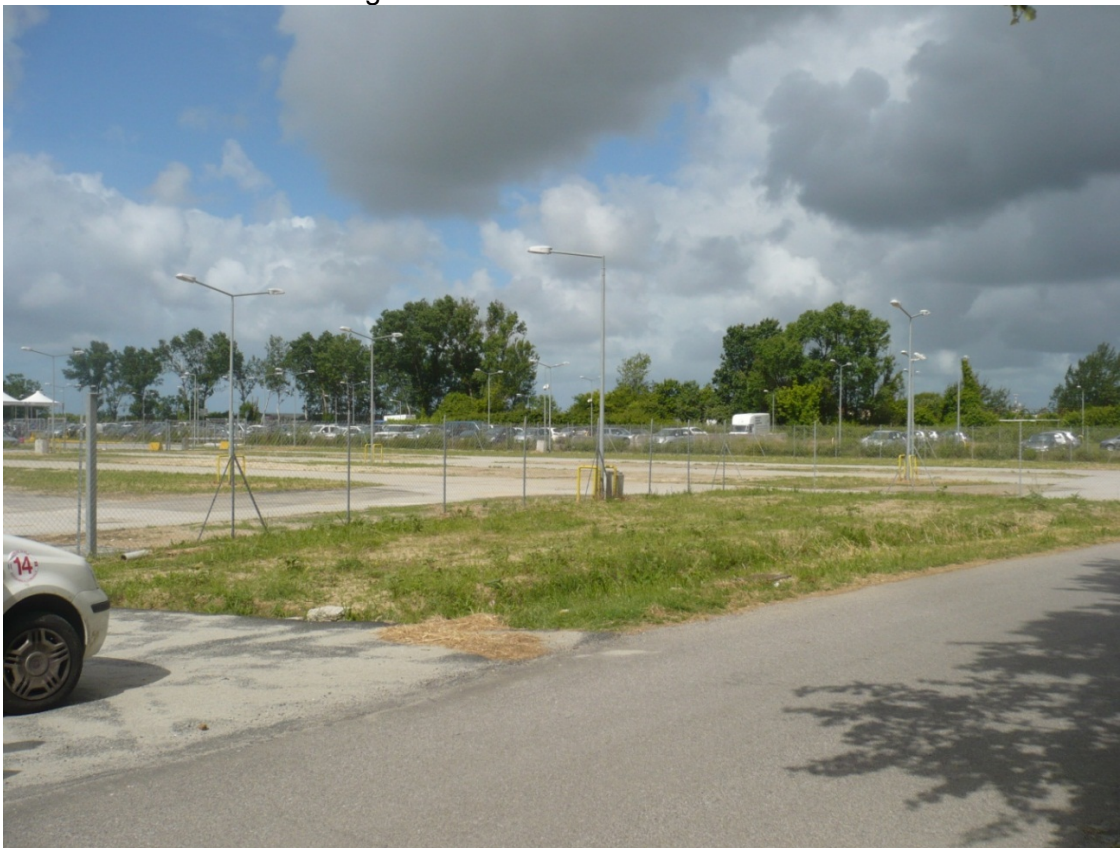
Immagine 2 - Vista da Via della Ferrovia