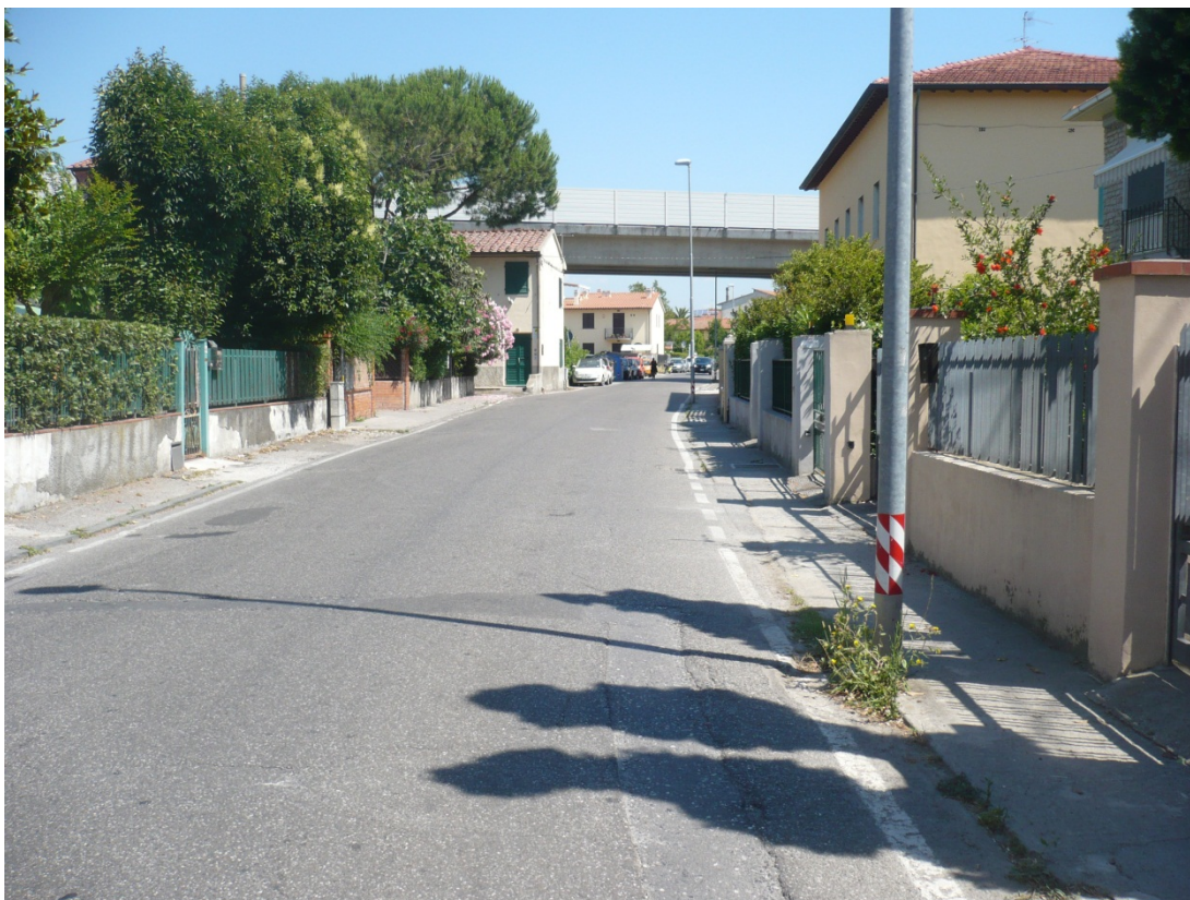
Immagine 18 via S:Agostino vista in direzione della SGC FiPiLi