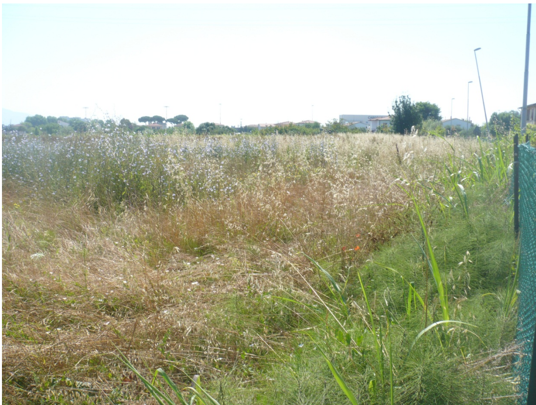
Immagine 11 area compresa tra ferrovia Pisa C.le – aeroporto e via di S.Giusto vista da via degli Olmetti angolo con via di S.Giusto