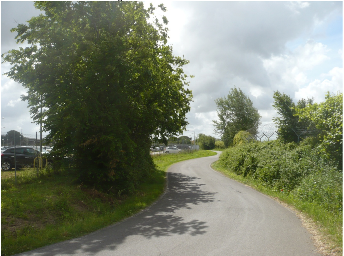
Immagine 8 - Vista da Via Cariola