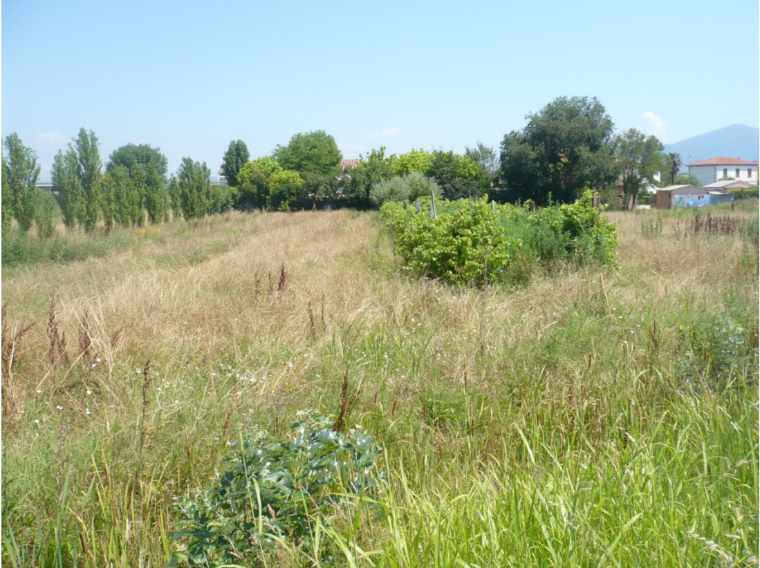
Immagine 43 area compresa tra via S. Giusto e Via Gargalone vista da Via Gargalone