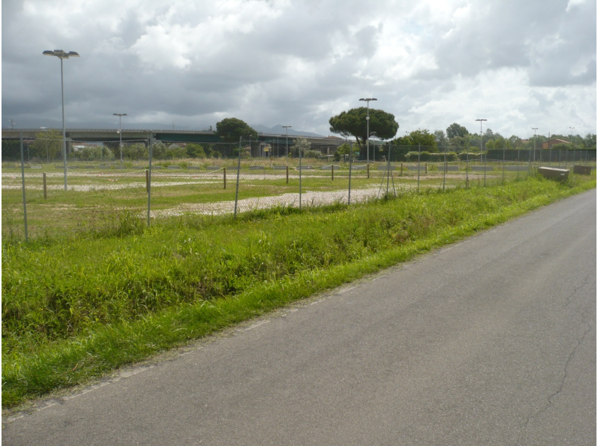
Immagine 11 - Vista da Via Cariola