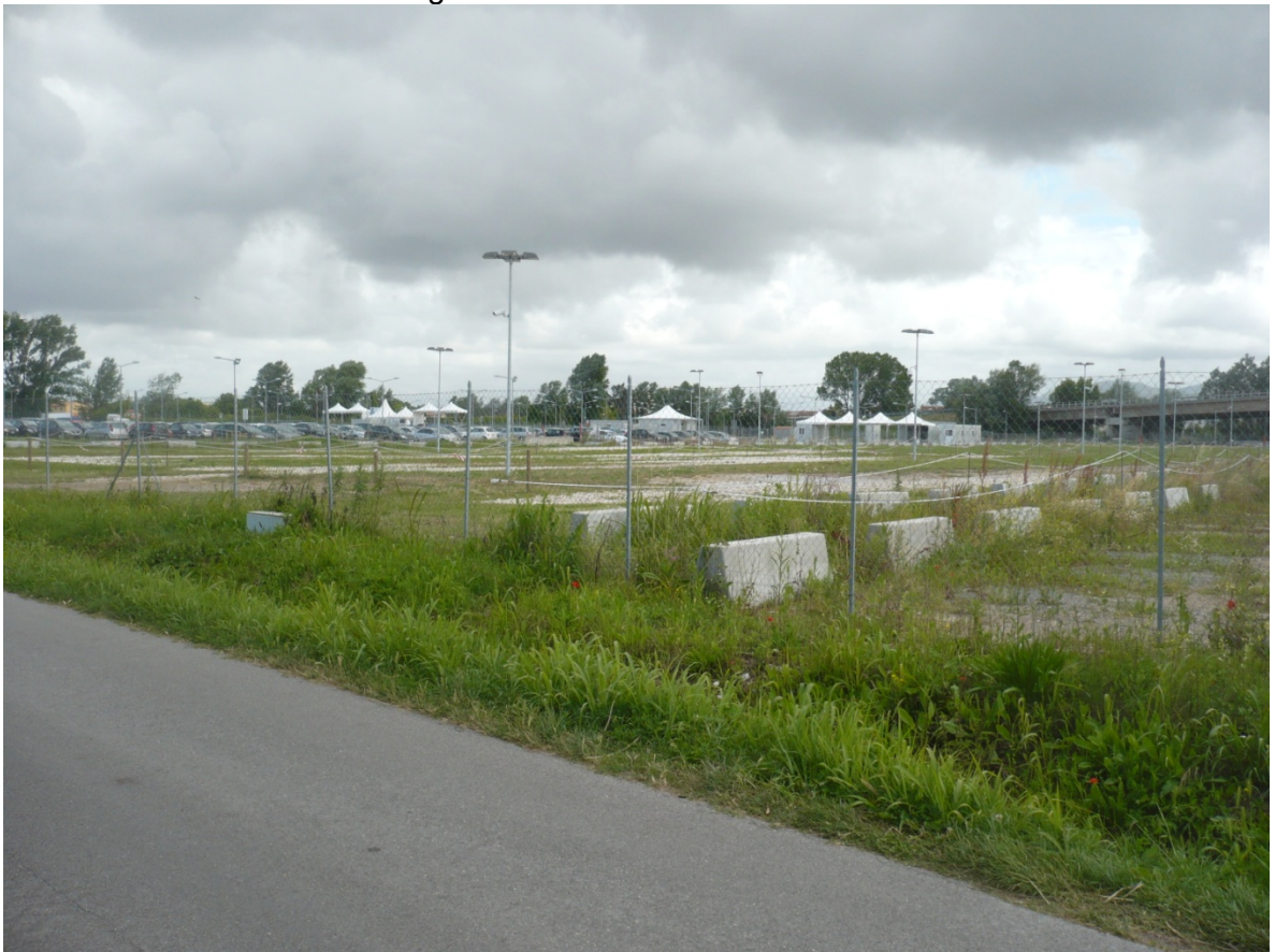
Immagine 12 - Vista da Via Cariola