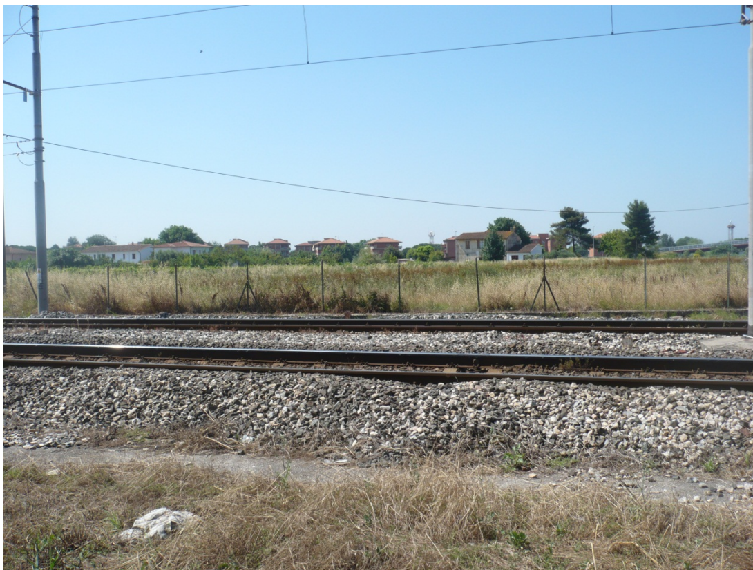
Immagine 16 ferrovia Pisa c.le – aeroporto vista da via di Goletta