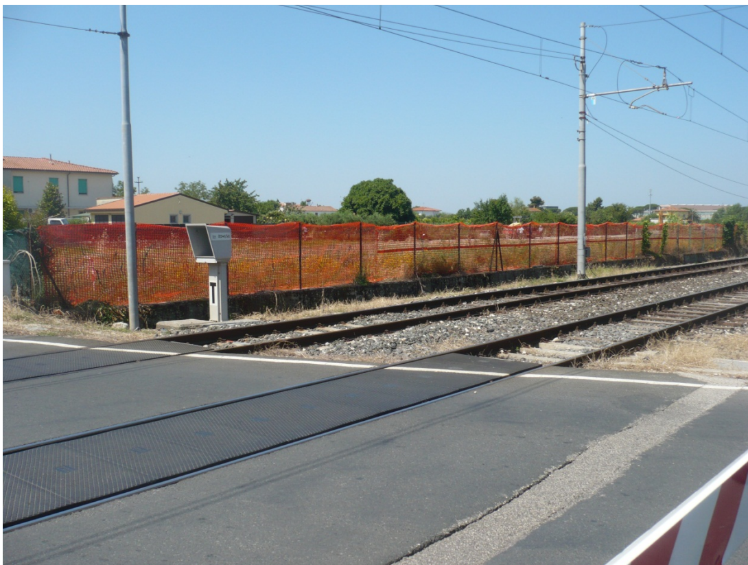
Immagine 20 ferrovia e area cantiere People Mover vista dal passaggio a livello di via S:Agostino