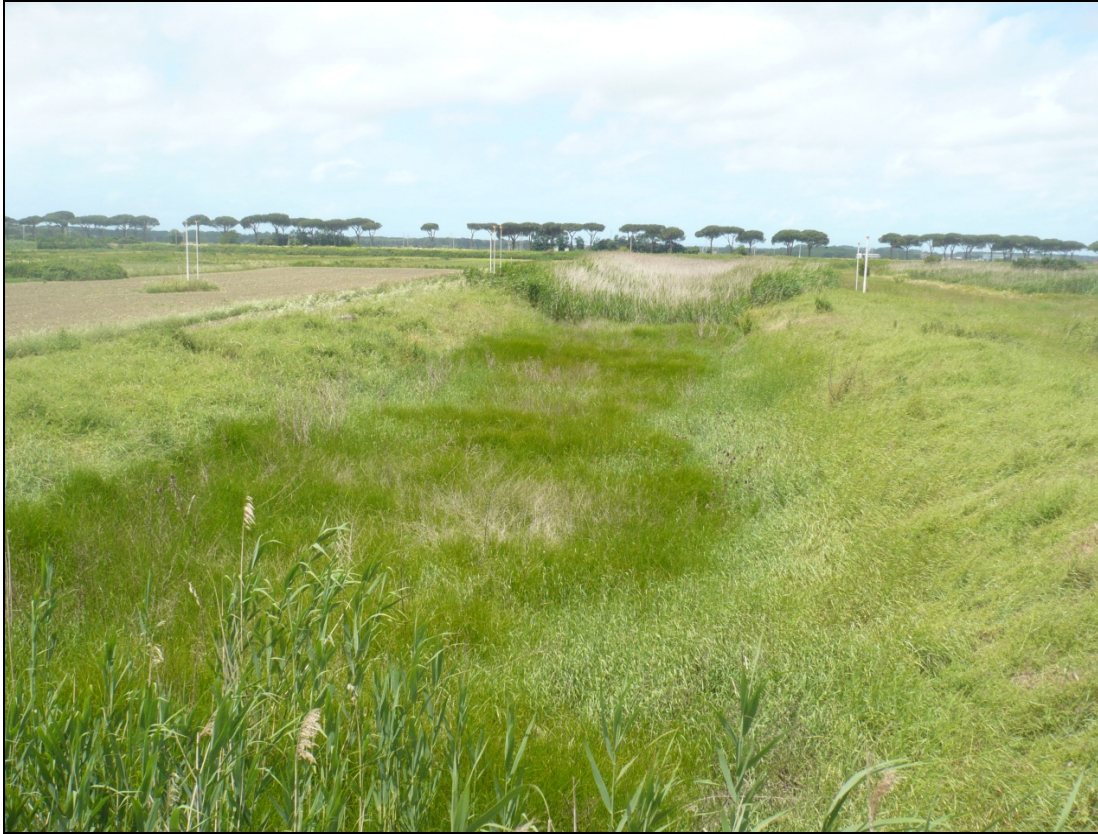
Foto 9 da Via Enrico Pezzi tra la ferrovia e l'aeroporto in direzione Ovest