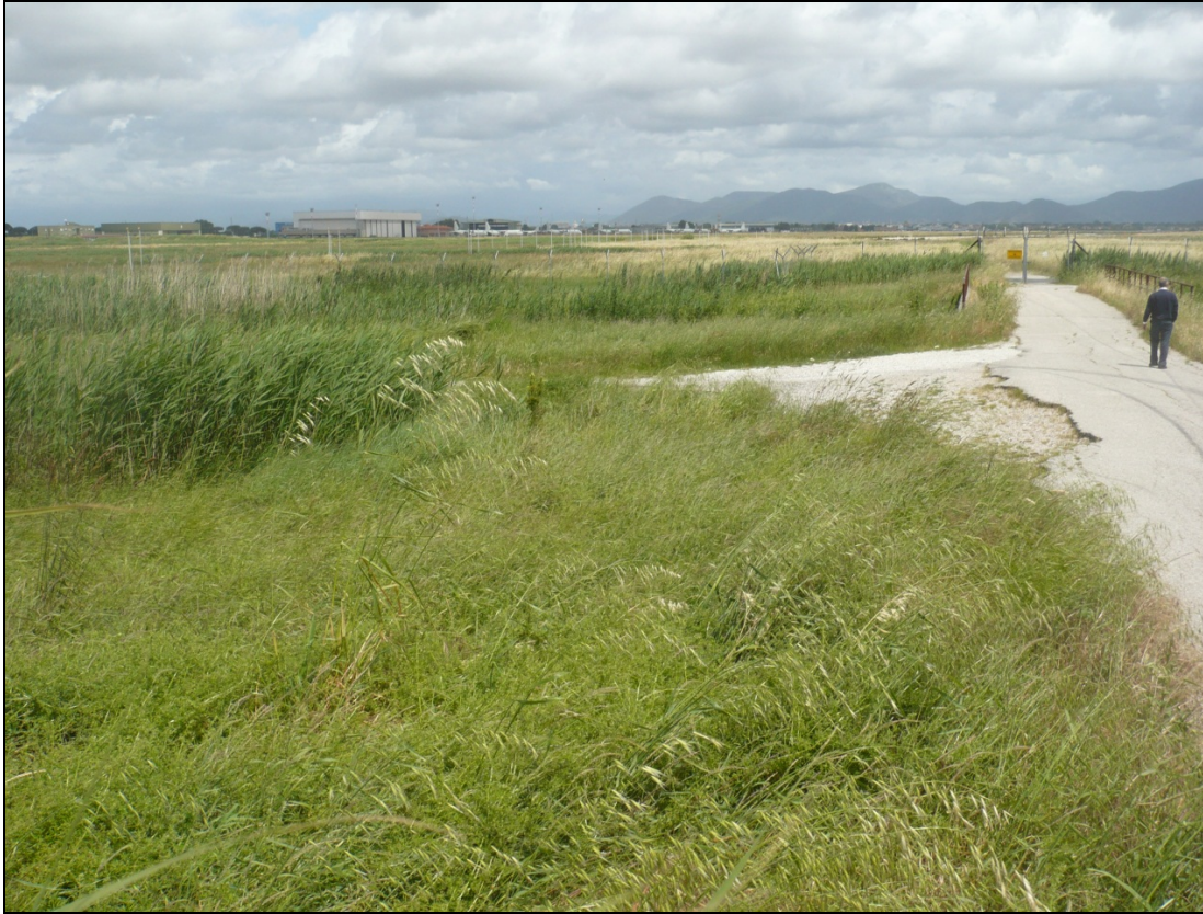
Foto 11 da Via Enrico Pezzi tra la ferrovia e l'aeroporto in direzione Nord