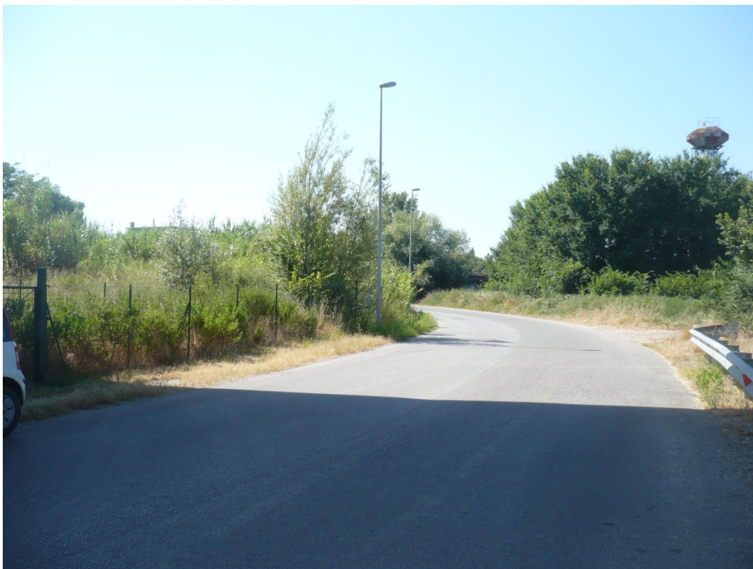
Immagine 8 Via degli Olmetti vista da sotto il cavalcavia Gargalone in direzione sud