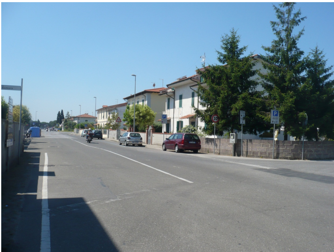
Immagine 22 Via Asmara vista dall'incrocio con via di S.Giusto