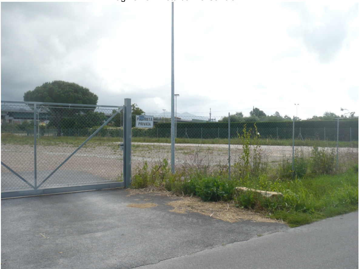
Immagine 14 - Vista da Via Cariola