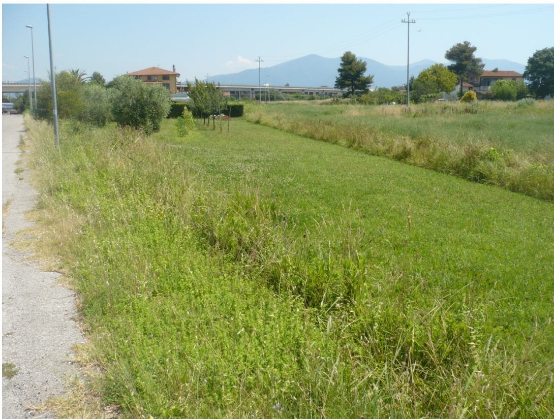
Immagine 39 area compresa tra via di S.Giusto e Via Gargalone vista da via degli Olmetti