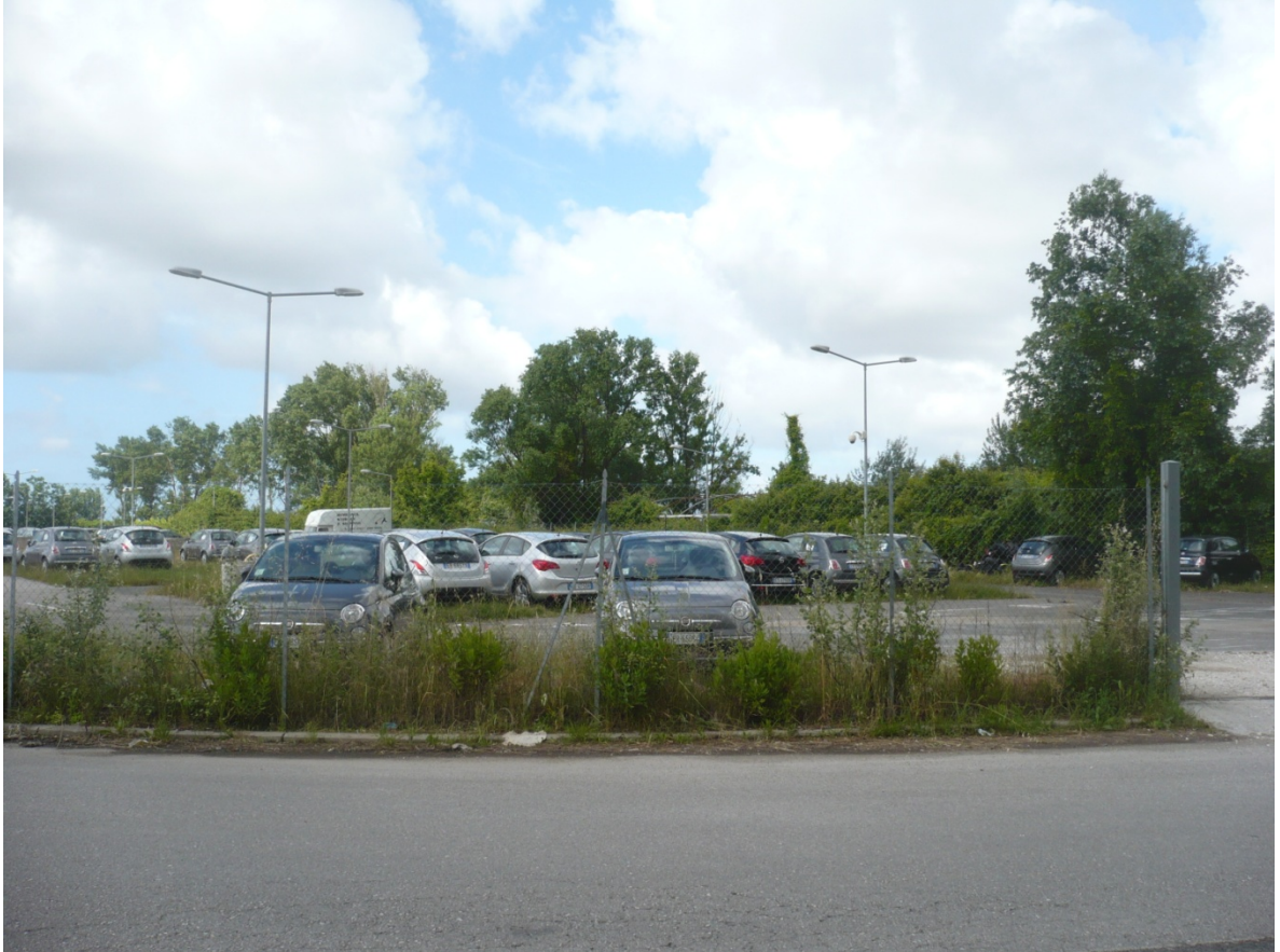
Immagine 3 - Vista da Via della Ferrovia