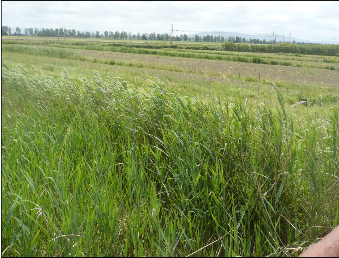
Foto 13 da Via Enrico Pezzi tra la ferrovia e l'aeroporto in direzione Sud Est