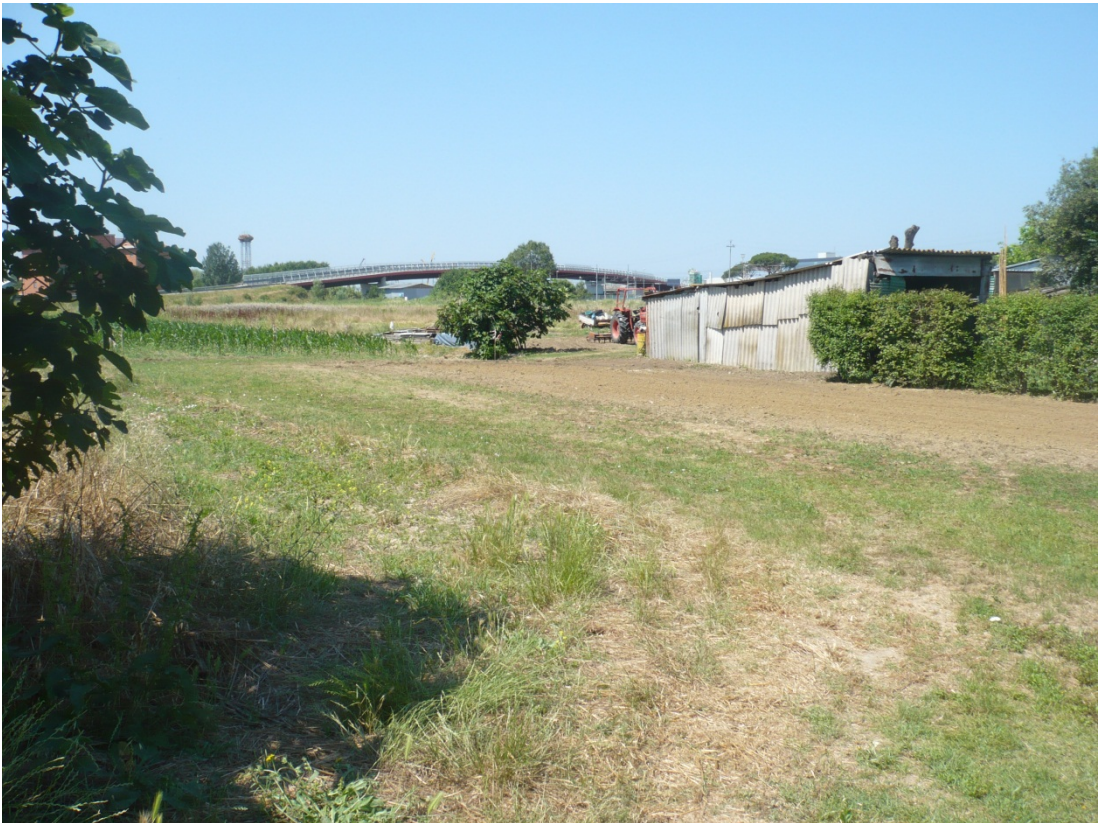
Immagine 32 area compresa tra via di S. Giusto e Via Gargalone vista da via di San Giusto