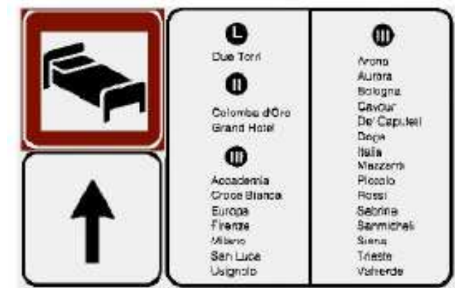
(figura II 299 art. 134 Codice della