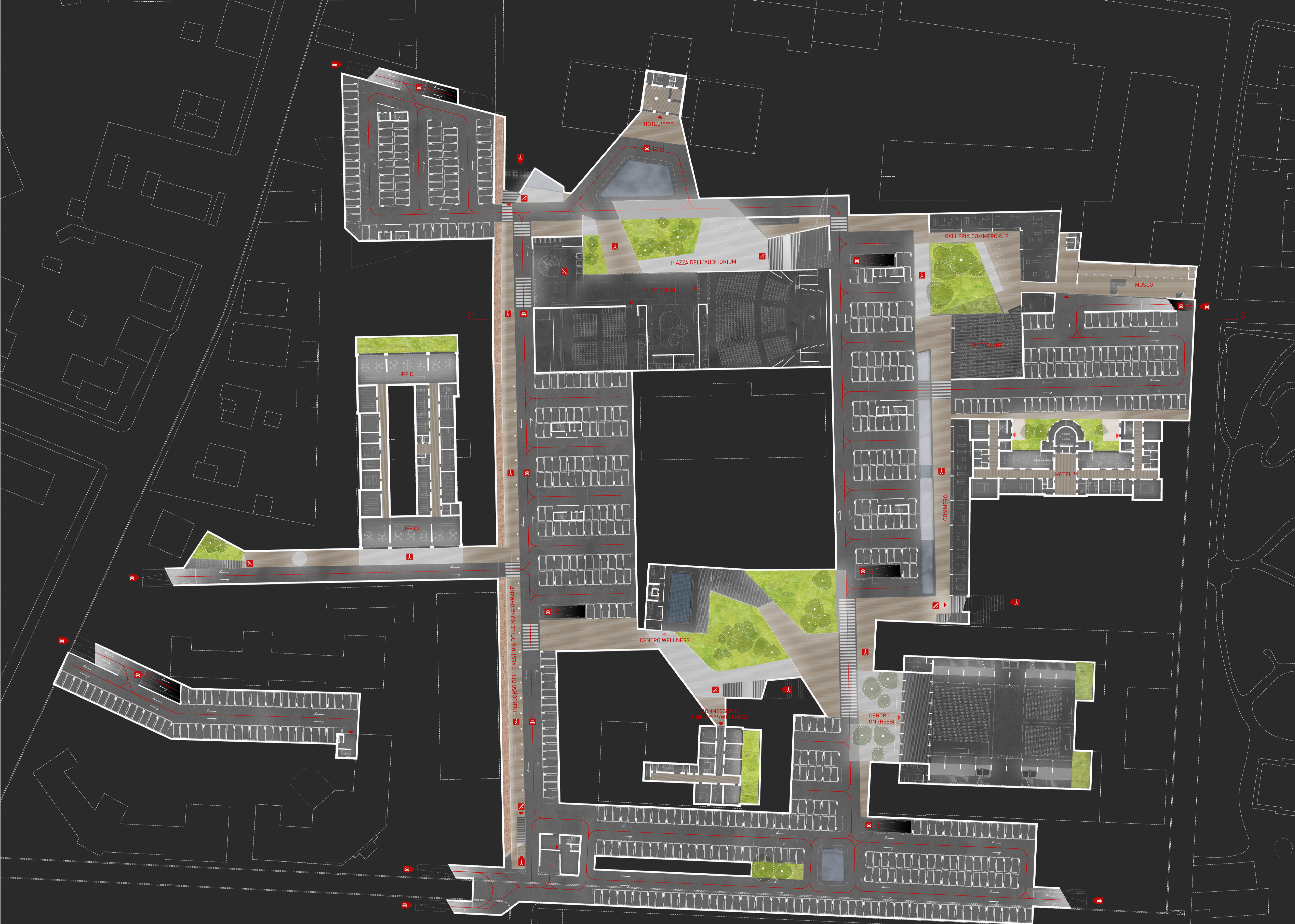
PLANIMETRIA CITTÀ IPOGEA 1/500