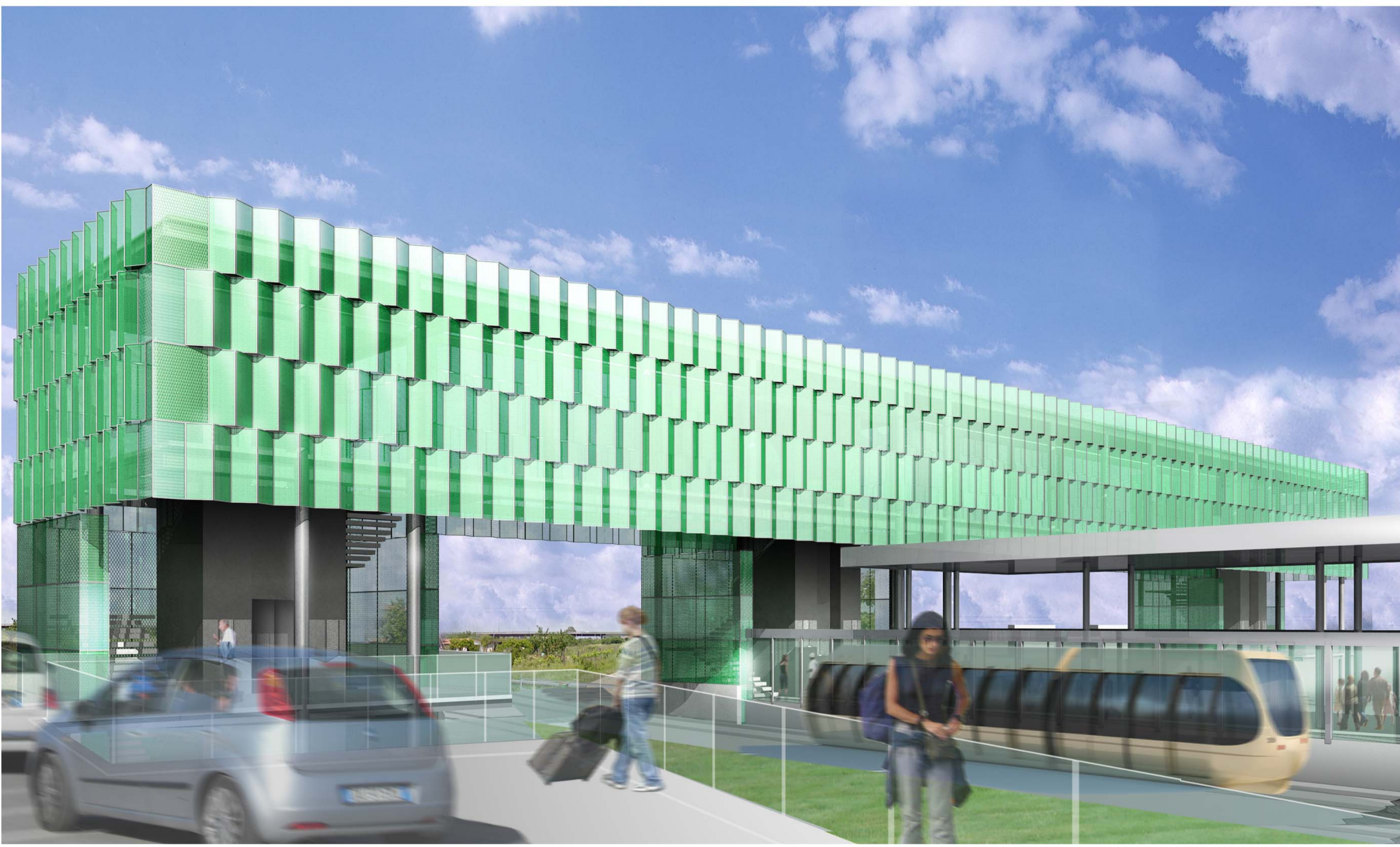
2_ VISTA PROSPETTICA_IL FRONTE NORD DAL PRIMO PIANO DEL NUOVO PARCHEGGIO