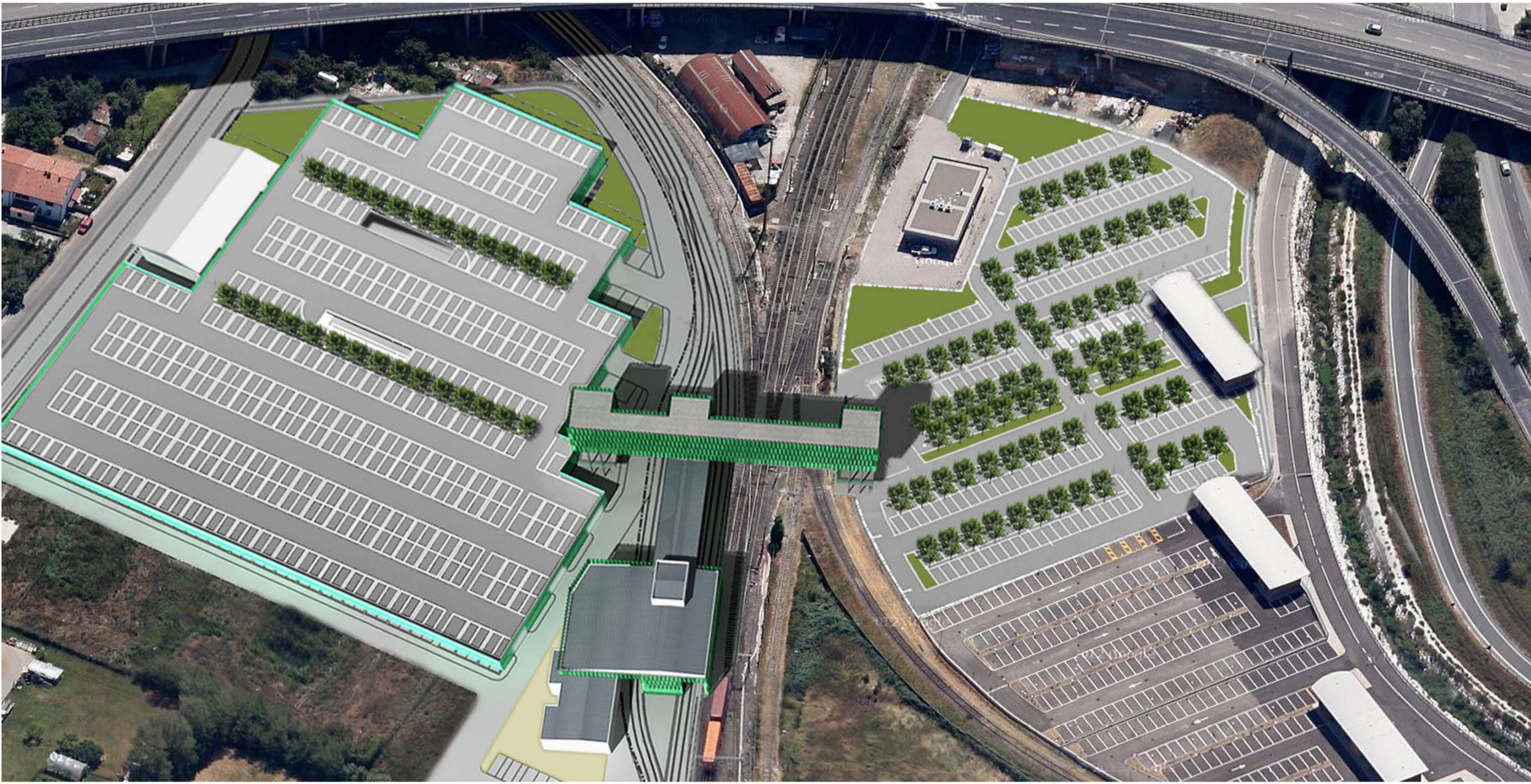
1_ STATO DI PROGETTO_VISTA AEREA