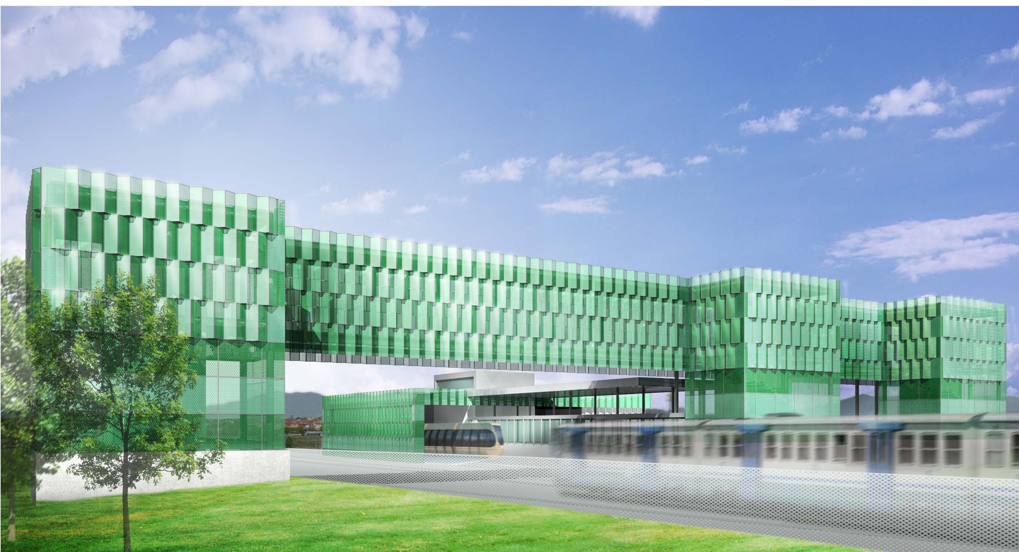
3_ VISTA PROSPETTICA_IL FRONTE SUD