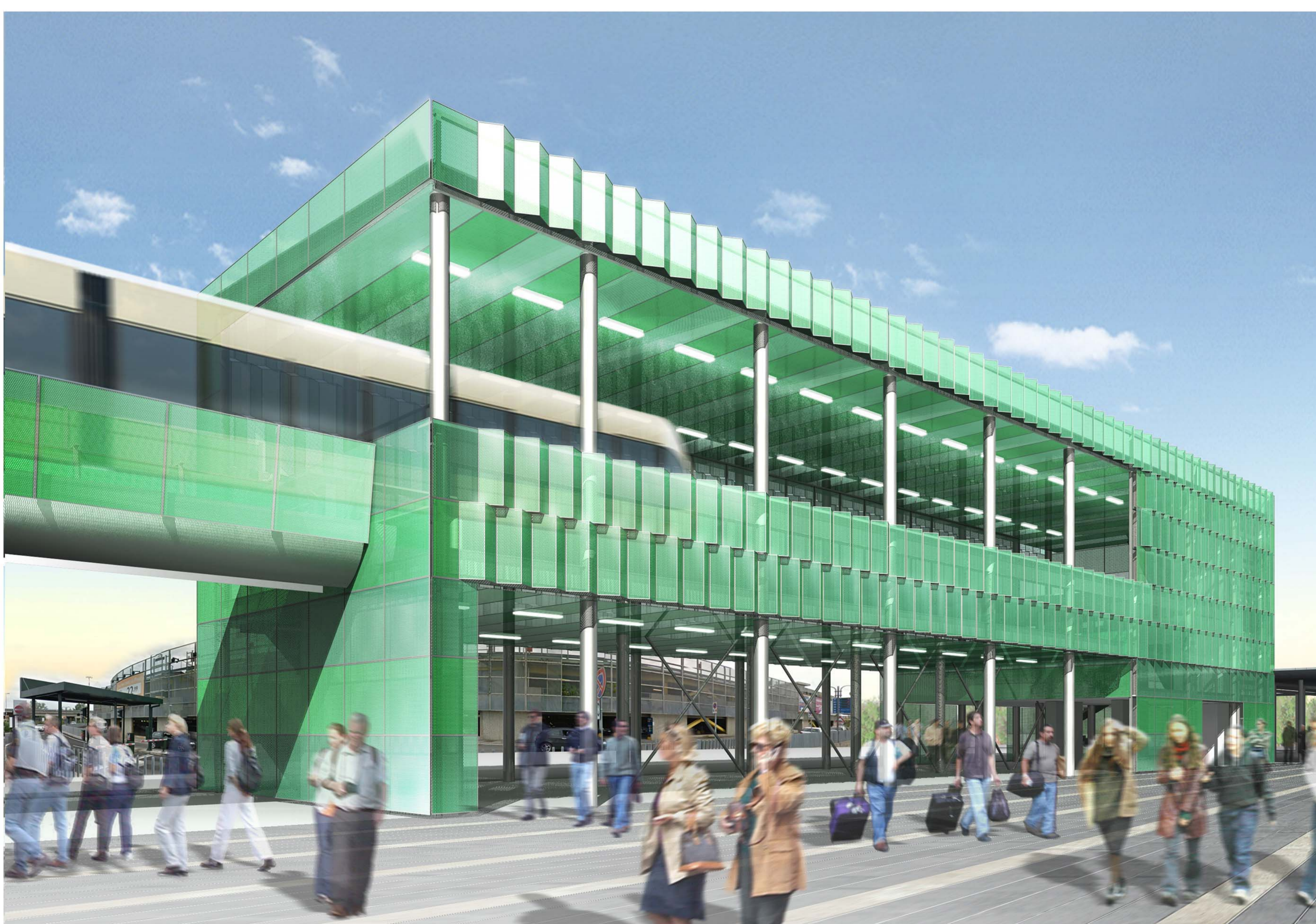
3_VISTA PROSPETTICA _ IL VIADOTTO E LA SCALA MOBILE