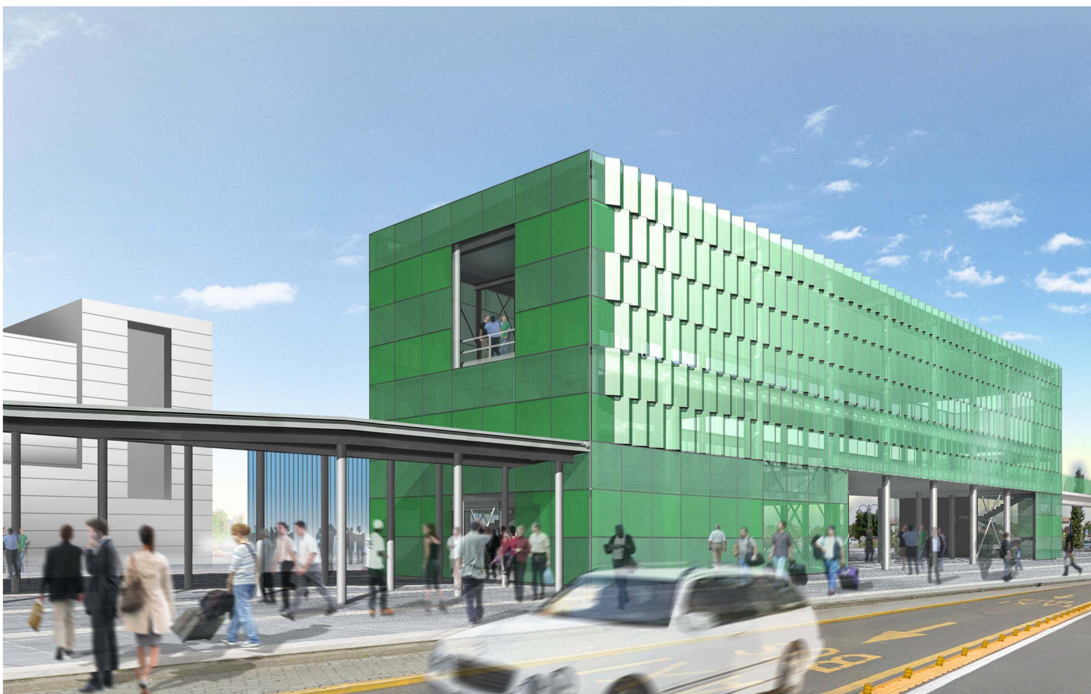
2_VISTA PROSPETTICA _ L'INGRESSO AL PEOPLE MOVER