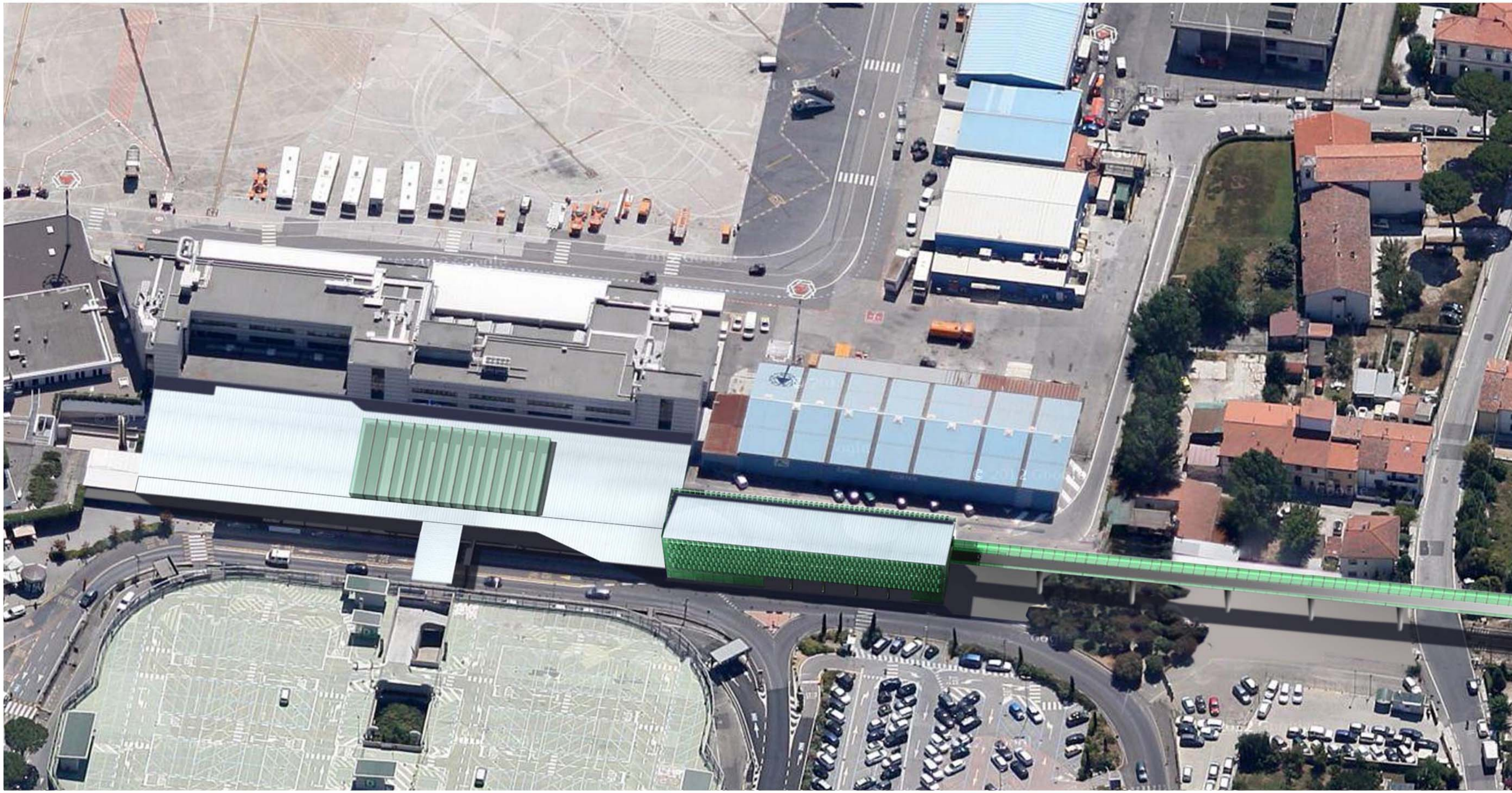
1_VISTA AEREA (CON PROPOSTA DI COPERTURA DEL CITYGATE NON INCLUSA NEL PROGETTO)