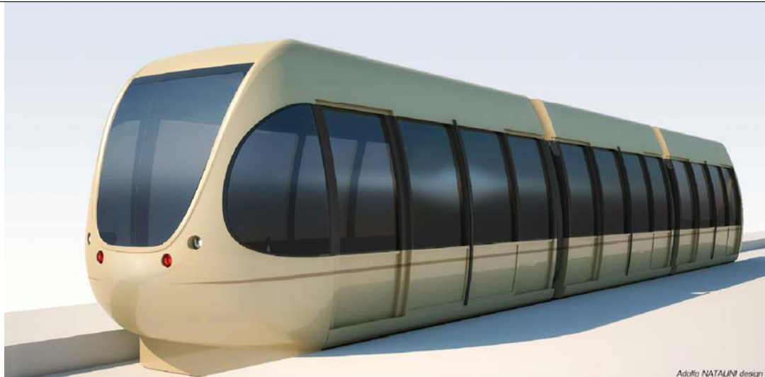
Adolfo NATALINI design