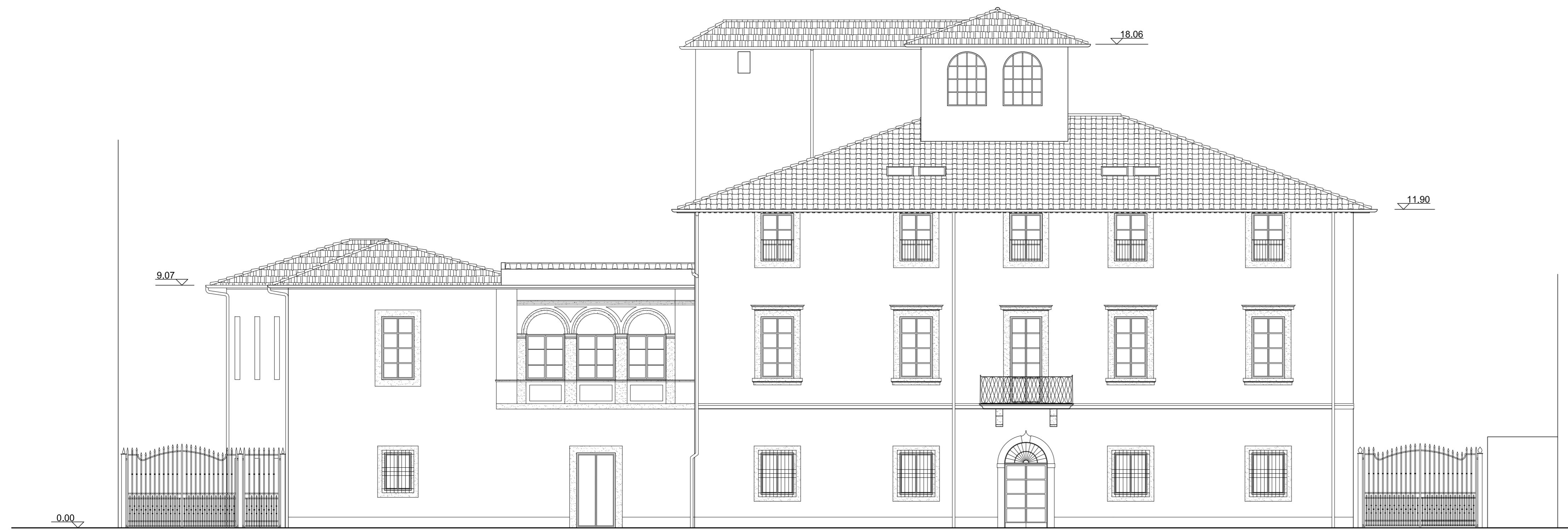
PROSPETTO SUD-OVEST (SU VIA VOLTURNO)