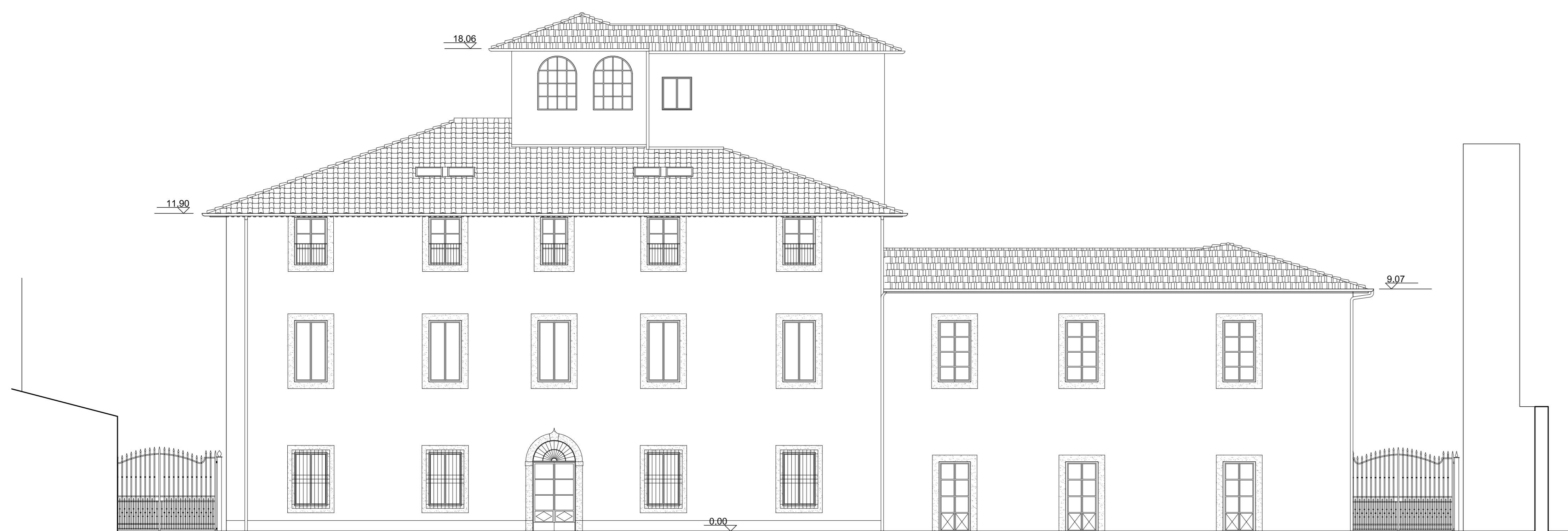
PROSPETTO NORD-EST (SU GIARDINO INTERNO)