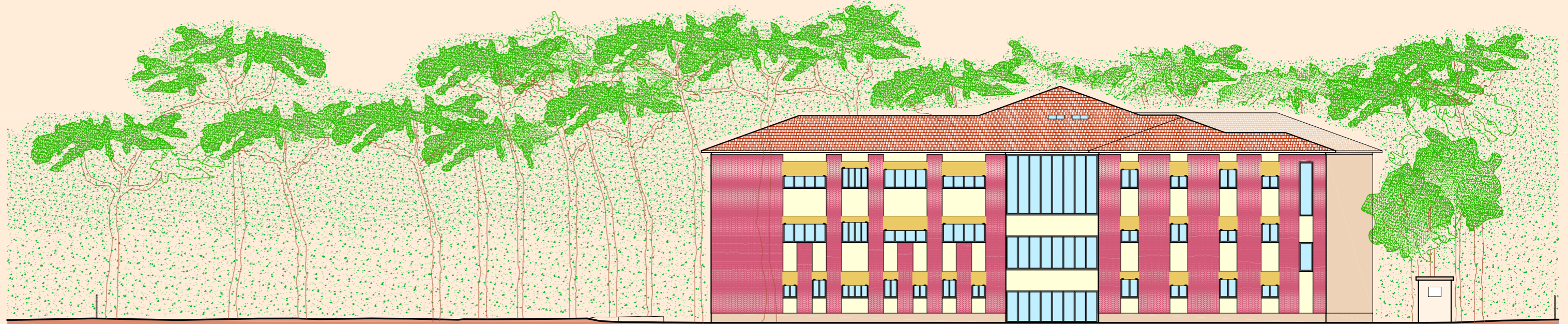
PROSPETTO RETRO (NORD)