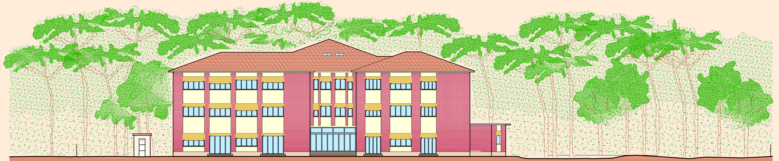
PROSPETTO FRONTE (SUD)

LICENZA AUTOCAD 2008 N° SERIE 343-26470687