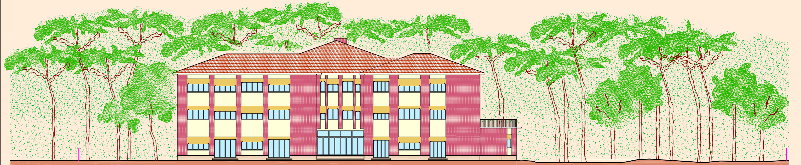
PROSPETTO FRONTE (SUD)

LICENZA AUTOCAD 2006 N° SERIE 343-66470687