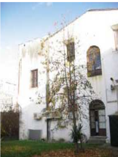
Prospetto interno Est