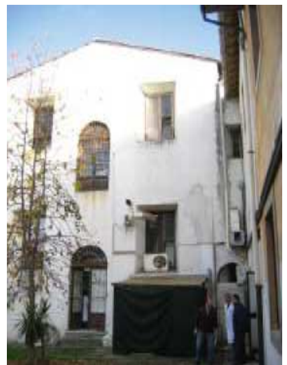
Prospetto interno Est