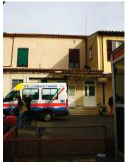
Prospetto Sud Anatomia