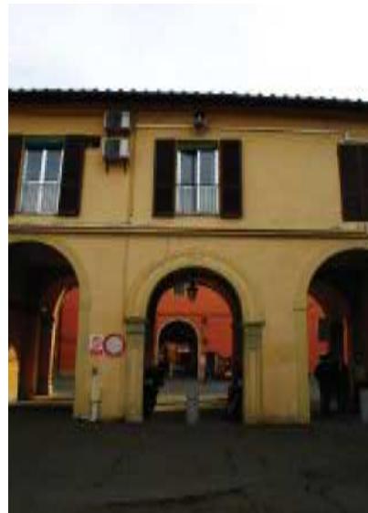
Prospetto Ovest braccio Sud