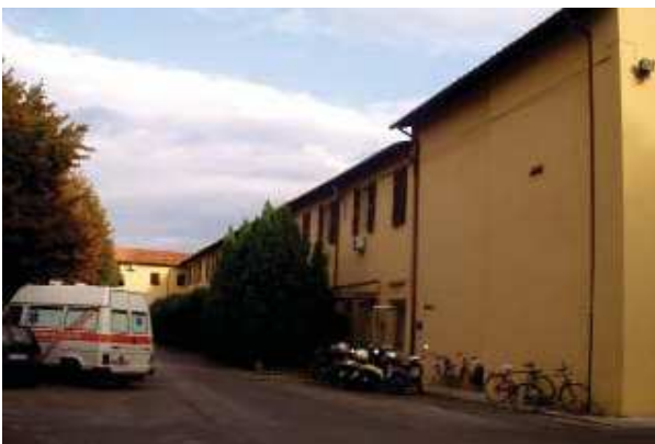
Prospetto Nord braccio Sud