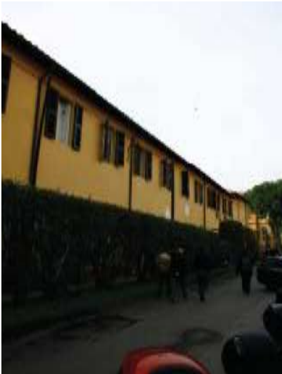
Prospetto Nord braccio Sud