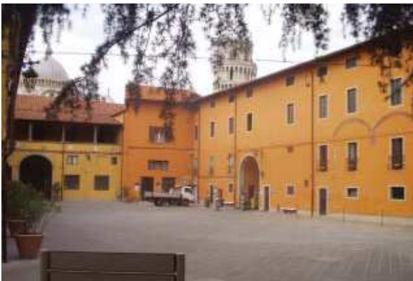
Prospecto Est corte