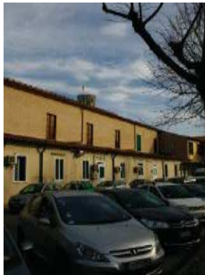
Prospetto Sud Anatomia