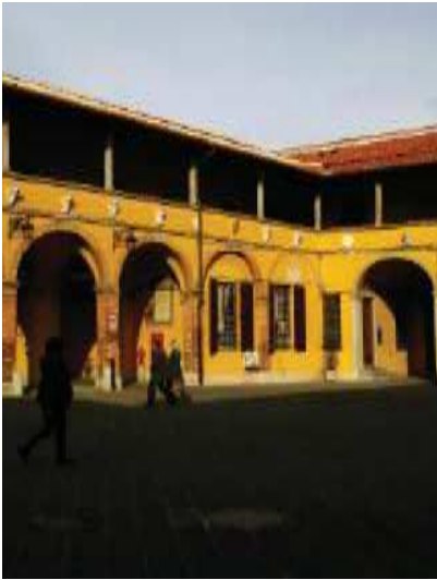
Prospecto corte Ovest