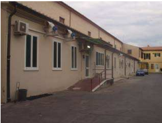
Prospetto Sud Anatomia