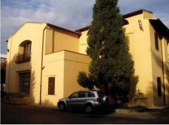
Prospetto Ovest braccio Sud