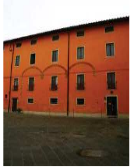
Prospecto corte Est