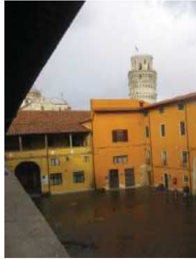
Prospecto corte Nord