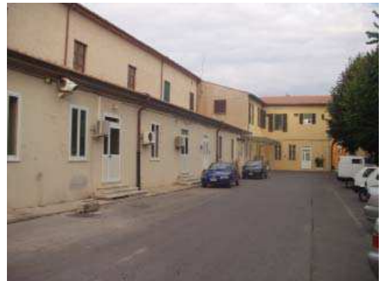
Prospetto Sud Anatomia