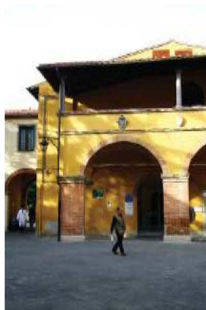
Prospetto Est braccio Sud