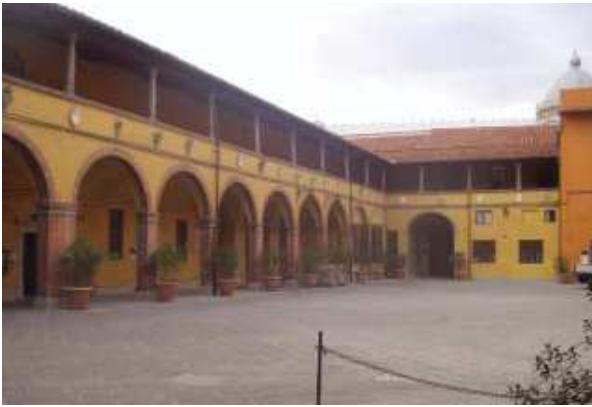
Prospecto Ovest corte