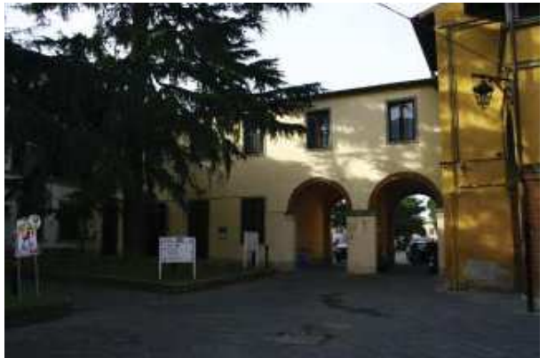
Prospetto Est braccio Sud