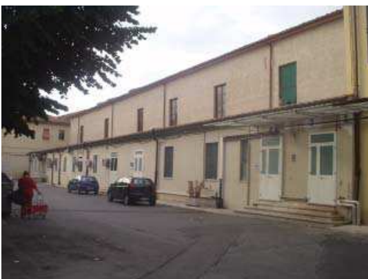
Prospetto Sud Anatomia