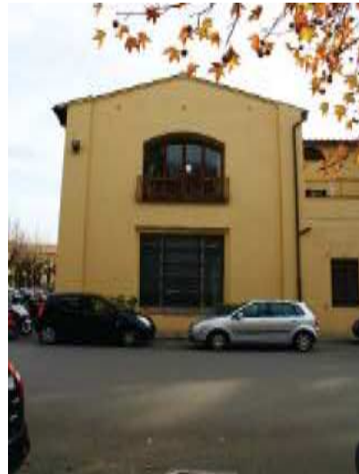
Prospetto Ovest braccio Sud