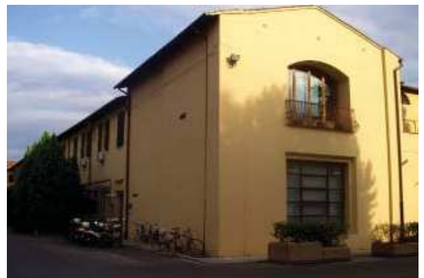
Prospetto Ovest braccio Sud