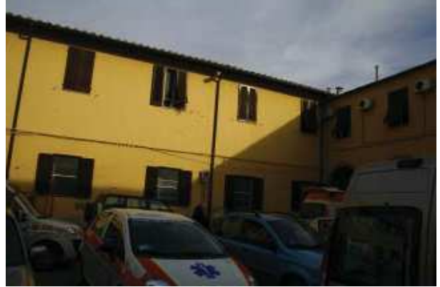
Prospetto Sud braccio Sud