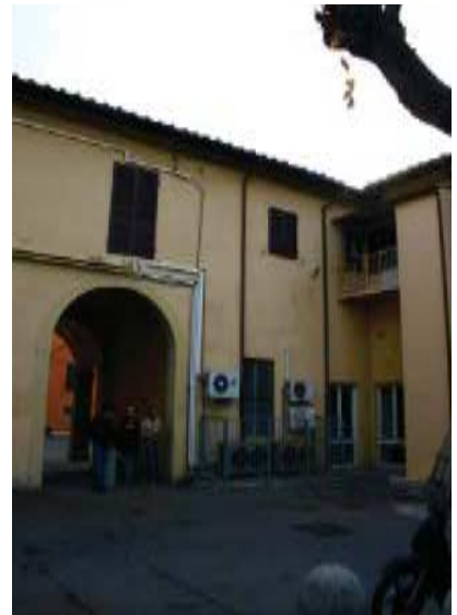
Prospetto Ovest braccio Sud