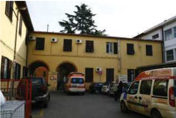
Prospetto Ovest braccio Sud