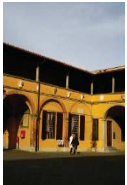
Prospetto Est braccio Sud