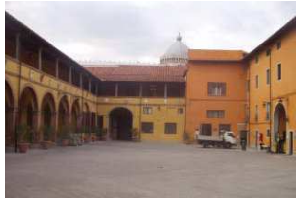
Prospecto Nord corte