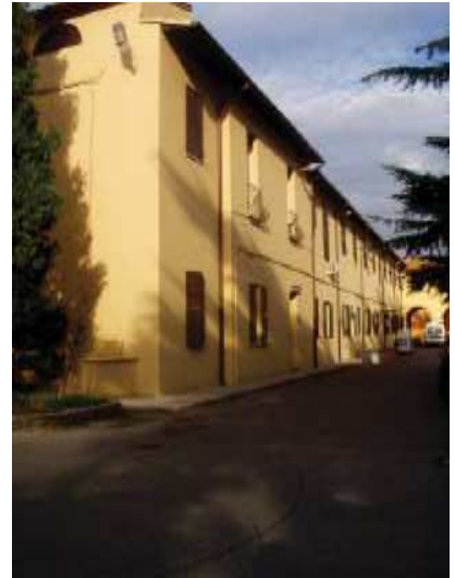
Prospetto Sud braccio Sud