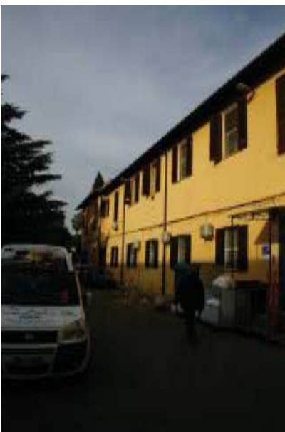
Prospetto Sud braccio Sud