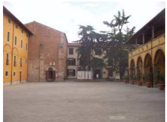
Prospecto Sud corte