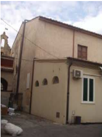
Prospetto Ovest Anatomia