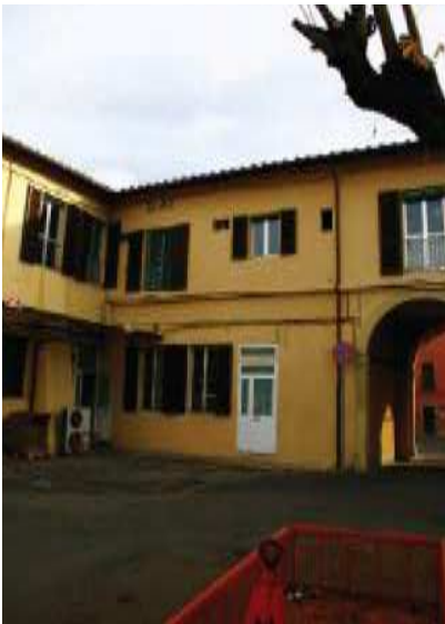
Prospetto Ovest braccio Sud