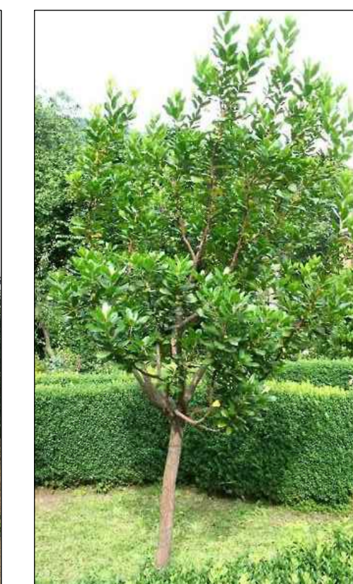
Arbutus unedo Corbezzolo