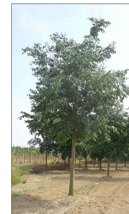
Celtis australis Bagolaro