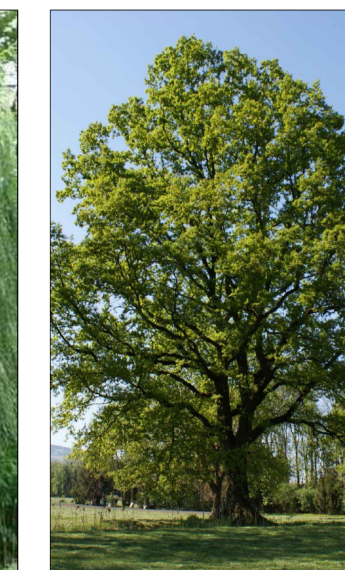
Quercus robur Quercia