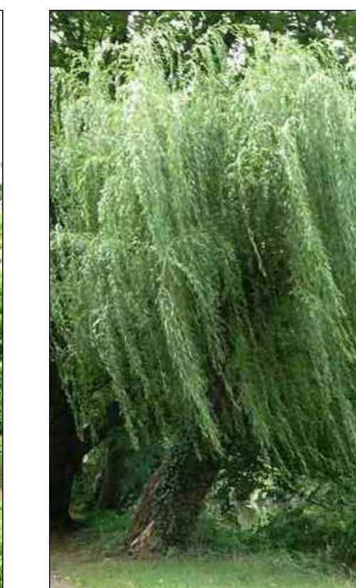
Salix alba Salice bianco