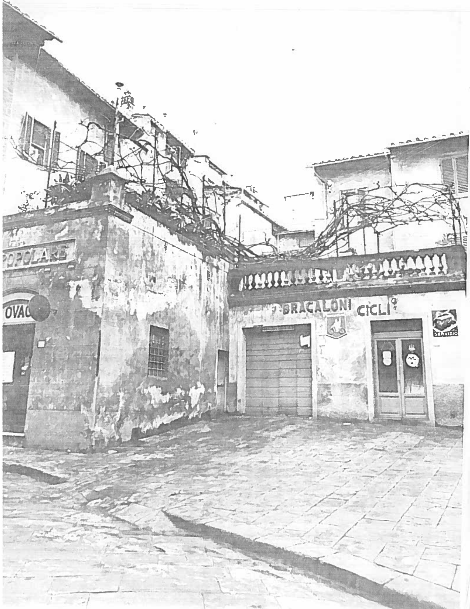
VIA D. CAVALCA n° 41-43