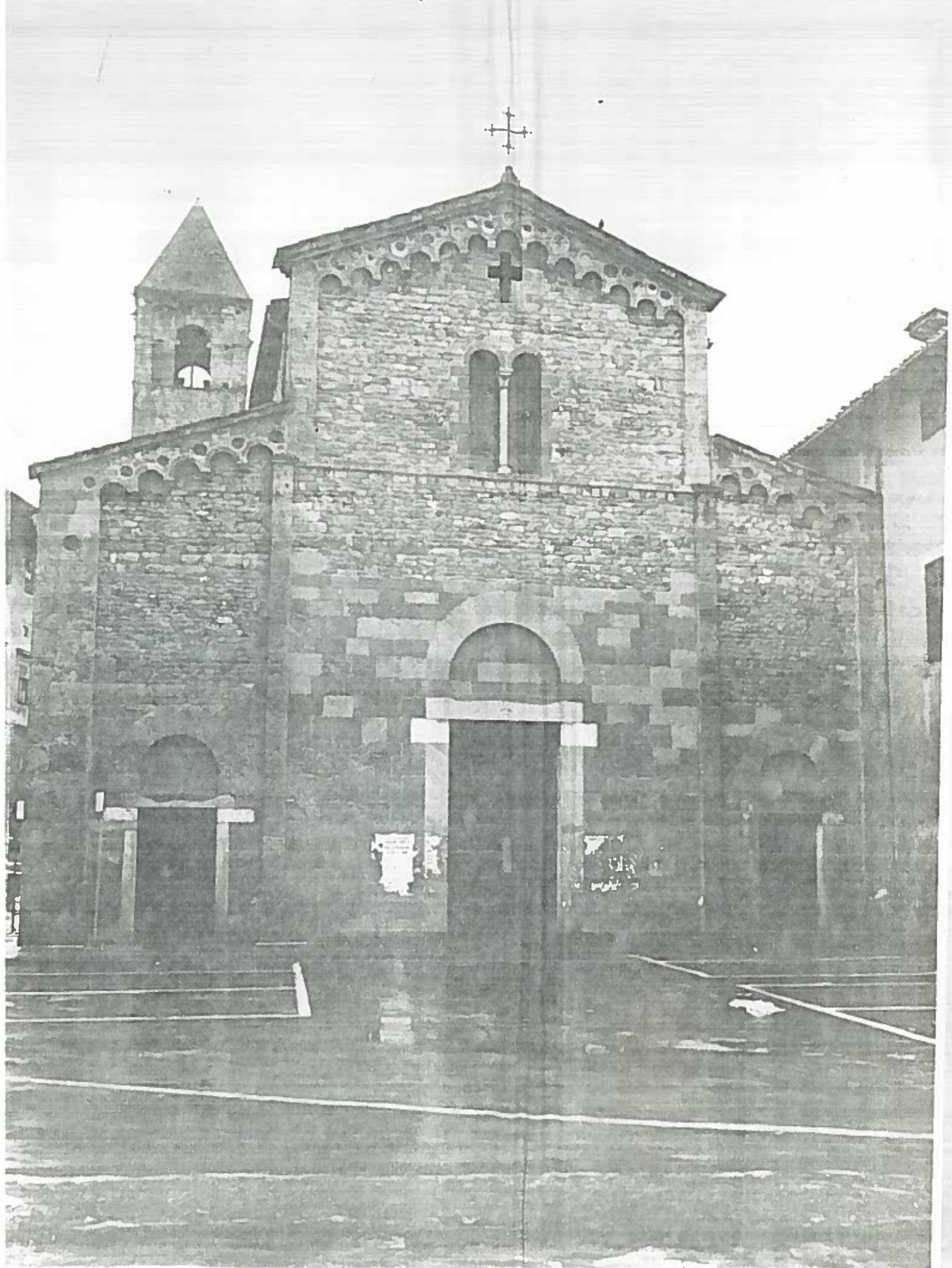
P.zza Buonamicia CHIESA DI S. SISTO ISOLATO 176/17 NEGATIVO 18182